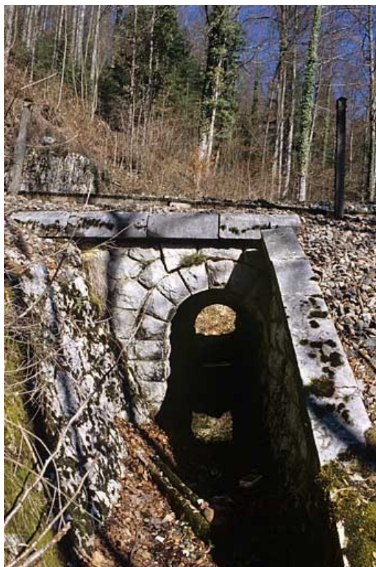
Vue d'ensemble, depuis l'aval (sud). 39, Morbier, lieudit : la Doye Gabet