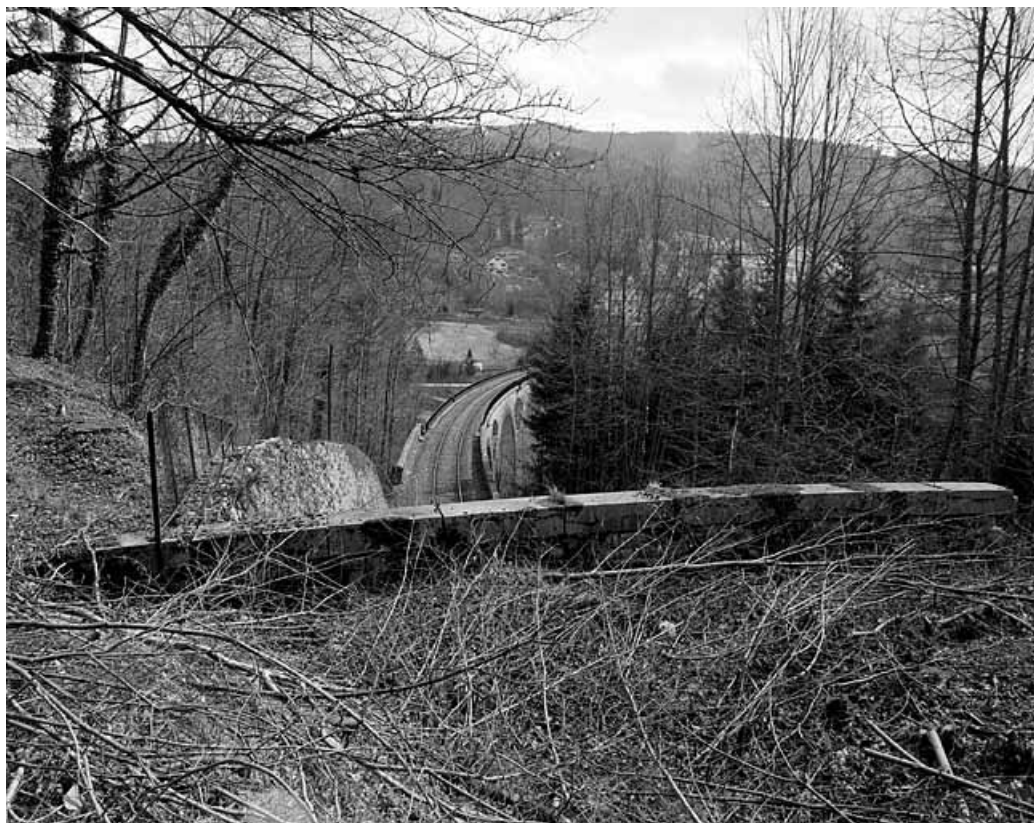
Tête côté Andelot-en-Montagne : partie supérieure de la tranchée couverte.