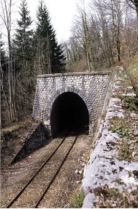
Tête côté Andelot-en-Montagne.