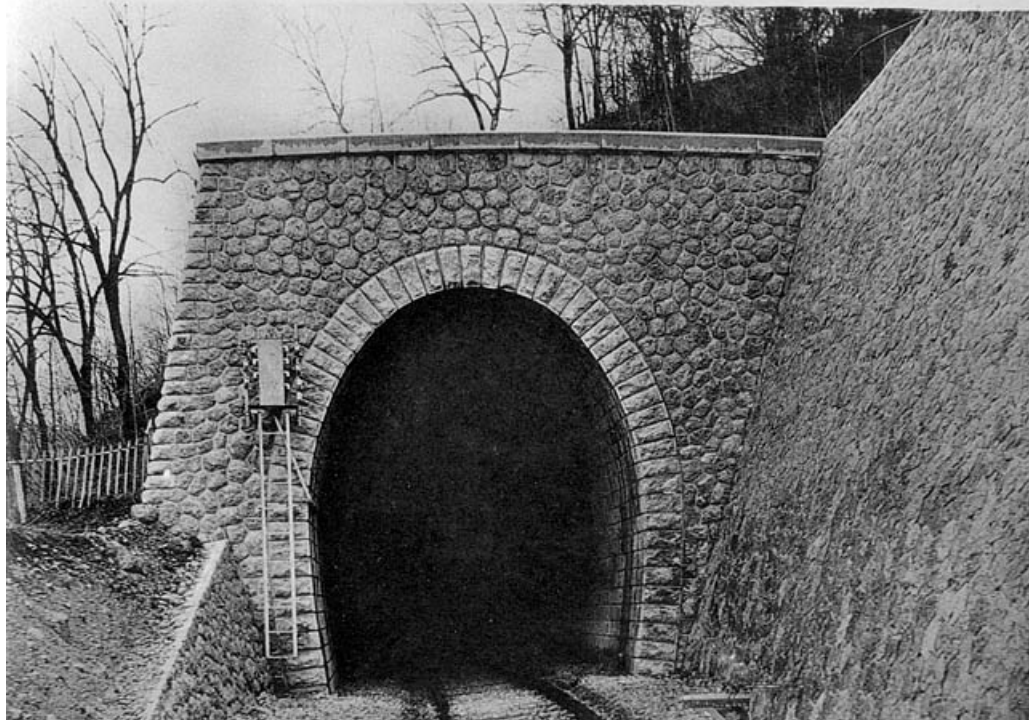
Tête Morez, [1919].