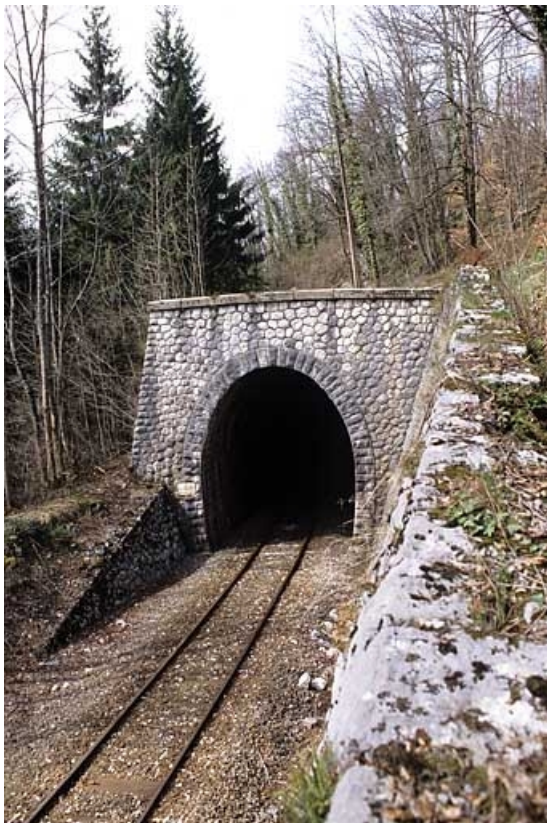
Tête côté Andelot-en-Montagne.