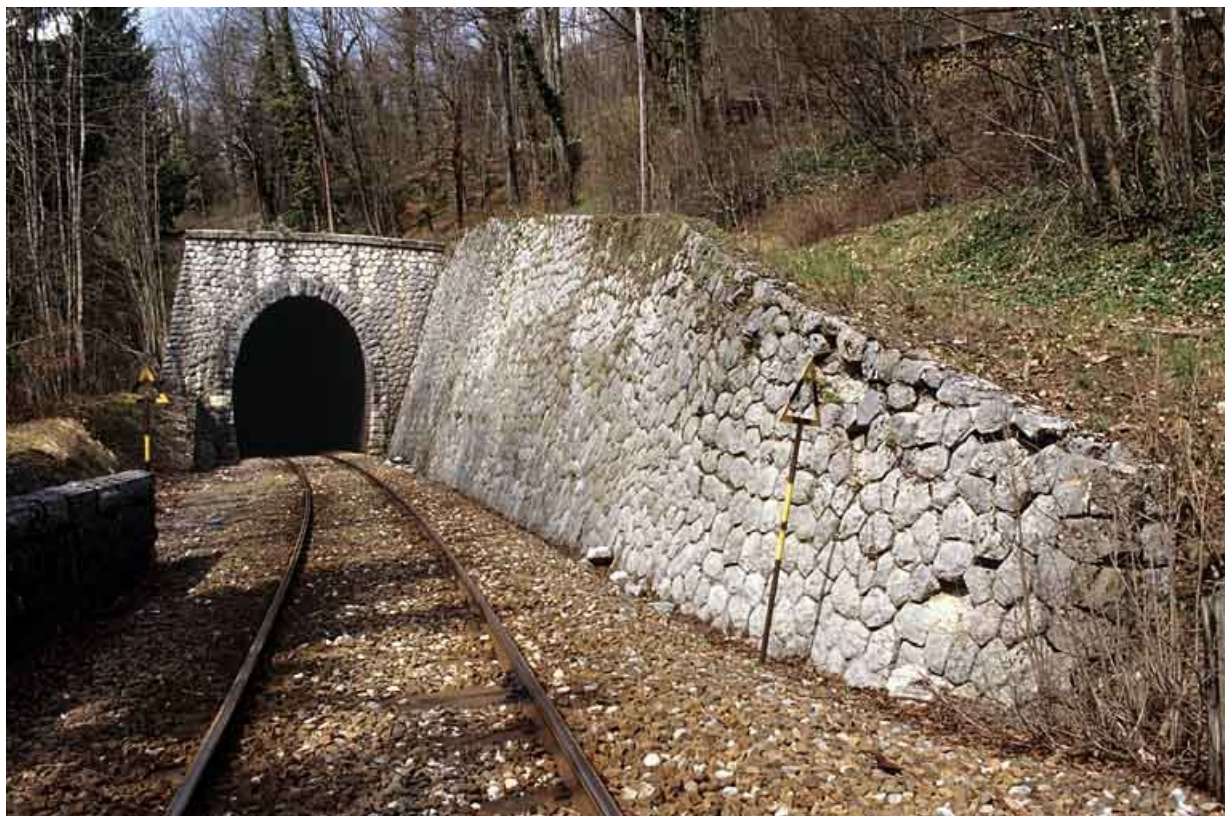
Vue d'ensemble de la tête côté Andelot-en-Montagne.