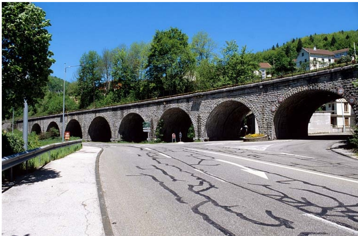
Élévation orientale, vue de trois quarts droite.