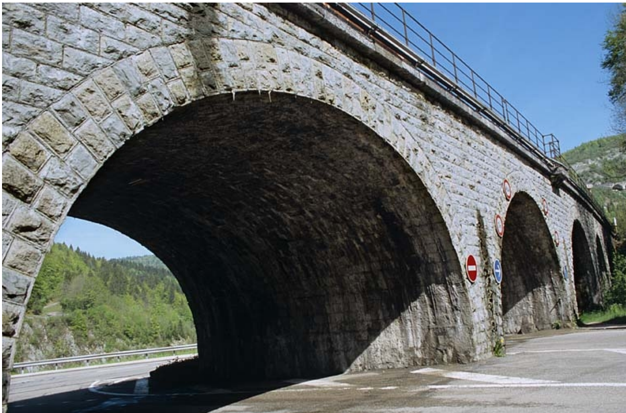
Elévation occidentale vue en enfilade, depuis le sud-est.