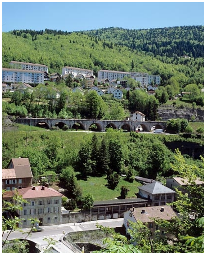
Vue d'ensemble, depuis l'ouest.