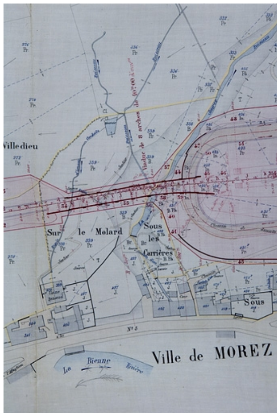
Plan parcellaire des terrains à acquérir dans la traversée de la commune de Morez sur une longueur de 1323,50 m [détail du viaduc], 1894.