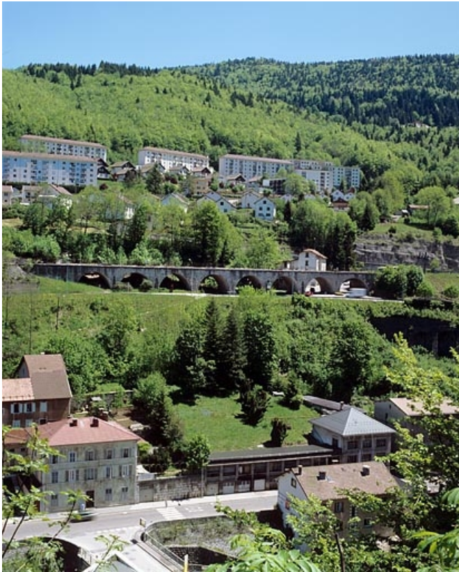
Vue d'ensemble, depuis l'ouest.