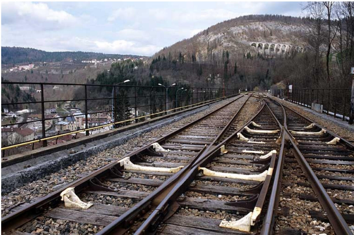
Vue d'ensemble du tablier, depuis la voie côté gare.