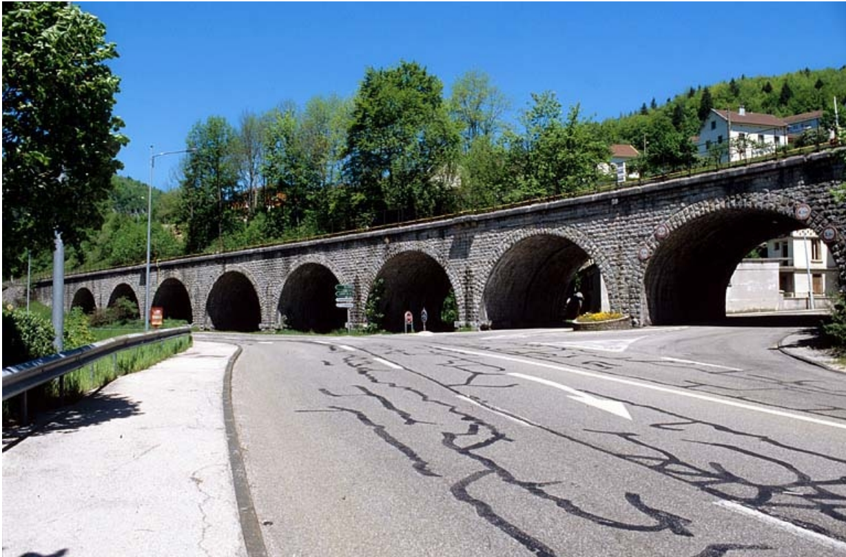
Elévation orientale, vue de trois quarts droite.