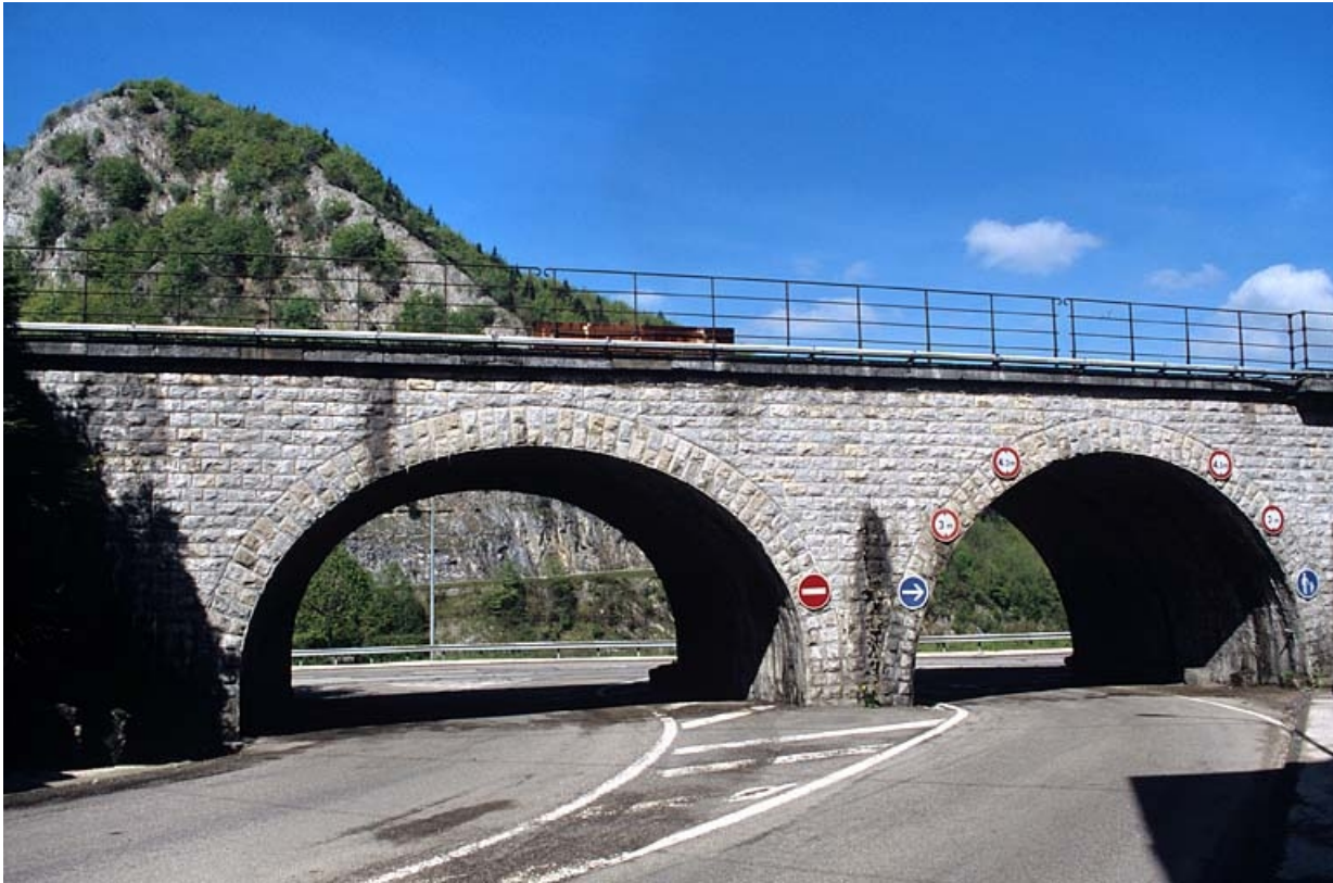
Elévation occidentale : arches enjambant la rue.