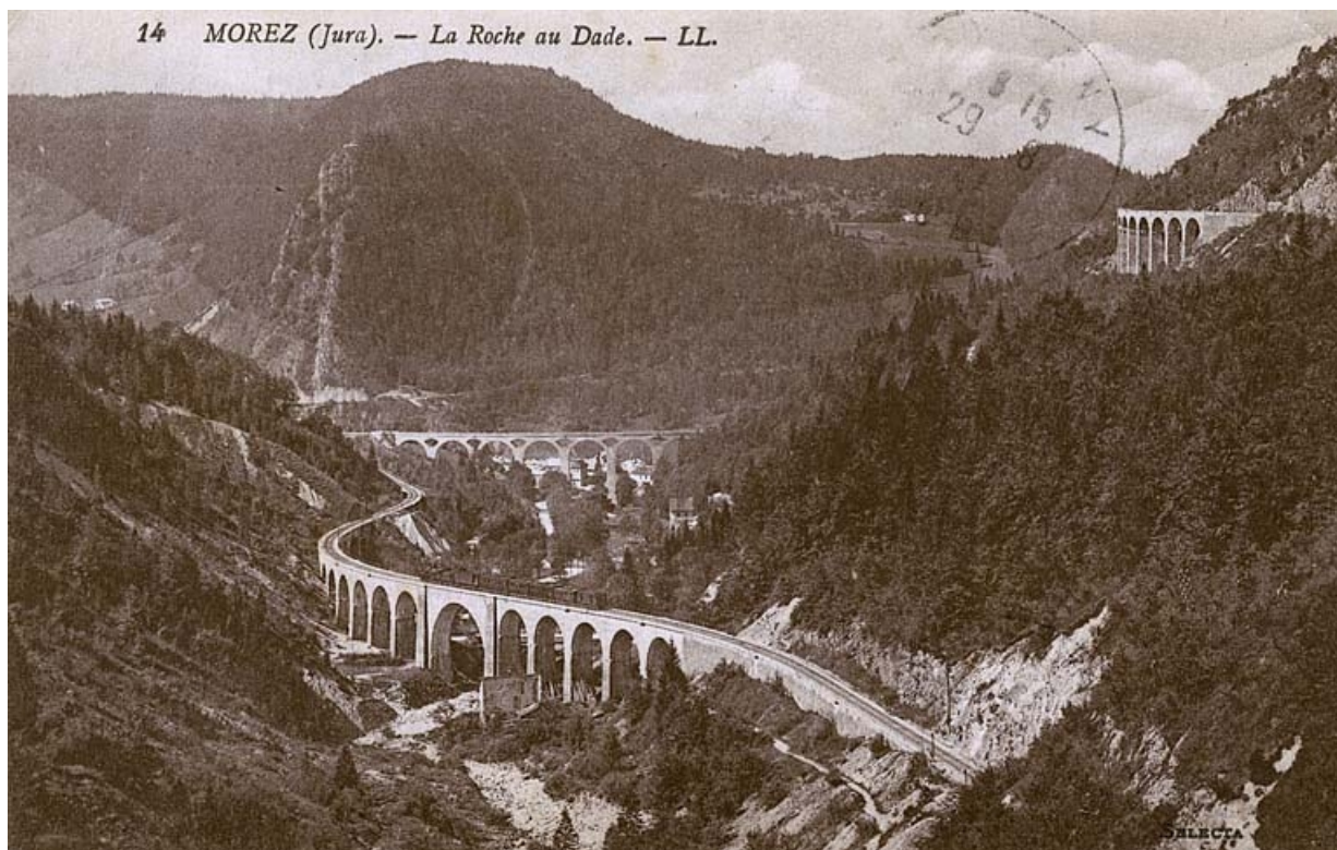
Morez (Jura). - La Roche au Dade, entre 1900 et 1921.