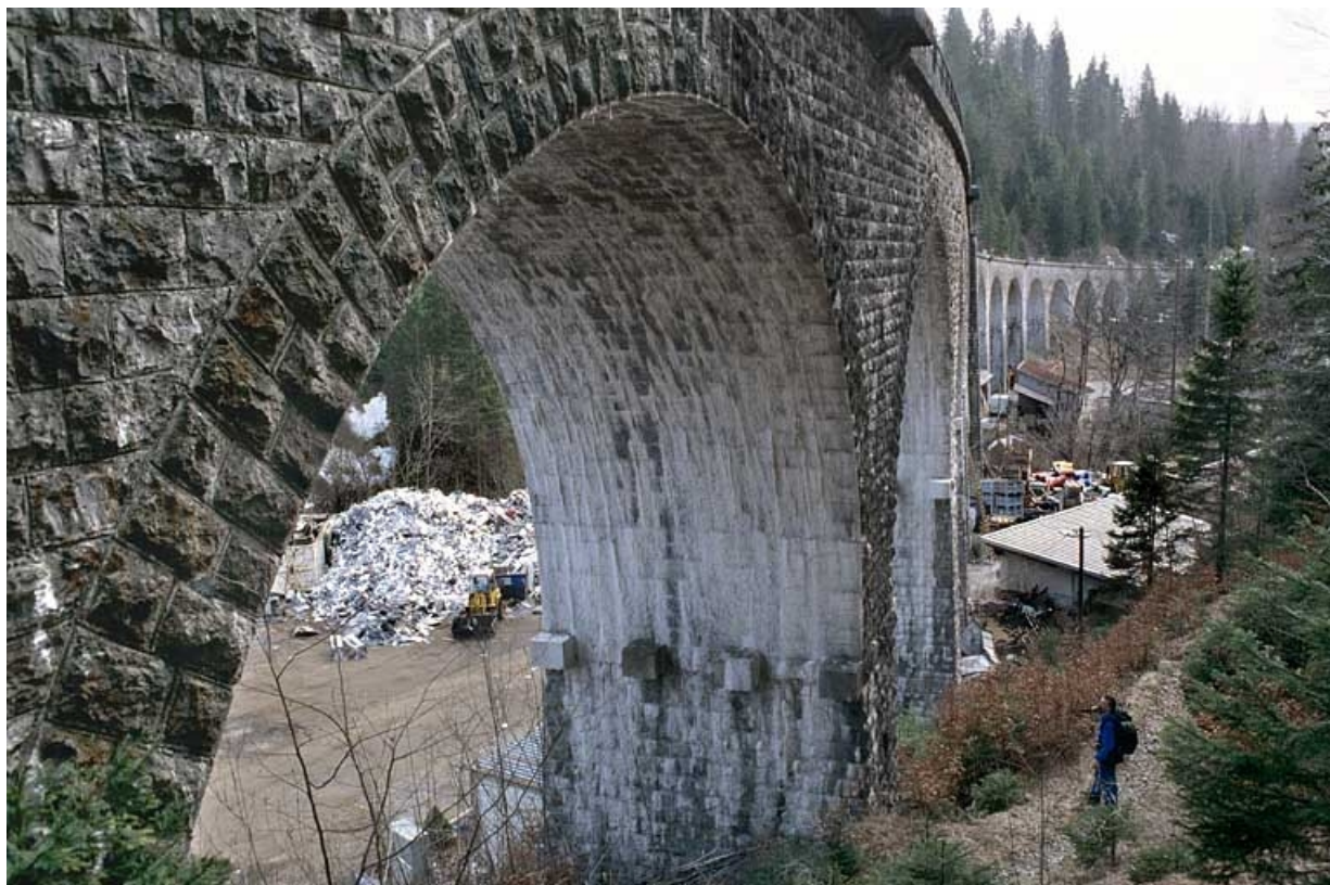
Une arche côté Andelot-en-Montagne, vue en enfilade.