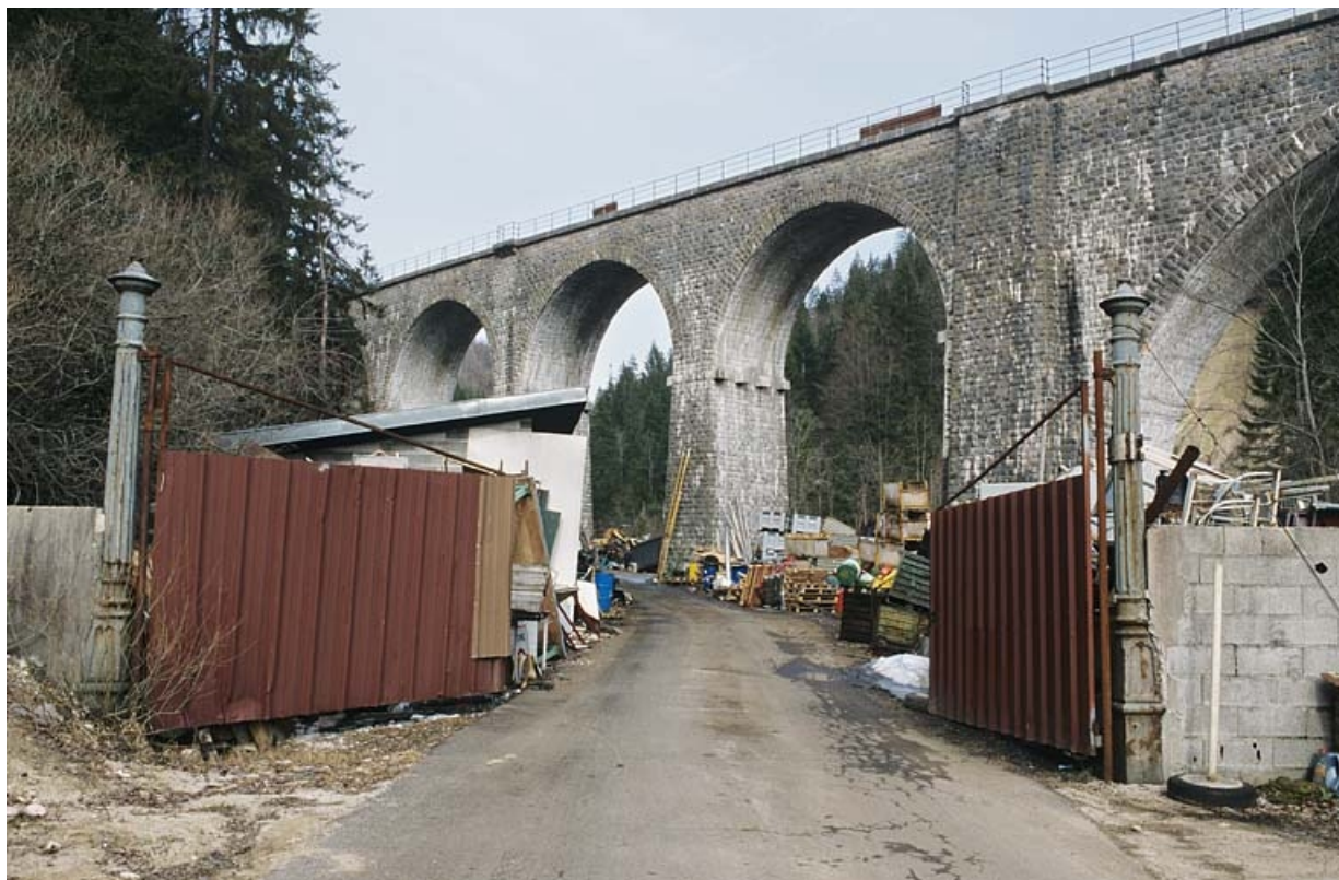
Élévation occidentale (extrémité côté Andelot-en-Montagne), depuis l'ouest.