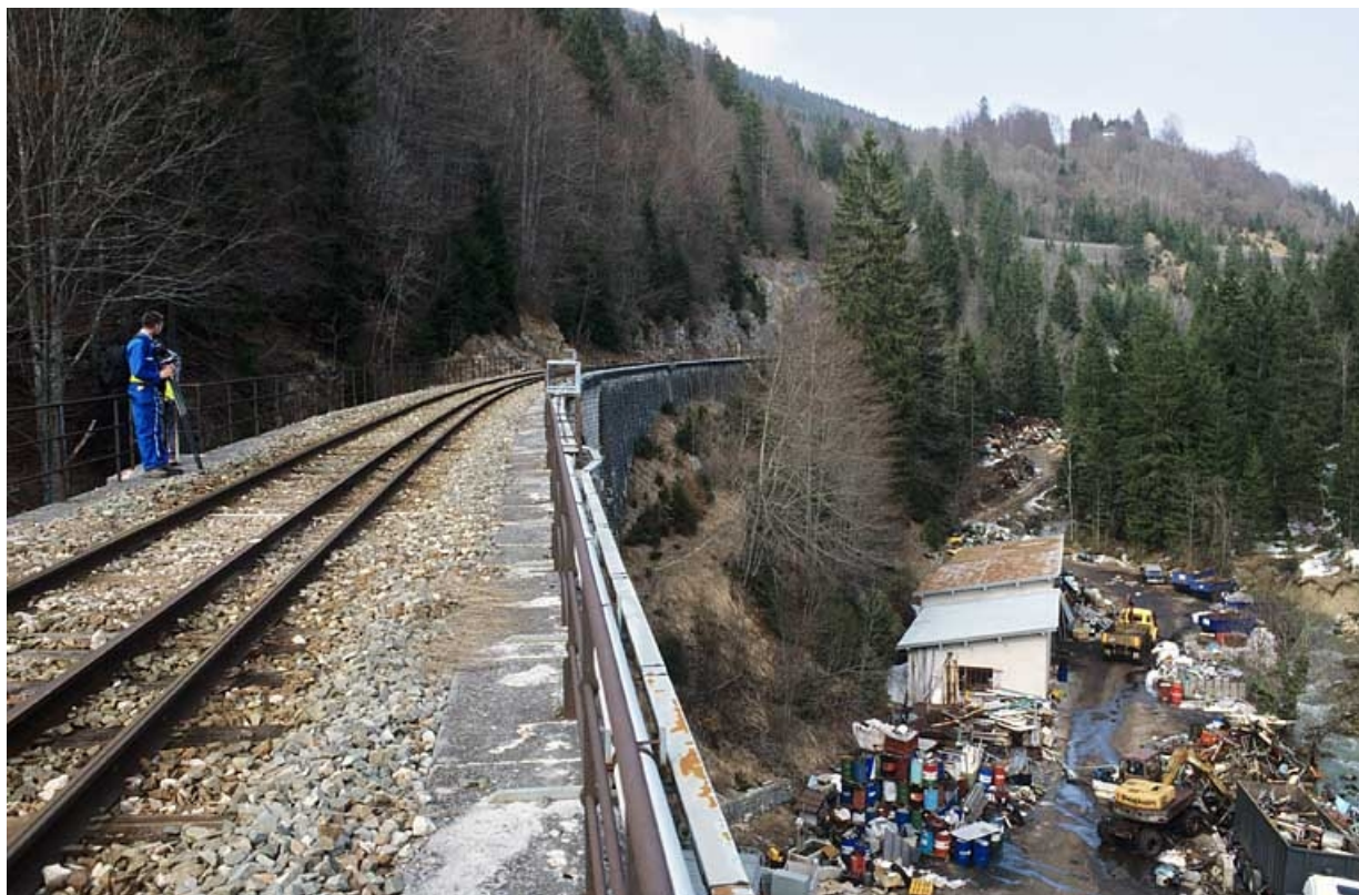
Extrémité côté Andelot-en-Montagne, vue depuis la voie au sud (côté La Cluse). 39, Morbier, lieudit : sous les Bourbes