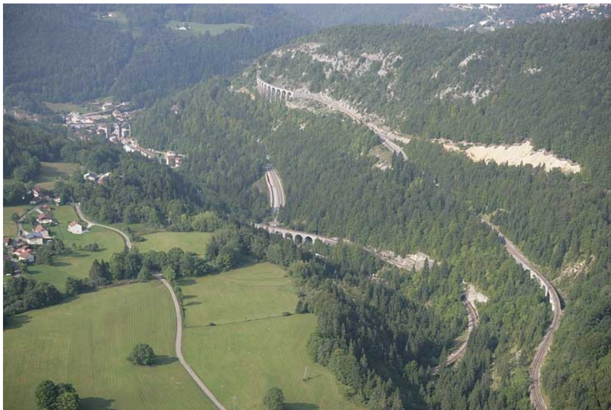
Vue aérienne du viaduc et des autres ouvrages d'art entre Morbier et Morez, depuis le nord-est.