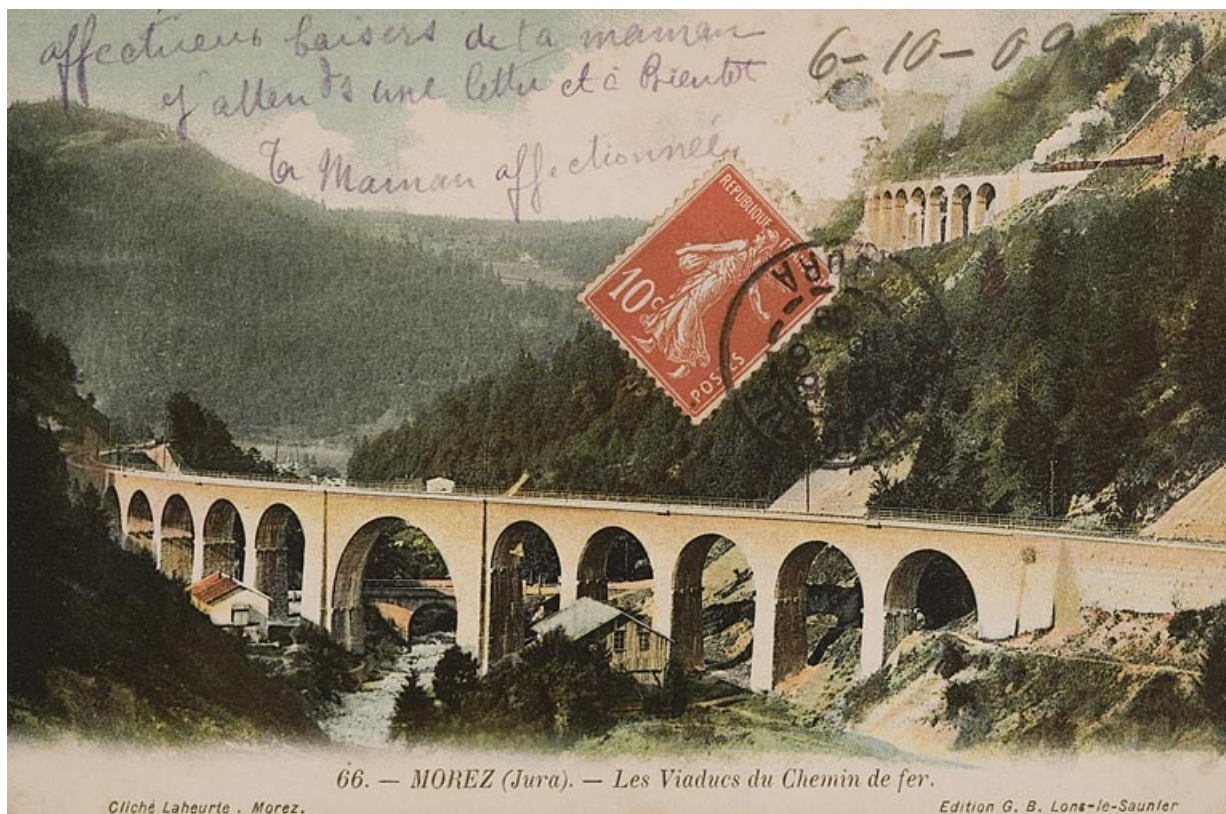
Morez (Jura). - Les Viaducs du Chemin de fer, entre 1900 et 1909.