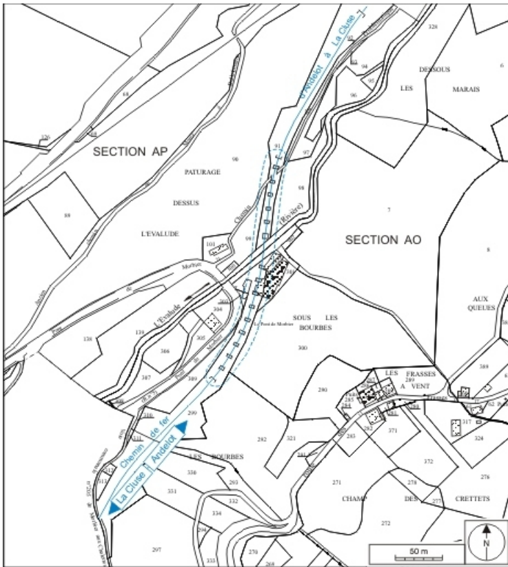
Plan-masse et de situation. Extrait du plan cadastral informatisé, 2006, sections AO et AP, échelle 1:3000. 39, Morbier, lieudit : sous les Bourbes