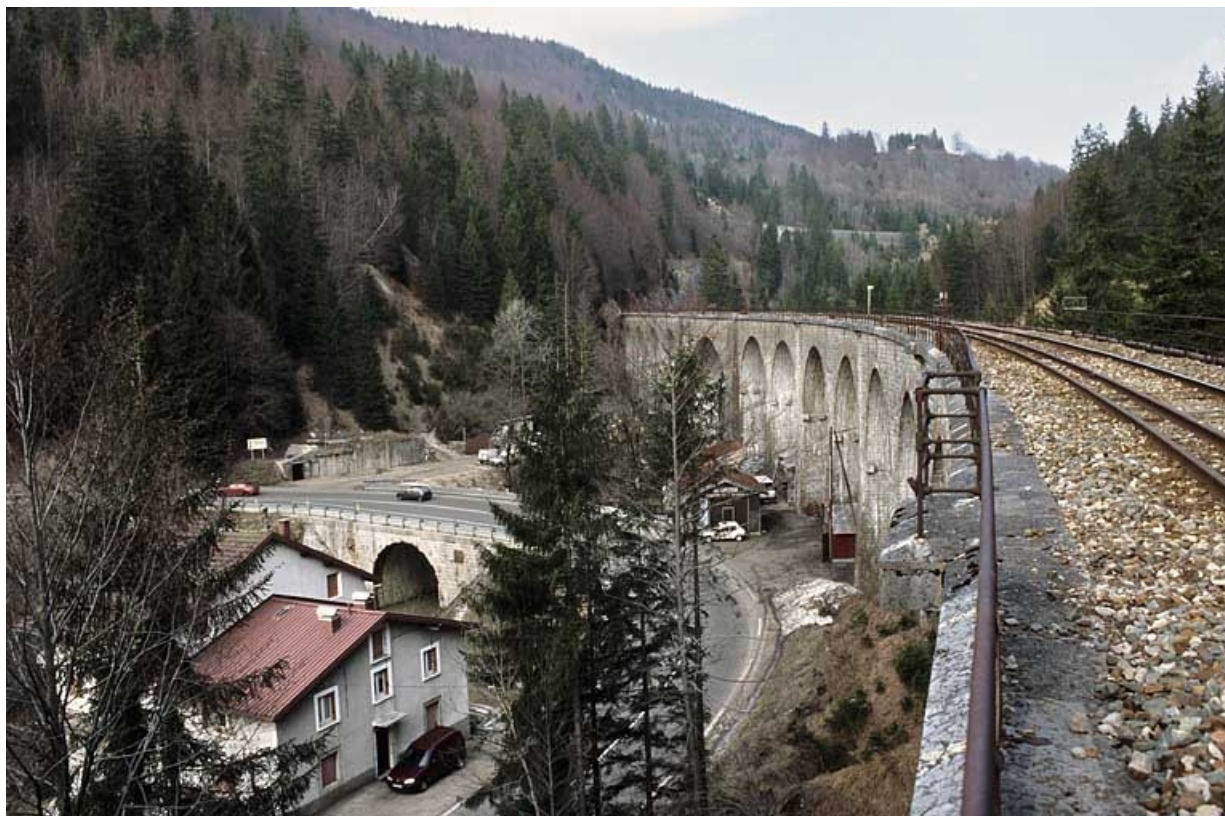
Elévation occidentale vue en enfilade, depuis le sud-ouest (côté La Cluse).