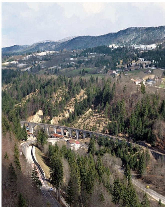
Vue d'ensemble plongeante, depuis l'ouest.