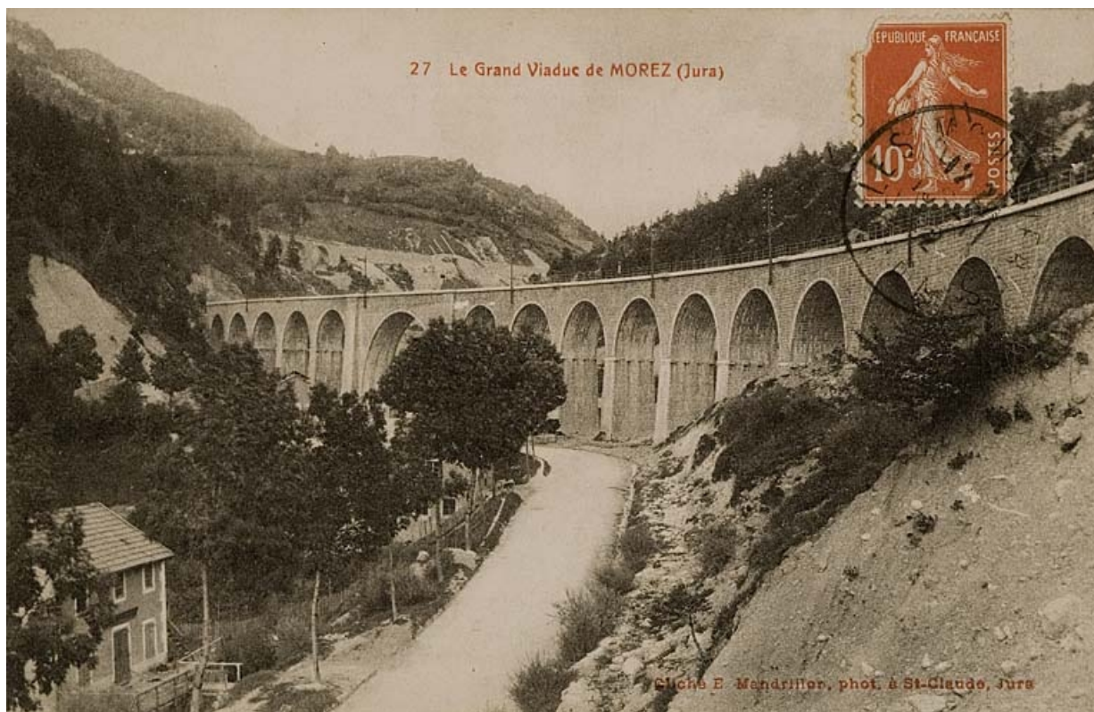
Le grand Viaduc de Morez [le viaduc de l'Evalude, vu du sud], entre 1900 et 1912.