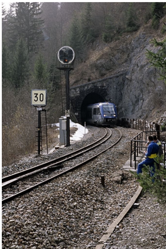
Vue d'ensemble, depuis le nord-est (côté Andelot-en-Montagne), avec autorail X 73500. 39, Bellefontaine, lieudit : Pâturage dessus l'Evalude