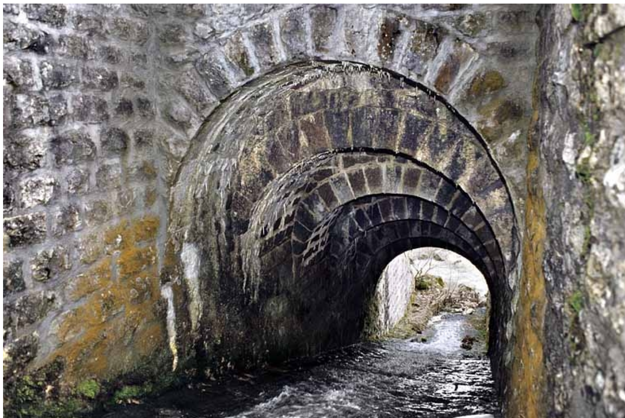
Pont : voûte appareillée en rouleaux à ressauts, depuis le nord (amont). 39, Bellefontaine, lieudit : Pâturage dessus l'Evalude