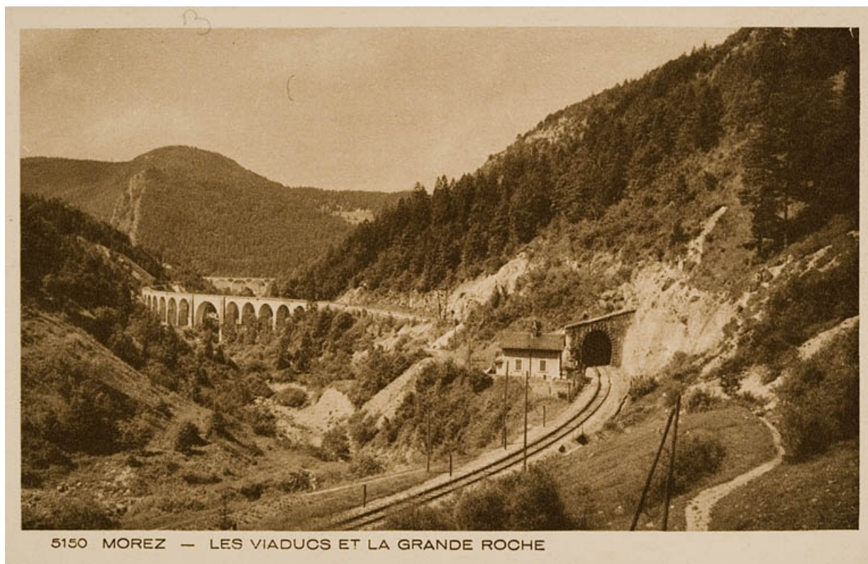
Morez - Les Viaducs et la Grande Roche, milieu 20e siècle.

39, Bellefontaine, lieudit : Pâturage dessus l'Evalude