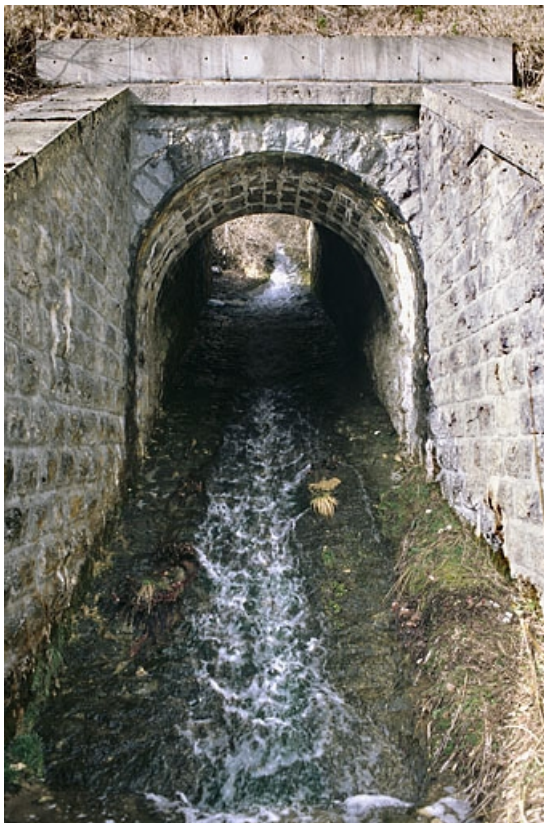
Pont : vue d'ensemble, depuis le sud (aval).

39, Bellefontaine, lieudit : Pâturage dessus l'Evalude