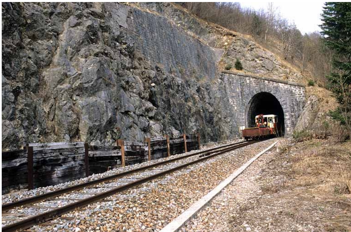
Tunnel : tête sud-ouest (côté La Cluse), avec draisine.

39, Bellefontaine, lieudit : Pâturage dessus l'Evalude