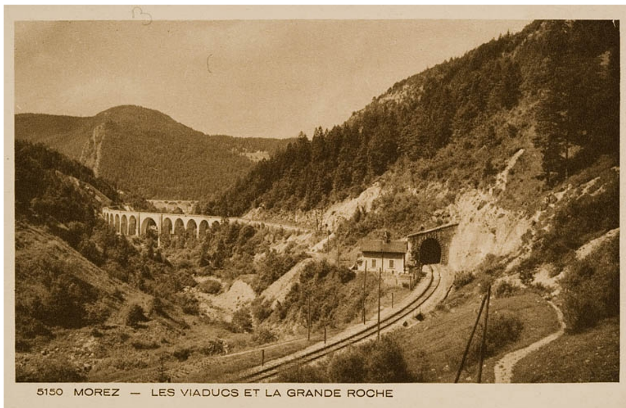
Morez - Les Viaducs et la Grande Roche, milieu 20e siècle.

39, Bellefontaine, lieudit : Pâturage dessus l'Evalude