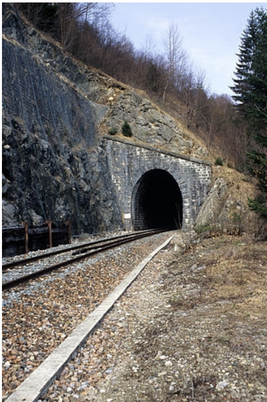
Tunnel : tête sud-ouest (côté La Cluse).

39, Bellefontaine, lieudit : Pâturage dessus l'Evalude