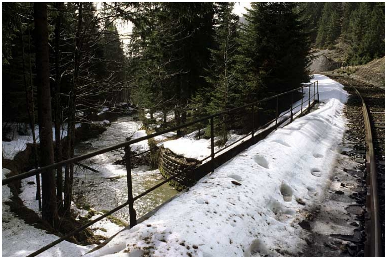
Garde-corps sud (aval) et ruisseau de l'Evalude canalisé.