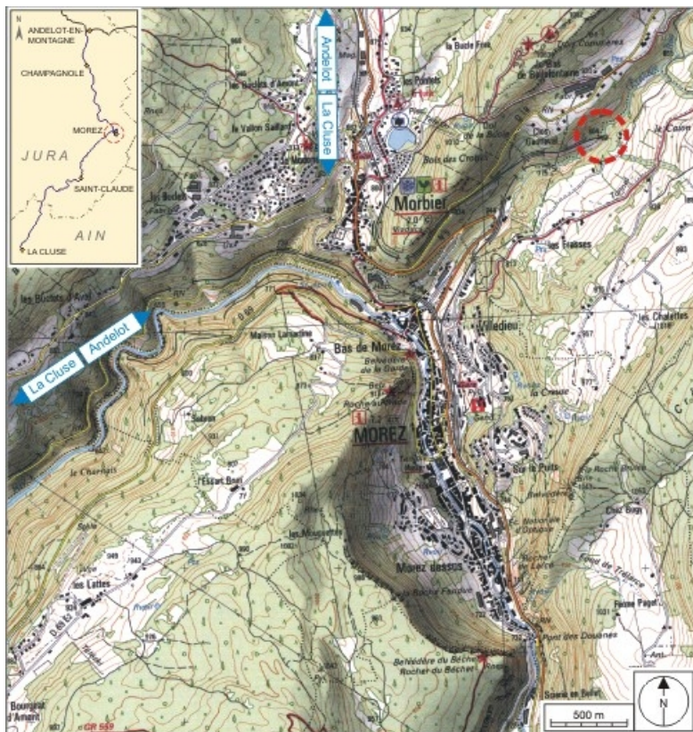
Carte et schéma de localisation. Carte topographique, IGN, 2000, dalles F087_050 et F088_050, échelle 1:25 000. Scan 25, licence n° 2008/CISE/2968.