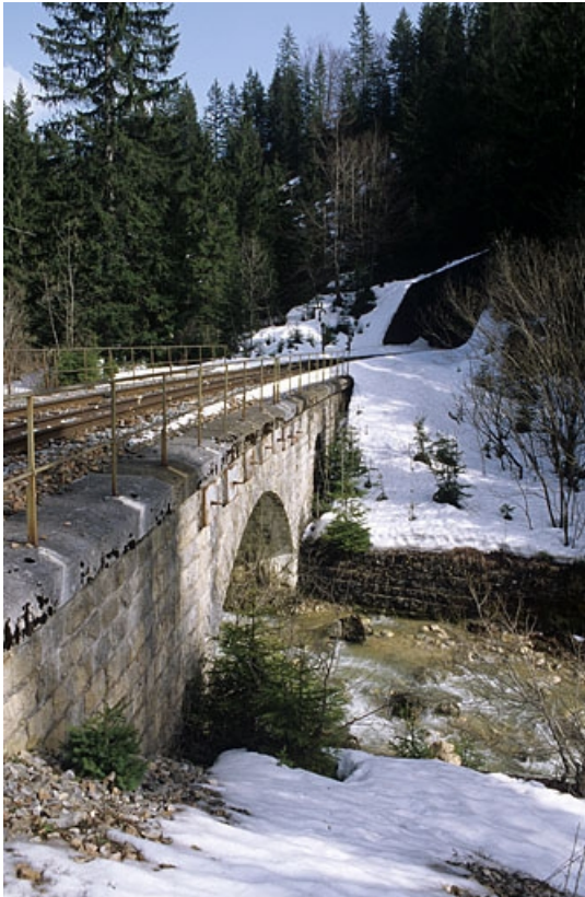
Vue d'ensemble, depuis le sud-ouest (aval).