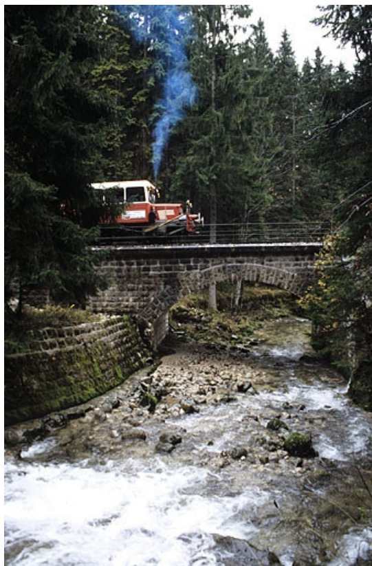
Élévation nord (amont), avec draine.