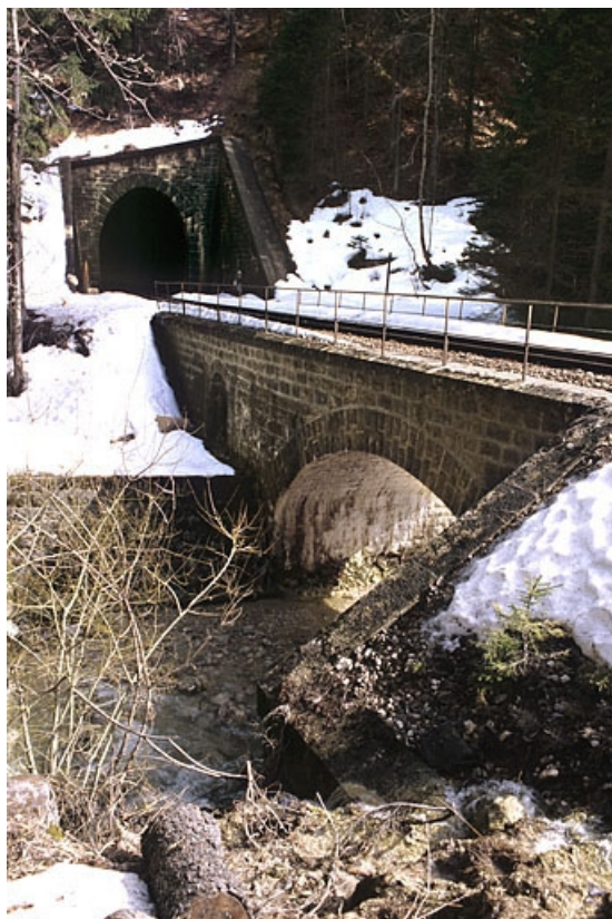
Vue d'ensemble, depuis le nord-ouest (amont). 39, Bellefontaine, lieudit : le Caton