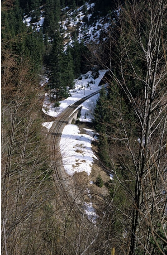
Vue d'ensemble plongeante, depuis le sud-ouest (côté Andelot-en-Montagne). 39, Bellefontaine, lieudit : le Caton