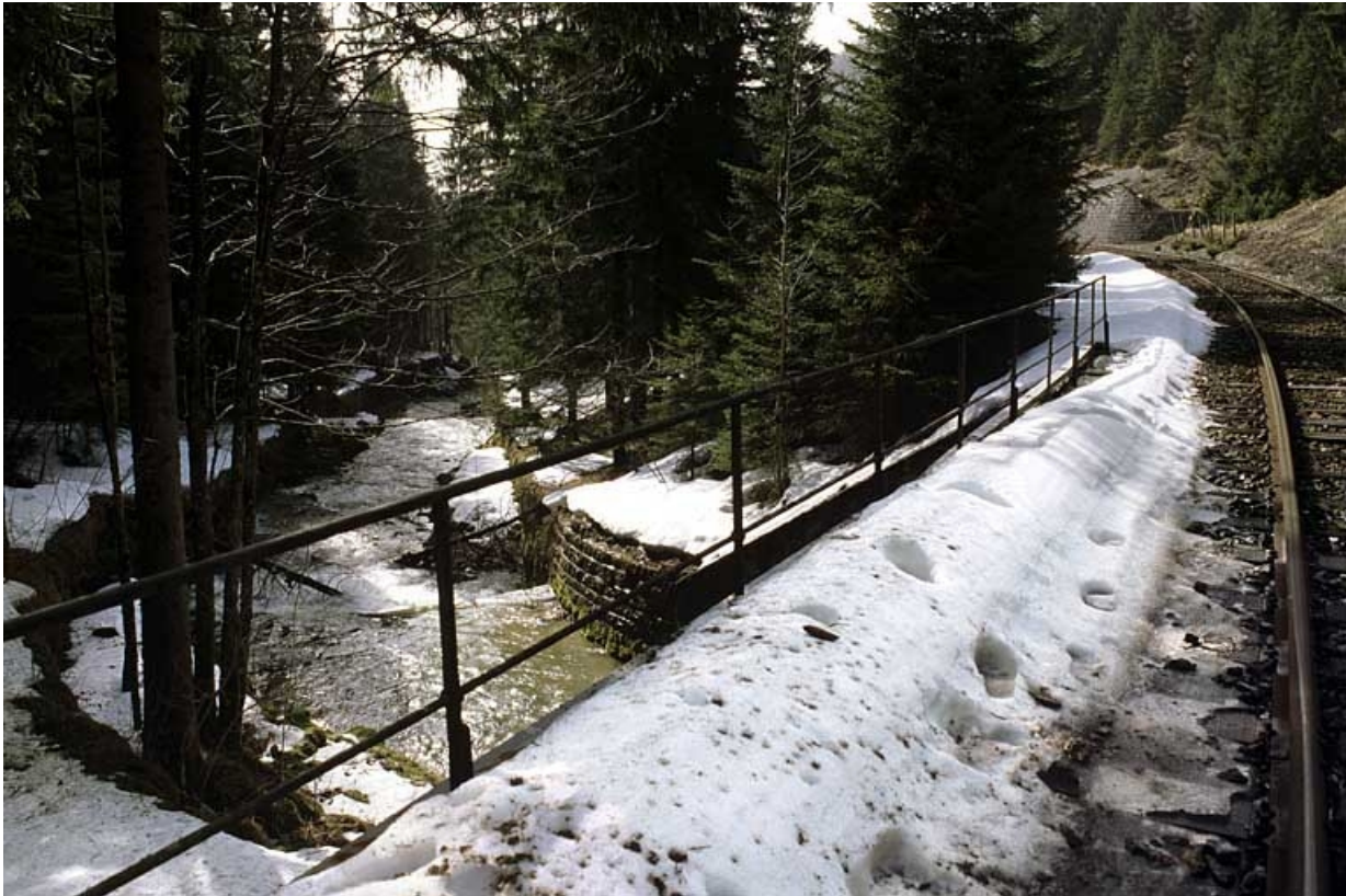
Garde-corps sud (aval) et ruisseau de l'Evalude canalisé.