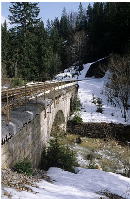
Vue d'ensemble, depuis le sud-ouest (aval).