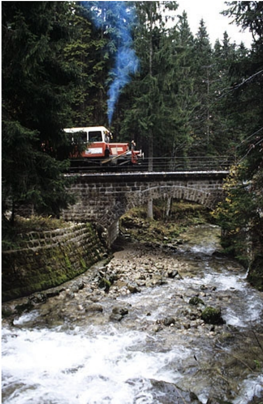
Elévation nord (amont), avec draisine.