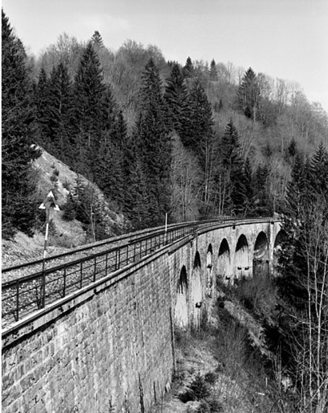
Elévation sud vue en enfilade, depuis le sud-ouest (côté Andelot-en-Montagne). 39, Bellefontaine, lieudit : le Bois des Crottes