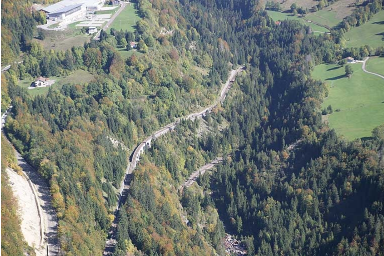
Vue aérienne, depuis le sud-ouest.

39, Bellefontaine, lieudit : le Bois des Crottes