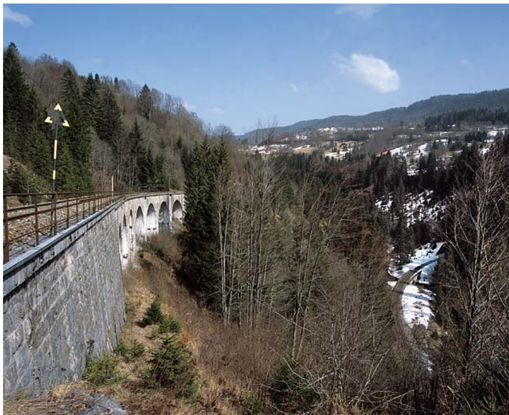
Vue d'ensemble, depuis le sud-ouest (côté Andelot-en-Montagne).

39, Bellefontaine, lieudit : le Bois des Crottes