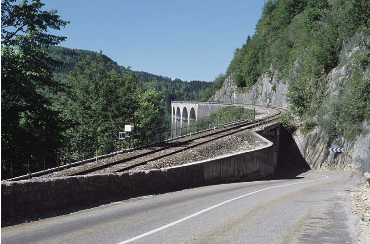
Vue d'ensemble depuis la route départementale n° 18, au nord-est.

39, Morbier C.D. 18, lieudit : le Bois des Crottes