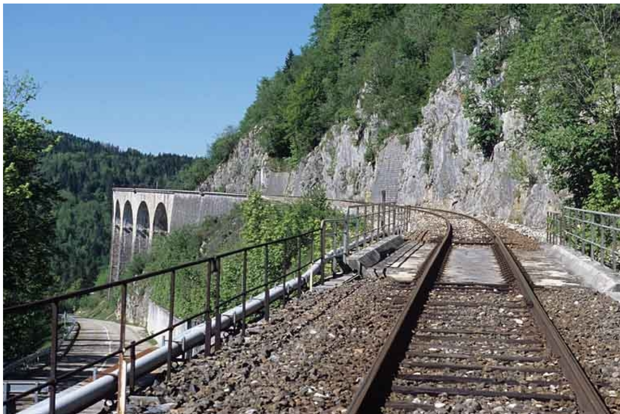
Tablier et garde-corps, depuis le côté La Cluse.

39, Morbier C.D. 18, lieudit : le Bois des Crottes