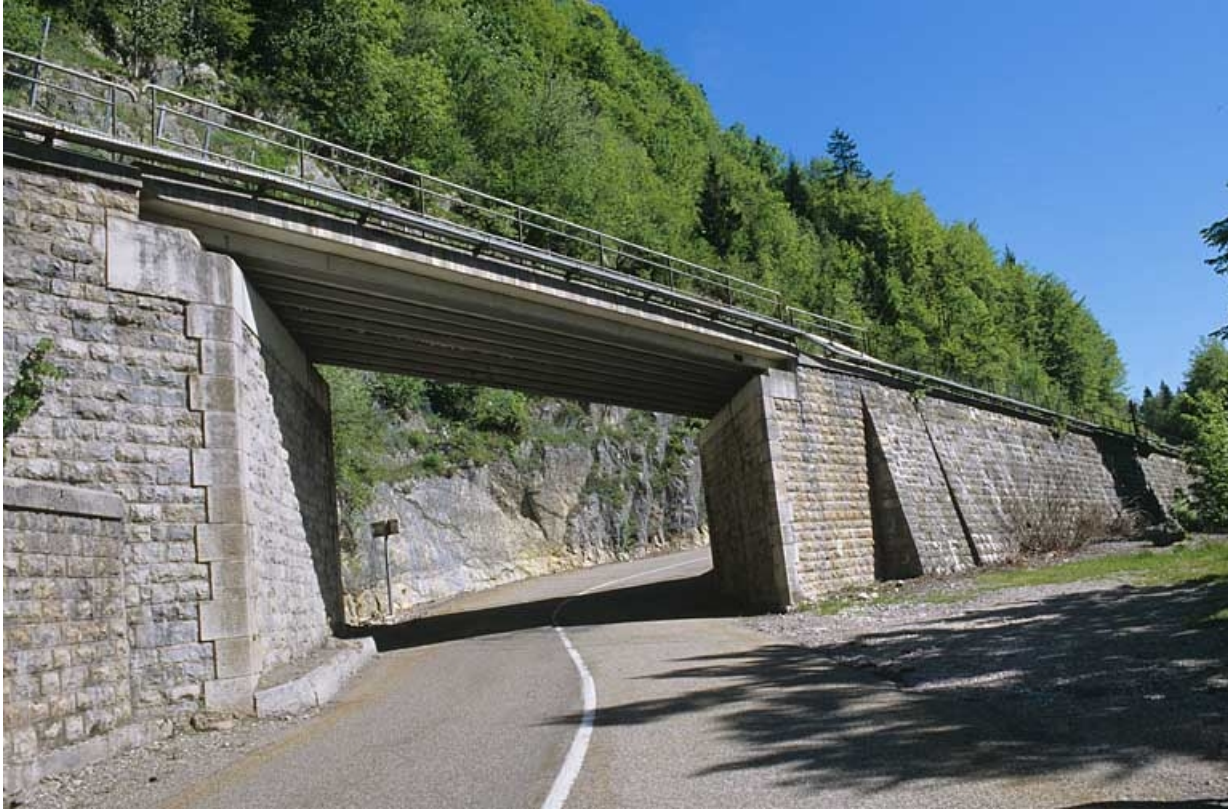
Elévation sud depuis la route départementale n° 18, au sud-ouest.

39, Morbier C.D. 18, lieudit : le Bois des Crottes