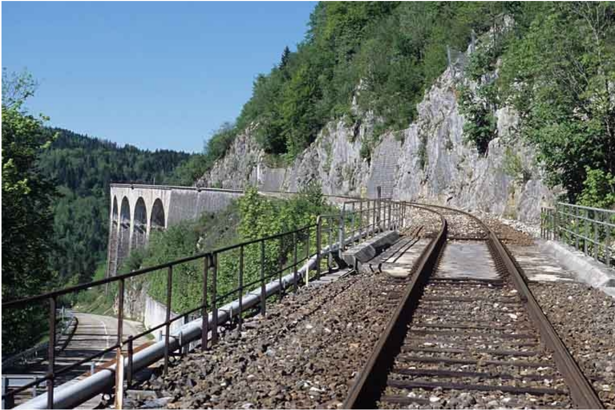
Tablier et garde-corps, depuis le côté La Cluse.

39, Morbier C.D. 18, lieudit : le Bois des Crottes