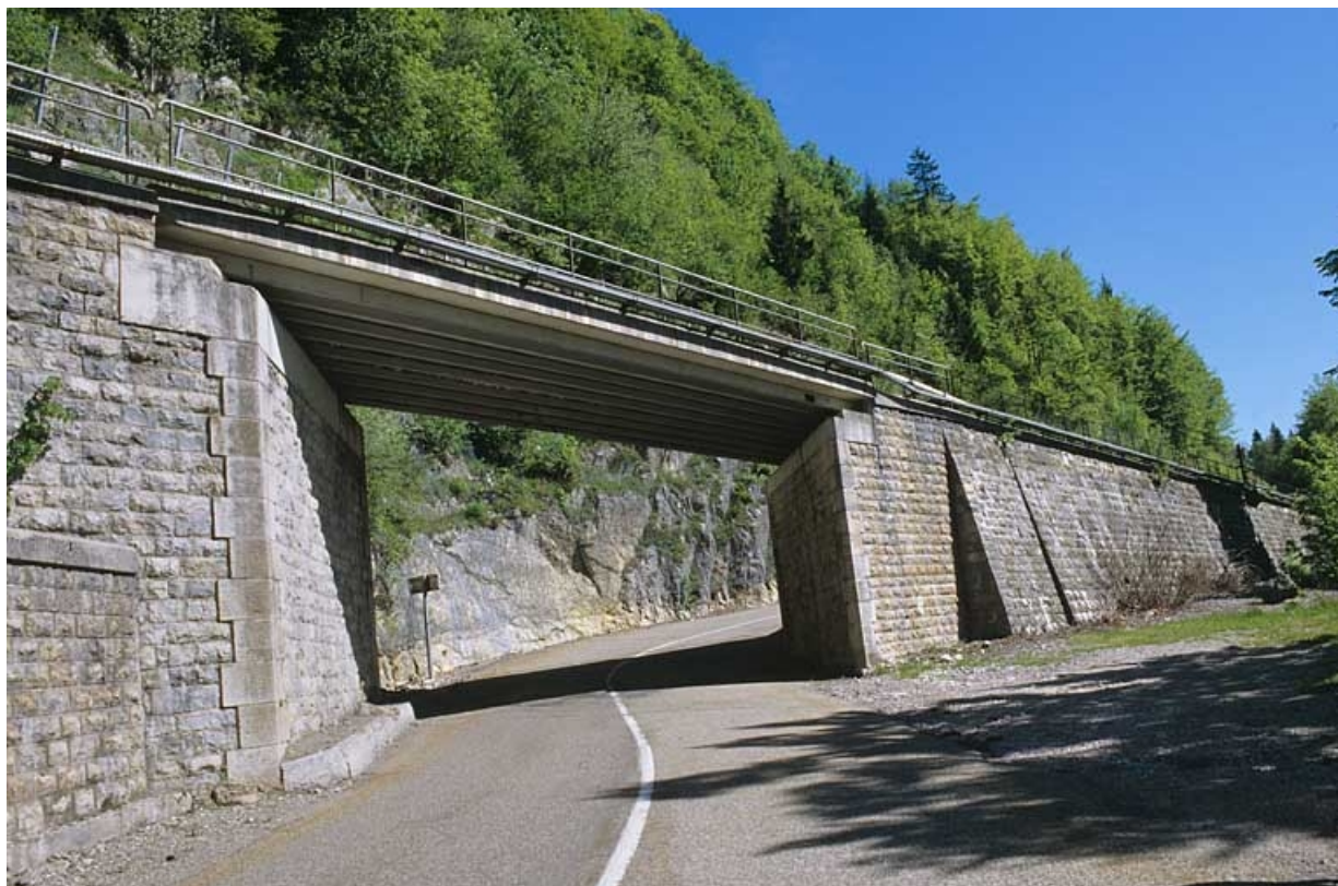
Élévation sud depuis la route départementale n° 18, au sud-ouest.

39, Morbier C.D. 18, lieudit : le Bois des Crottes