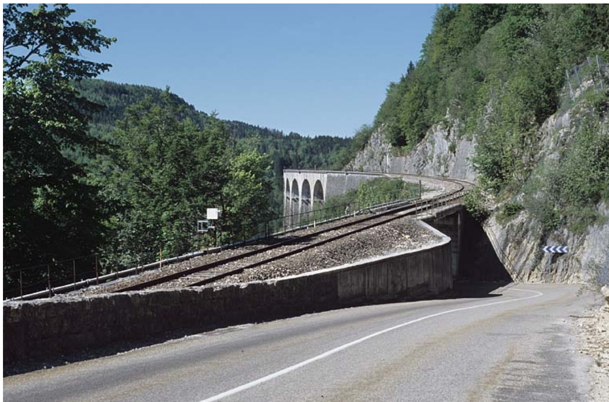
Vue d'ensemble depuis la route départementale n° 18, au nord-est.

39, Morbier C.D. 18, lieudit : le Bois des Crottes