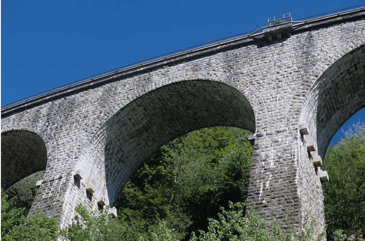
Une arche, vue en contre-plongée.

39, Morbier, lieudit : le Bois des Crottes