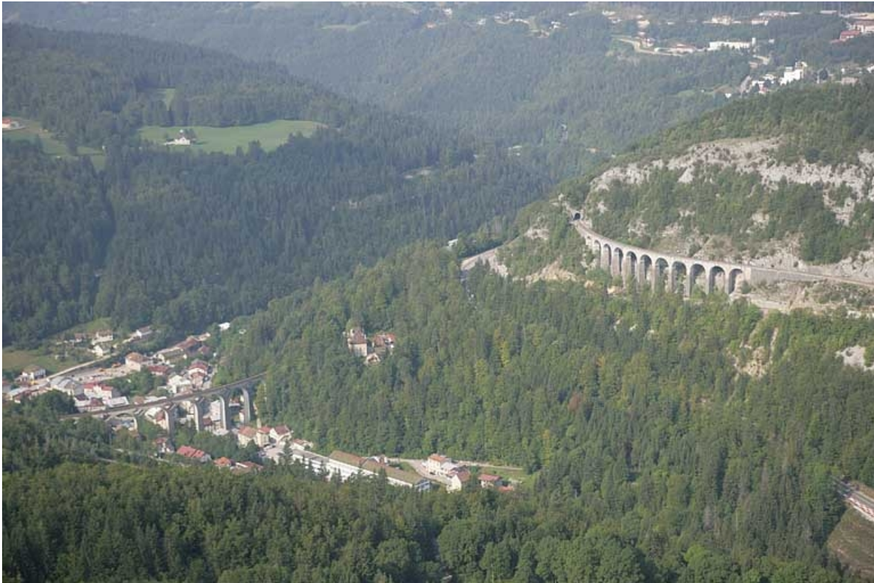
Vue aérienne du viaduc et du tunnel des Crottes, depuis l'est.

39, Morbier, lieudit : le Bois des Crottes