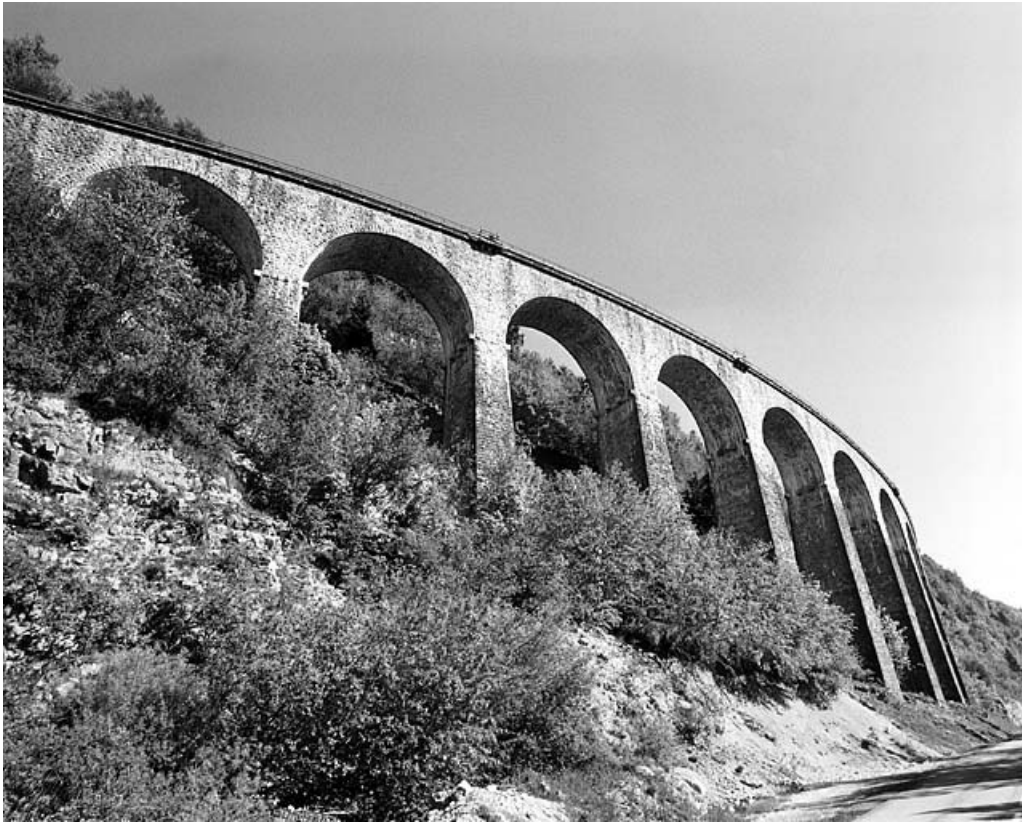
Vue en contre-plongée, depuis la route départementale n° 18.

39, Morbier, lieudit : le Bois des Crottes