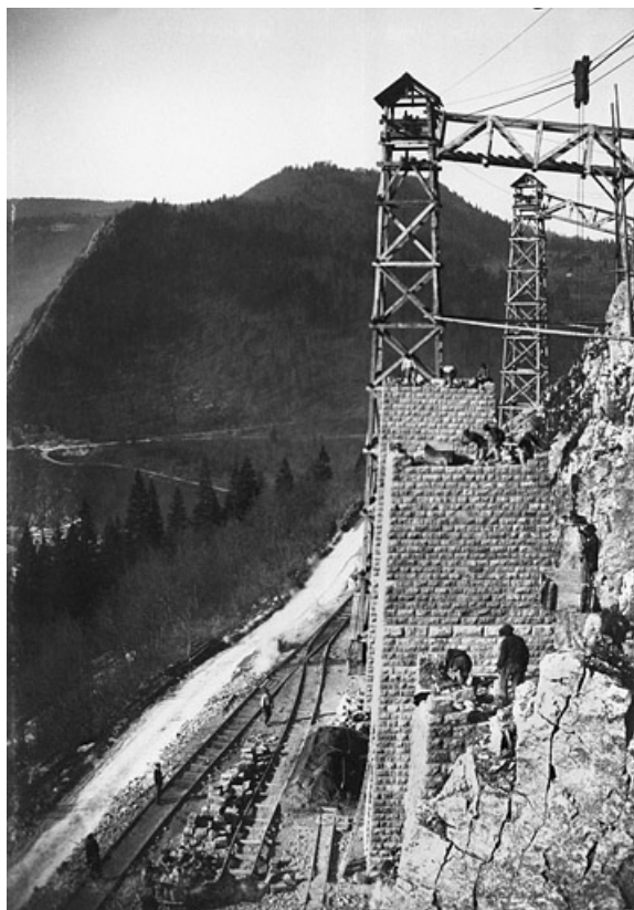
Travaux du chemin de fer : les premières piles du viaduc des Crottes vues de 17 m de hauteur, 1899.

39, Morbier, lieudit : le Bois des Crottes