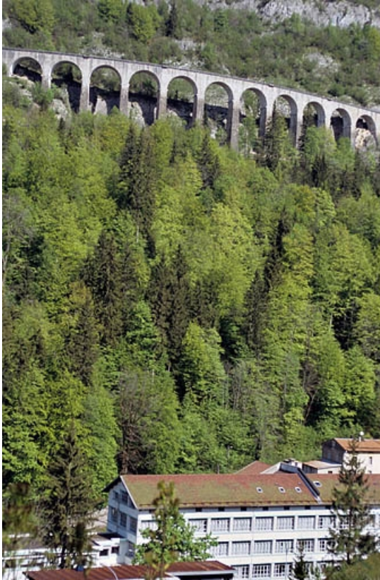
Elévation orientale, vue depuis Morez.

39, Morbier, lieudit : le Bois des Crottes