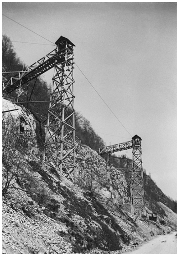
Travaux du chemin de fer : les pylônes pour la construction du viaduc des Crottes, 1899.

39, Morbier, lieudit : le Bois des Crottes