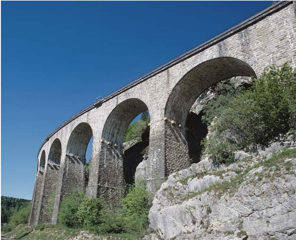
Extrémité côté La Cluse (nord-est).

39, Morbier, lieudit : le Bois des Crottes