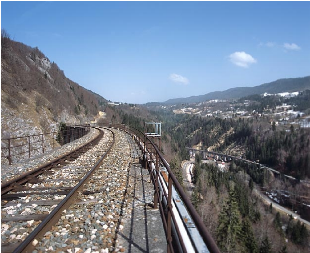
Vue d'ensemble du tablier et des garde-corps, depuis le côté Andelot-en-Montagne.

39, Morbier, lieudit : le Bois des Crottes