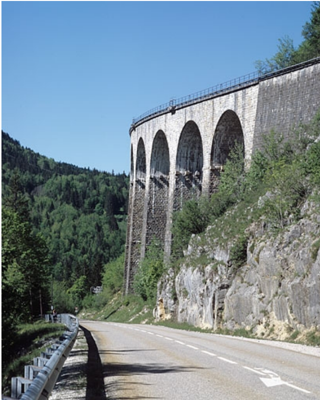
Vue de profil depuis la route départementale n° 18, au nord-est. 39, Morbier, lieudit : le Bois des Crottes