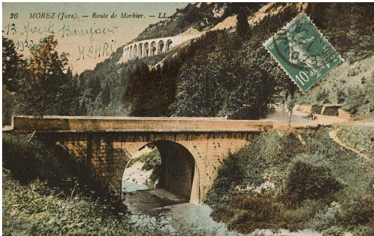
Morez (Jura). - Route de Morbier [viaduc des Crottes et pont routier sur l'Evalude], entre 1900 et 1922.

39, Morbier, lieudit : le Bois des Crottes