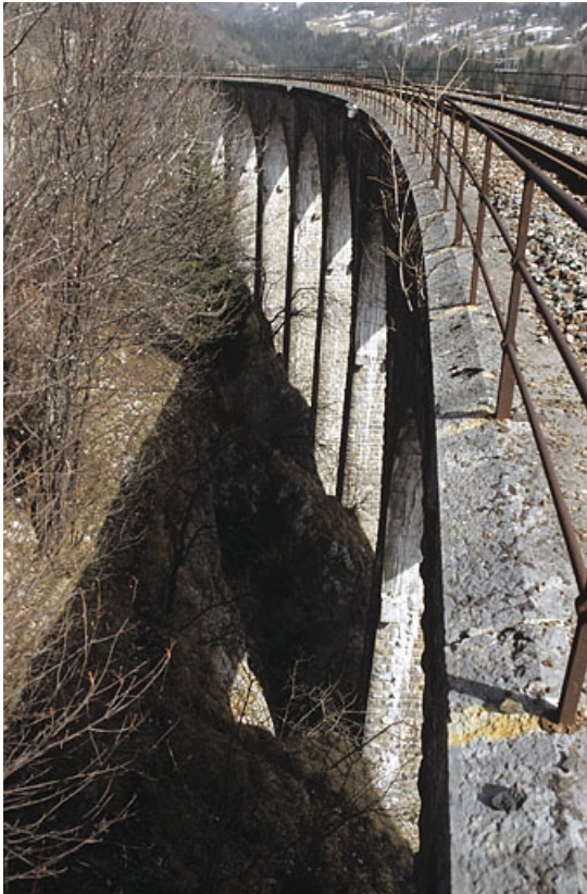
Elévation occidentale vue en enfilade, depuis le côté Andelot-en-Montagne. 39, Morbier, lieudit : le Bois des Crottes