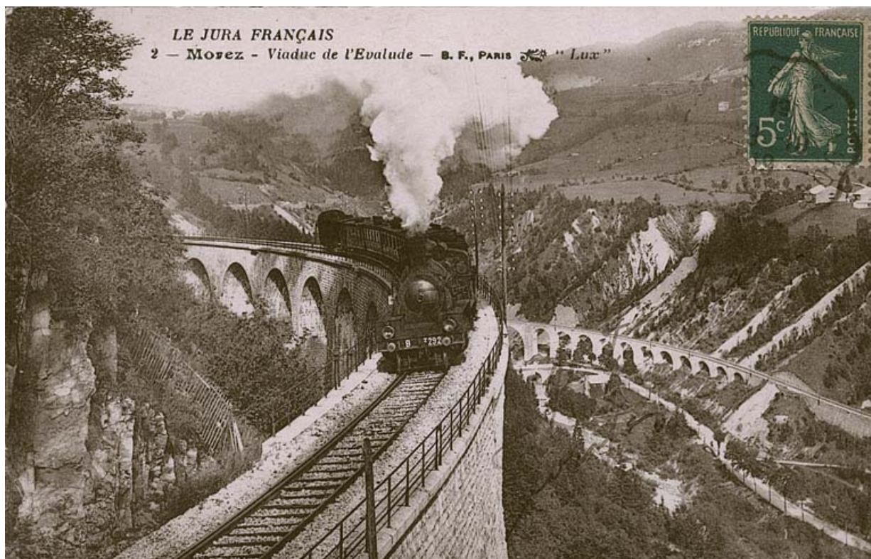
Morez - Viaduc de l'Evalude [locomotive à vapeur venant de Morez et franchissant le viaduc des Crottes], 1er quart 20e siècle. 39, Morbier, lieudit : le Bois des Crottes

Carte postale, s.d. [1er quart 20e siècle, avant 1919], B.F. éd. ?, Catala Frères impr. à Paris Lieu de conservation : collection particulière