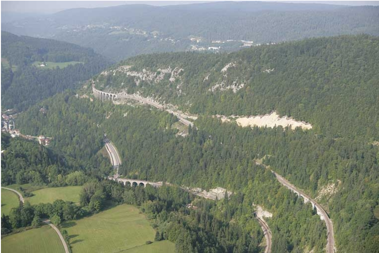
Vue aérienne du viaduc et des autres ouvrages d'art entre Morbier et Morez, depuis le nord-est.

39, Morbier, lieudit : le Bois des Crottes