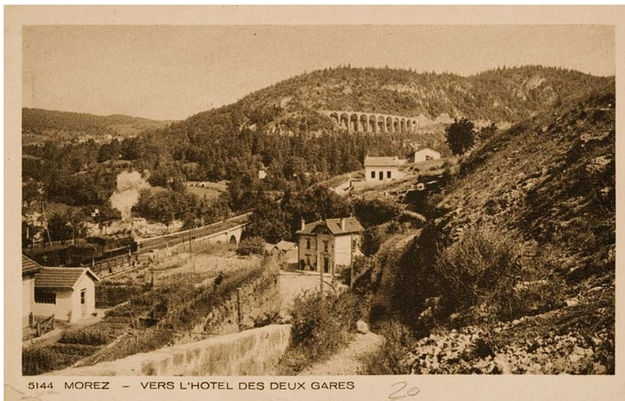
Morez - Vers l'hôtel des Deux gares, 2e quart 20e siècle.

39, Morbier, lieudit : le Bois des Crottes