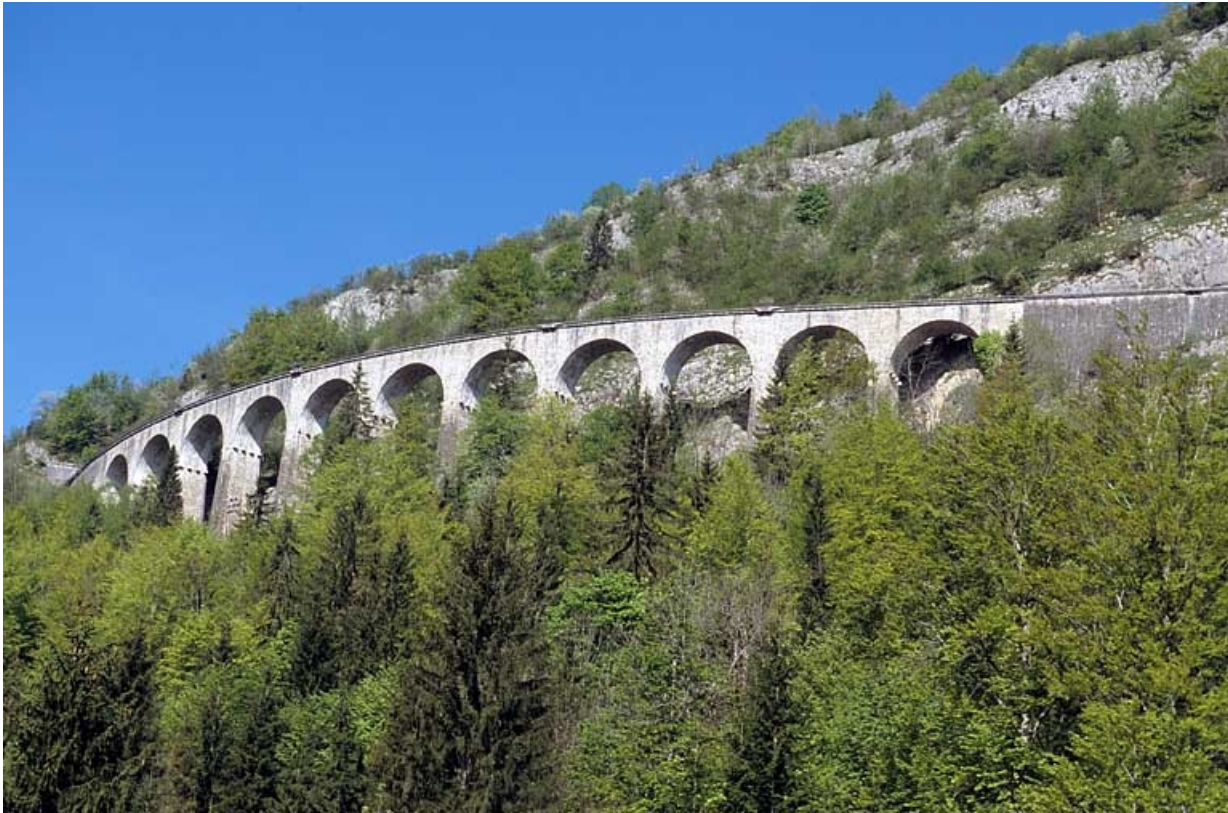
Vue d'ensemble en contre-plongée depuis la vallée, à l'est.

39, Morbier, lieudit : le Bois des Crottes