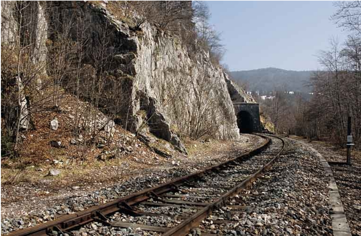
Vue d'ensemble, depuis le nord-ouest (côté Andelot-en-Montagne).

39, Morbier, lieudit : le Bois des Crottes