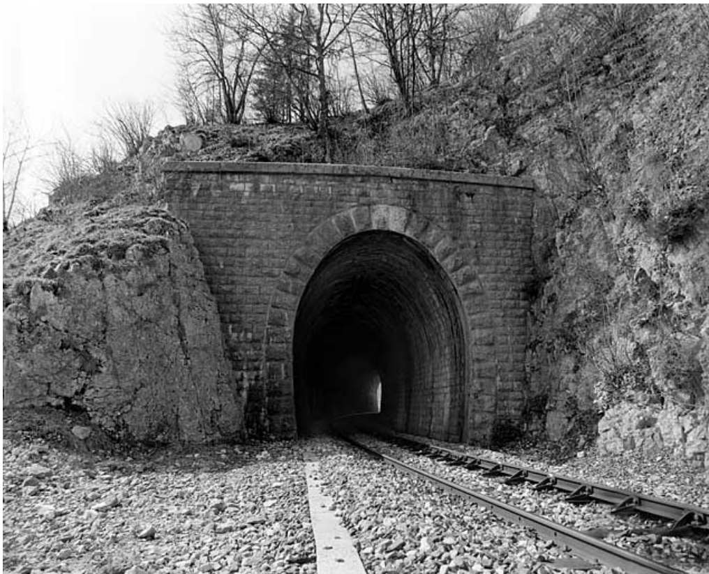
Tête côté La Cluse.

39, Morbier, lieudit : le Bois des Crottes