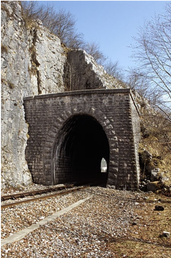
Tête côté Andelot-en-Montagne.

39, Morbier, lieudit : le Bois des Crottes