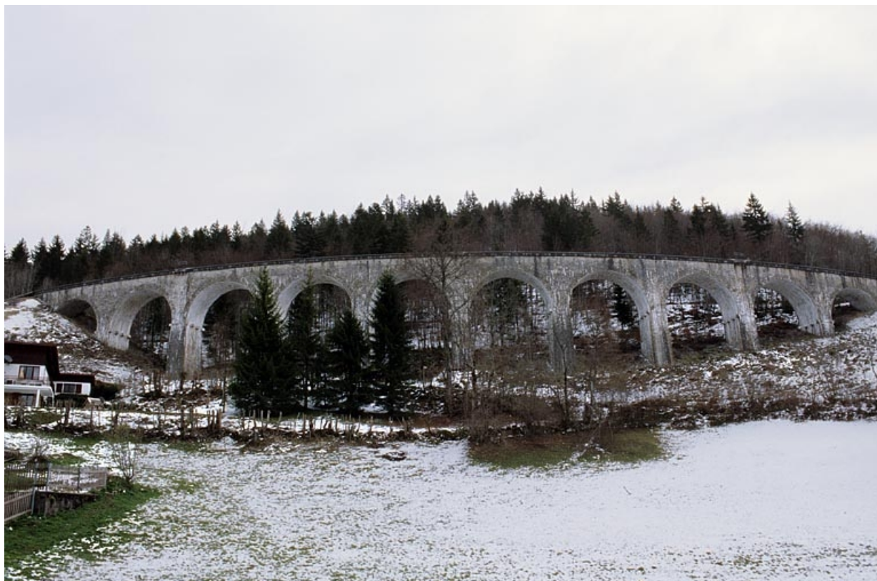
Vue d'ensemble depuis l'ouest, en hiver.

39, Morbier, lieudit : le Bois des Crottes