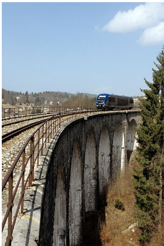
Élévation orientale vue en enfilade depuis le côté La Cluse, avec autorail X 73500. 39, Morbier, lieudit : le Bois des Crottes