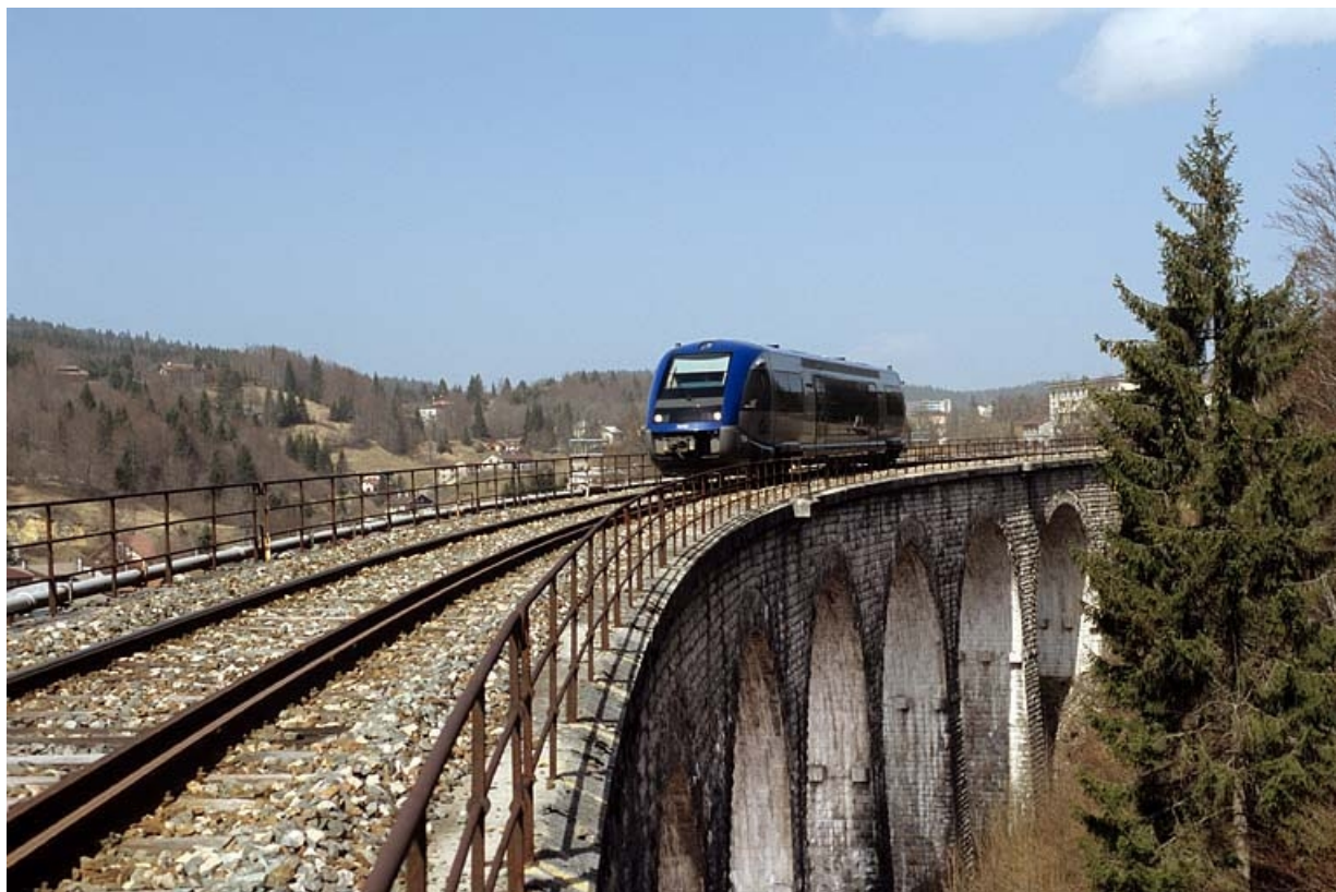
Elévation orientale vue en enfilade depuis le côté La Cluse, avec autorail X 73500 (cadrage horizontal). 39, Morbier, lieudit : le Bois des Crottes