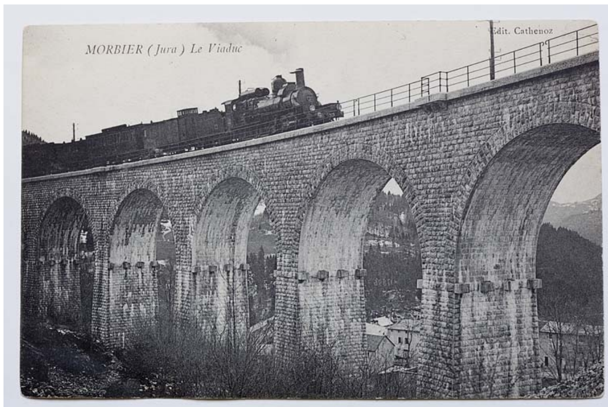
Morbier (Jura). Le Viaduc, entre 1900 et 1916.

39, Morbier, lieudit : le Bois des Crottes