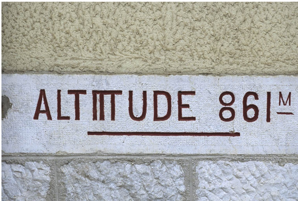
Bâtiment des voyageurs : inscription altimétrique.