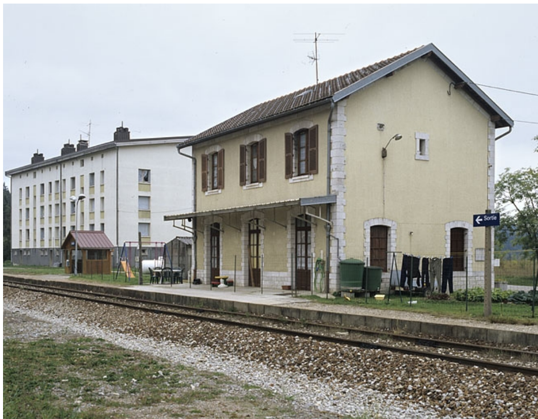
Vue d'ensemble de l'abri et du bâtiment des voyageurs, côté voie.