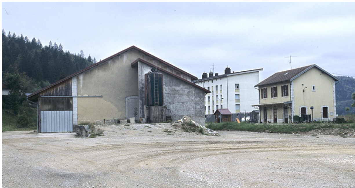
Entrepôt, depuis le nord (côté Andelot-en-Montagne).