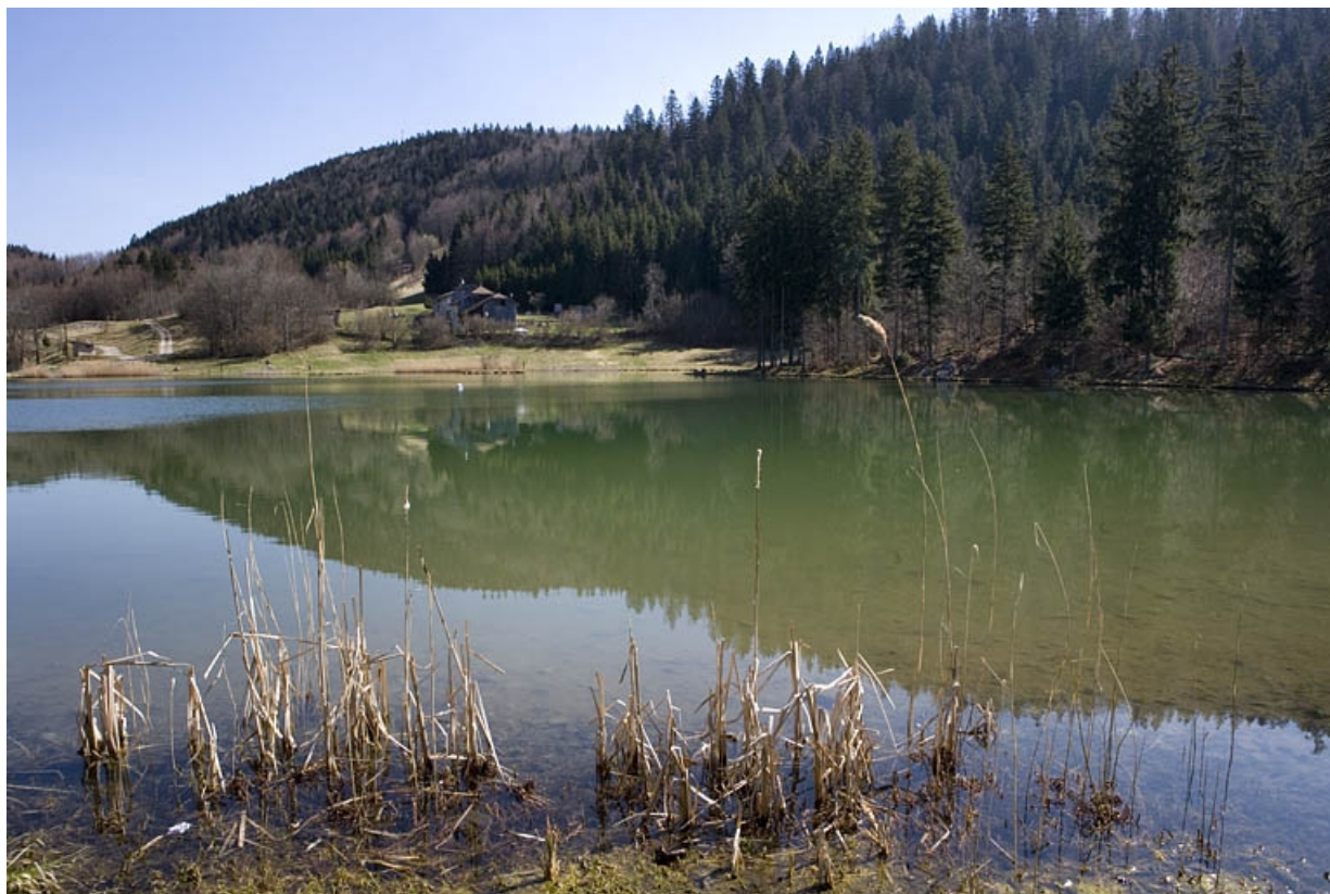
Réservoir : vue d'ensemble, depuis l'ouest.