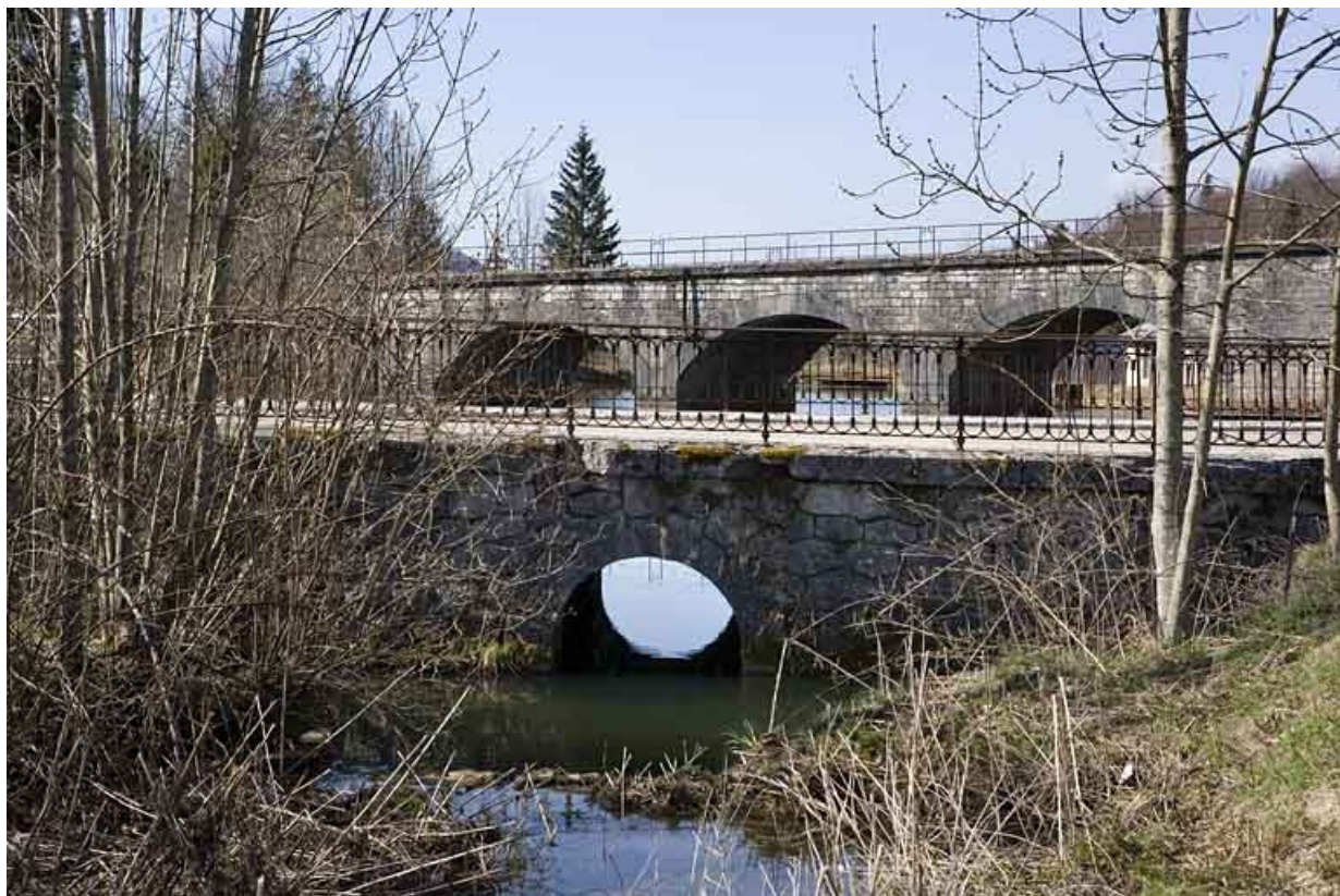
Pont sur le Pontet : vue d'ensemble rapprochée, depuis le nord-est.