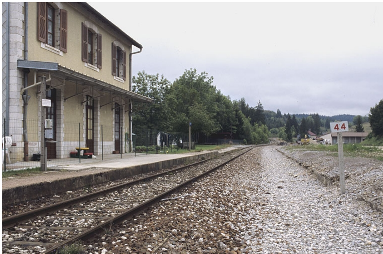
Quai devant le bâtiment des voyageurs, depuis le sud (côté La Cluse). 39, Morbier, 103 rue de la Gare