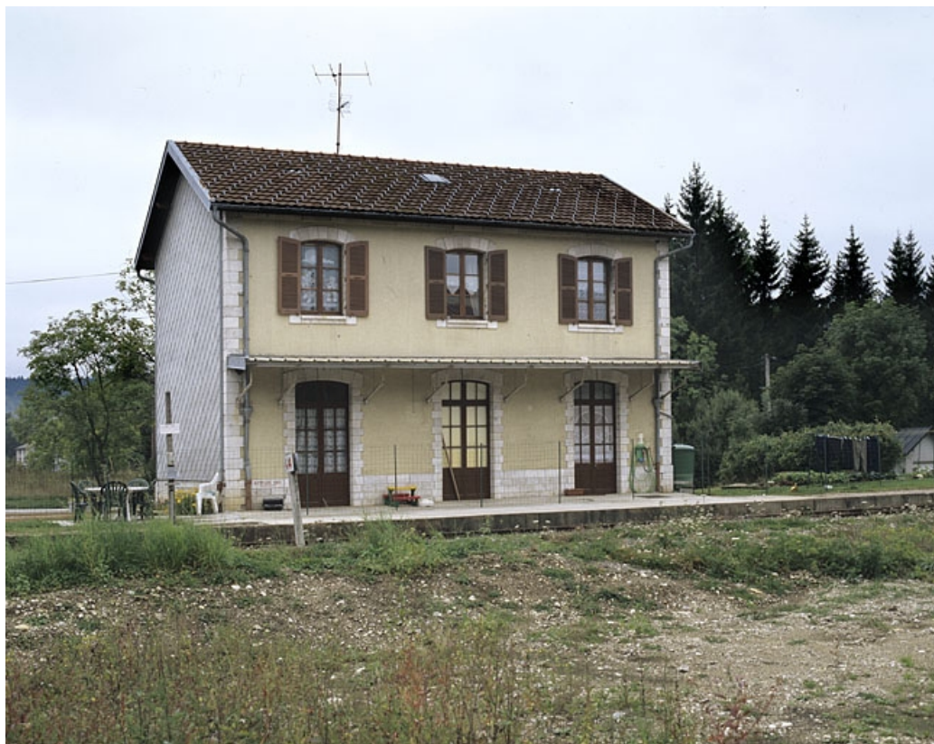
Bâtiment des voyageurs : élévation postérieure, de trois quarts gauche.