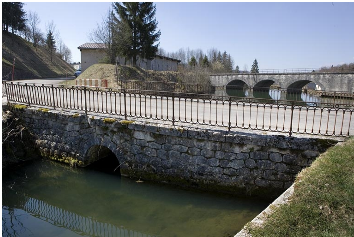
Pont sur le Pontet : vue d'ensemble, depuis le nord-est.