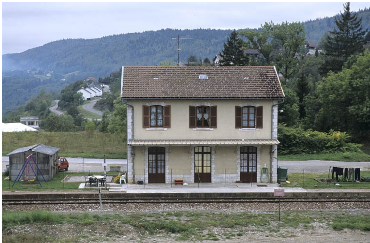
Bâtiment des voyageurs et garage : élévation postérieure (côté voie).