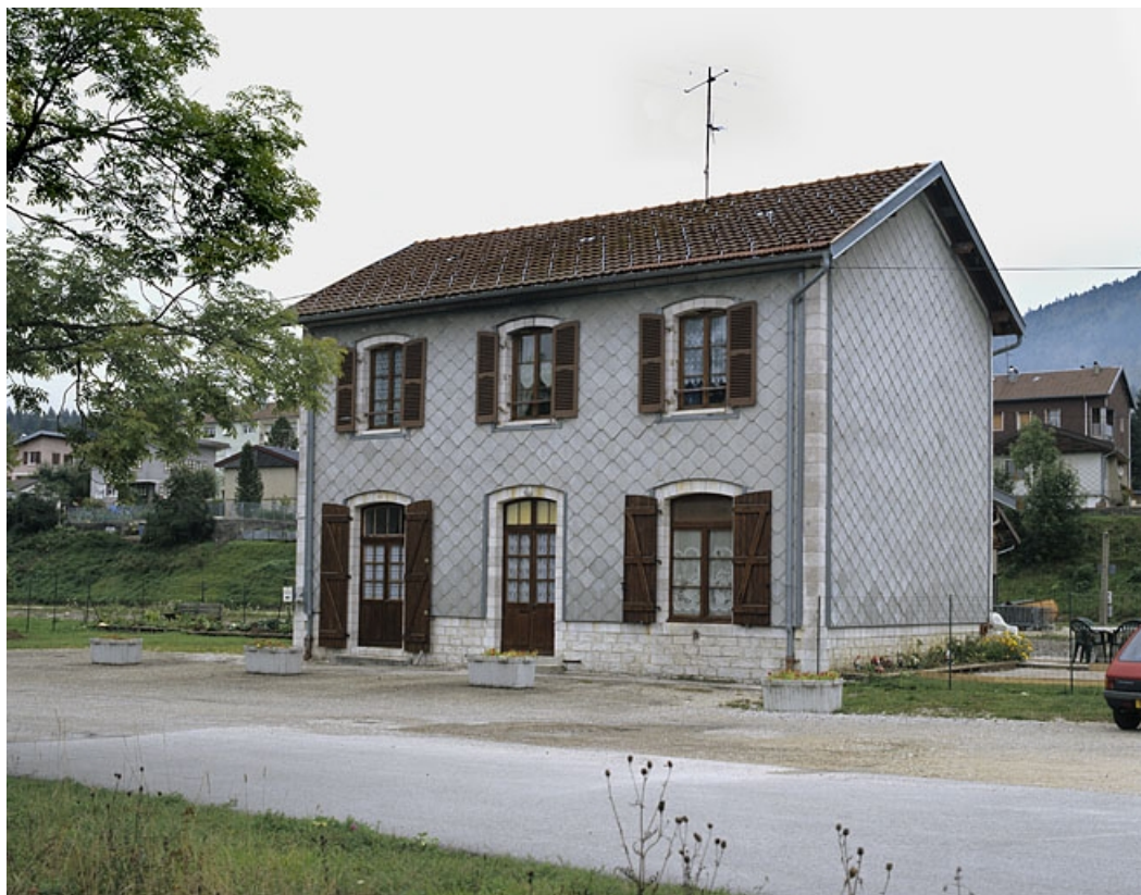
Bâtiment des voyageurs : élévation antérieure, de trois quarts droite.