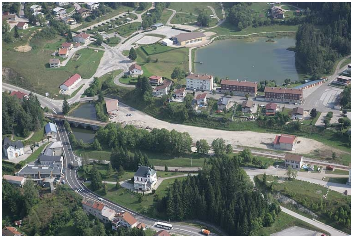
Vue aérienne, depuis le sud-ouest.