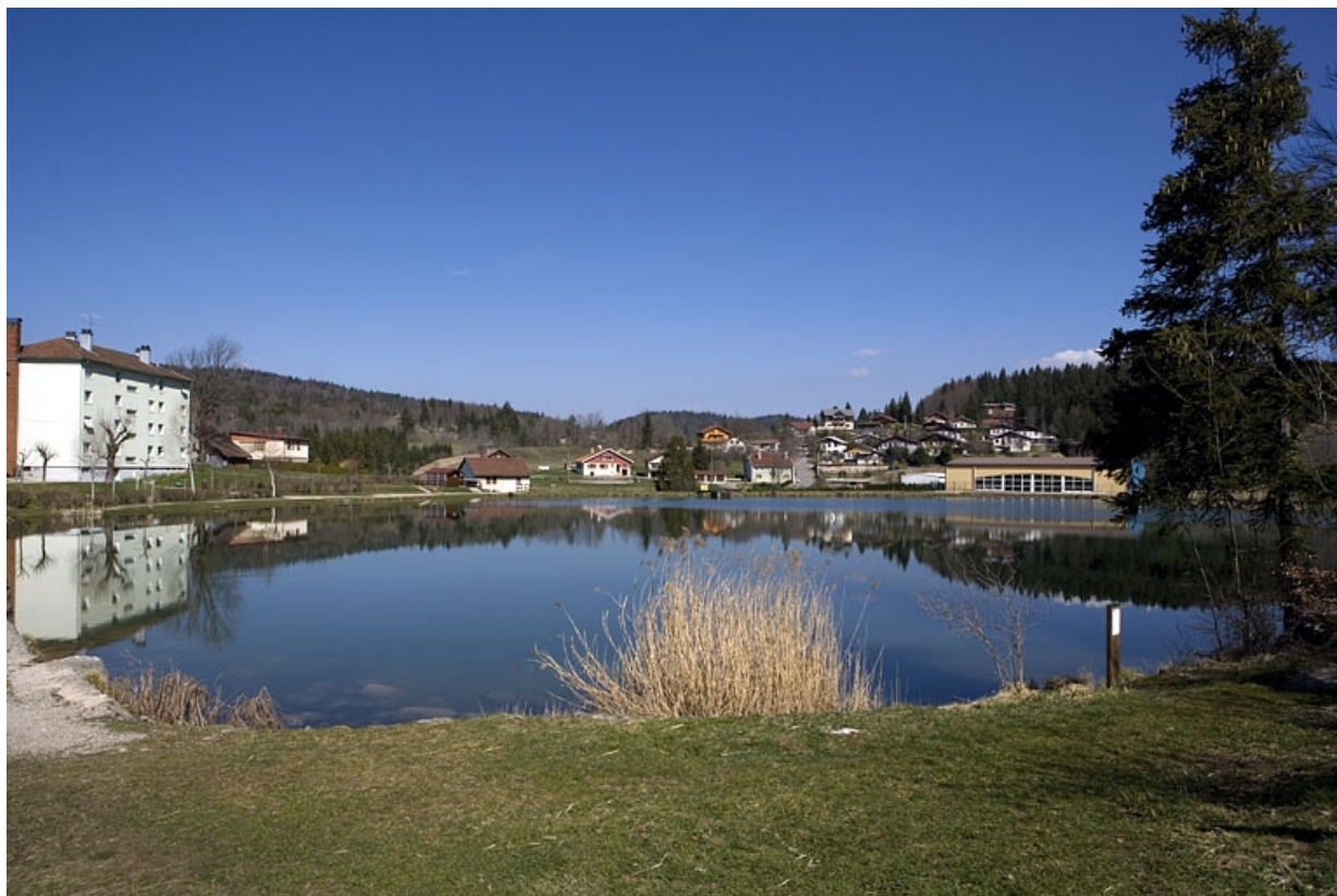
Réservoir : vue d'ensemble, depuis le sud.