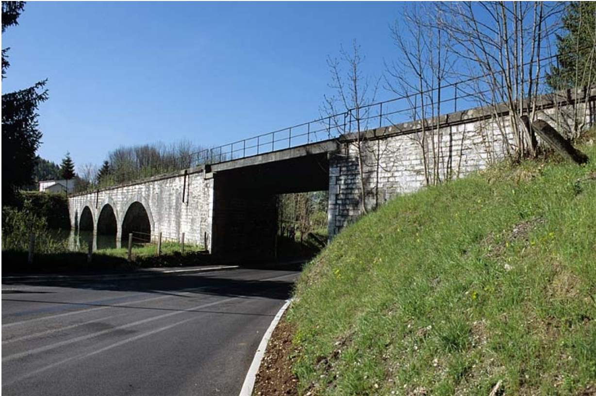
Vue d'ensemble depuis la route nationale (nord).