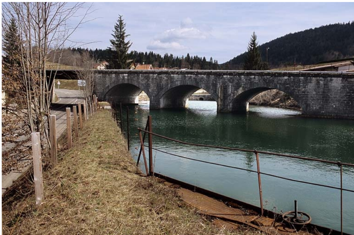
Vue d'ensemble depuis le bassin de retenue (sud-ouest), en aval.