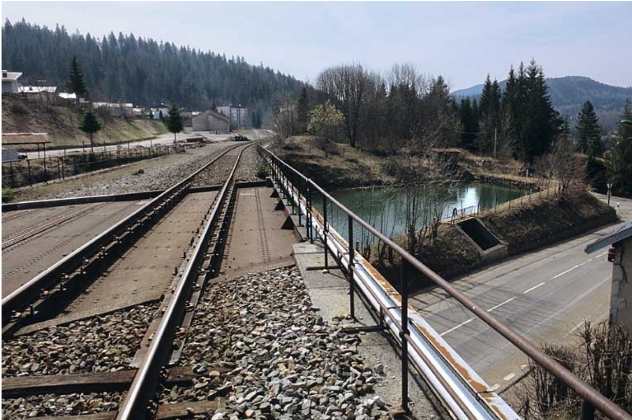
Pont et viaduc : tablier depuis la voie côté Andelot-en-Montagne, avec bassin de retenue Gaudard. 39, Morbier route Blanche