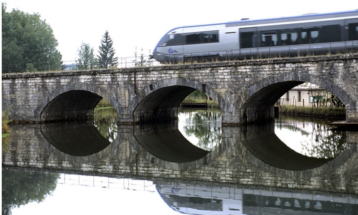
Passage sur le viaduc d'un autorail X 73500 venant d'Andelot-en-Montagne. 39, Morbier route Blanche