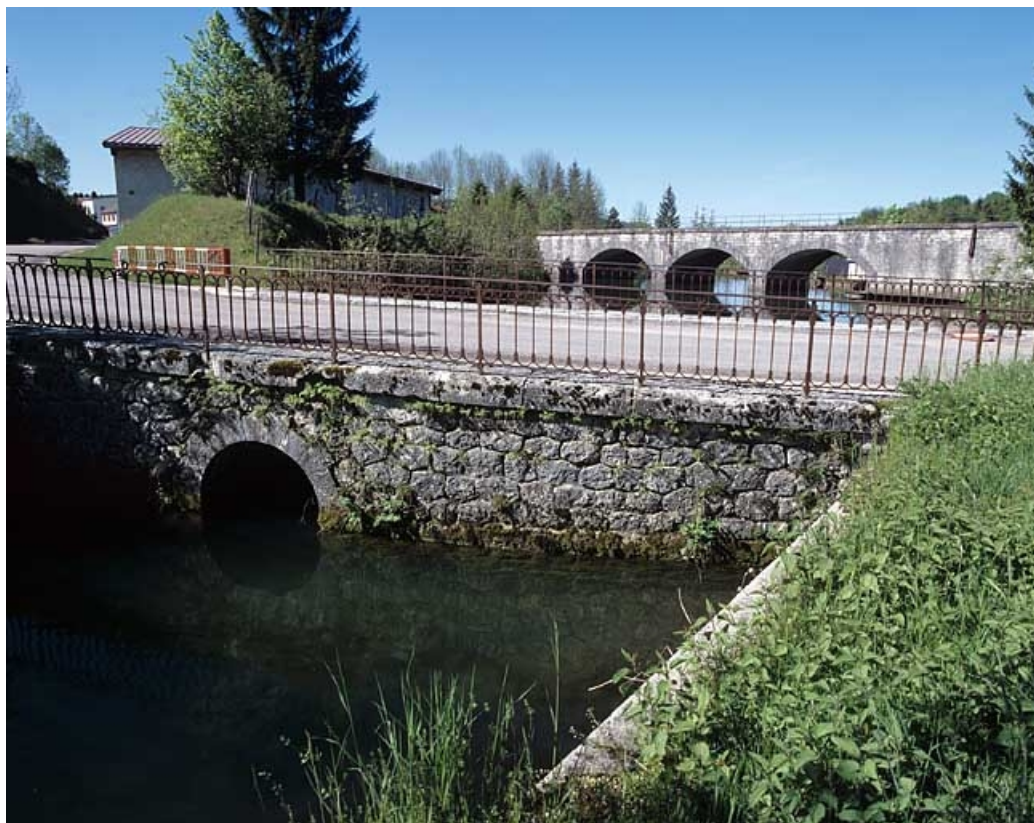
Vue d'ensemble depuis le pont routier (nord-est), en amont sur le ruisseau.