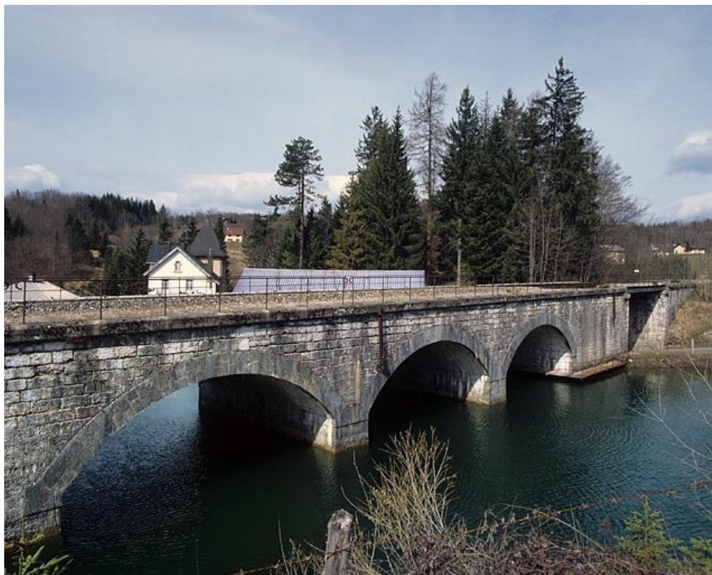
Pont et viaduc : élévation orientale depuis l'est (côté La Cluse). 39, Morbier route Blanche