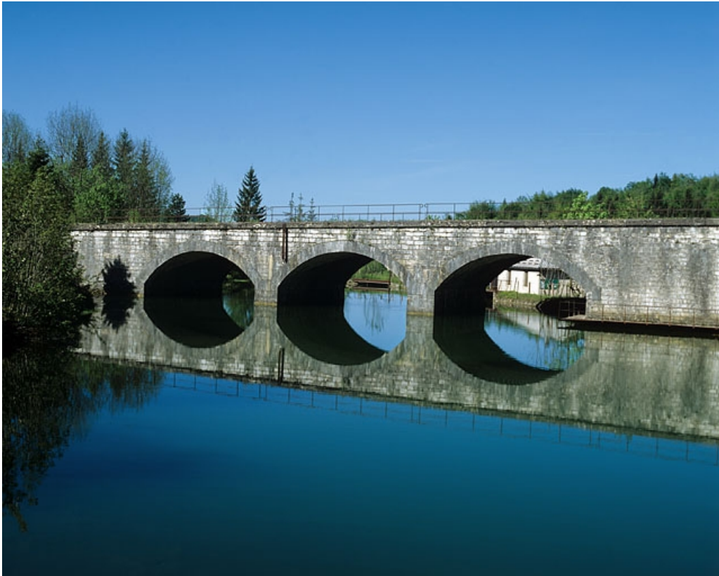
Viaduc : élévation orientale, depuis le nord-est.