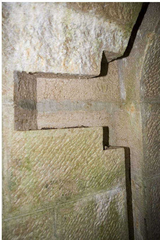
Chambres de mine sud-ouest : encoche creusée dans le mur.

39, Morbier, lieudit : le Bois de la Savine