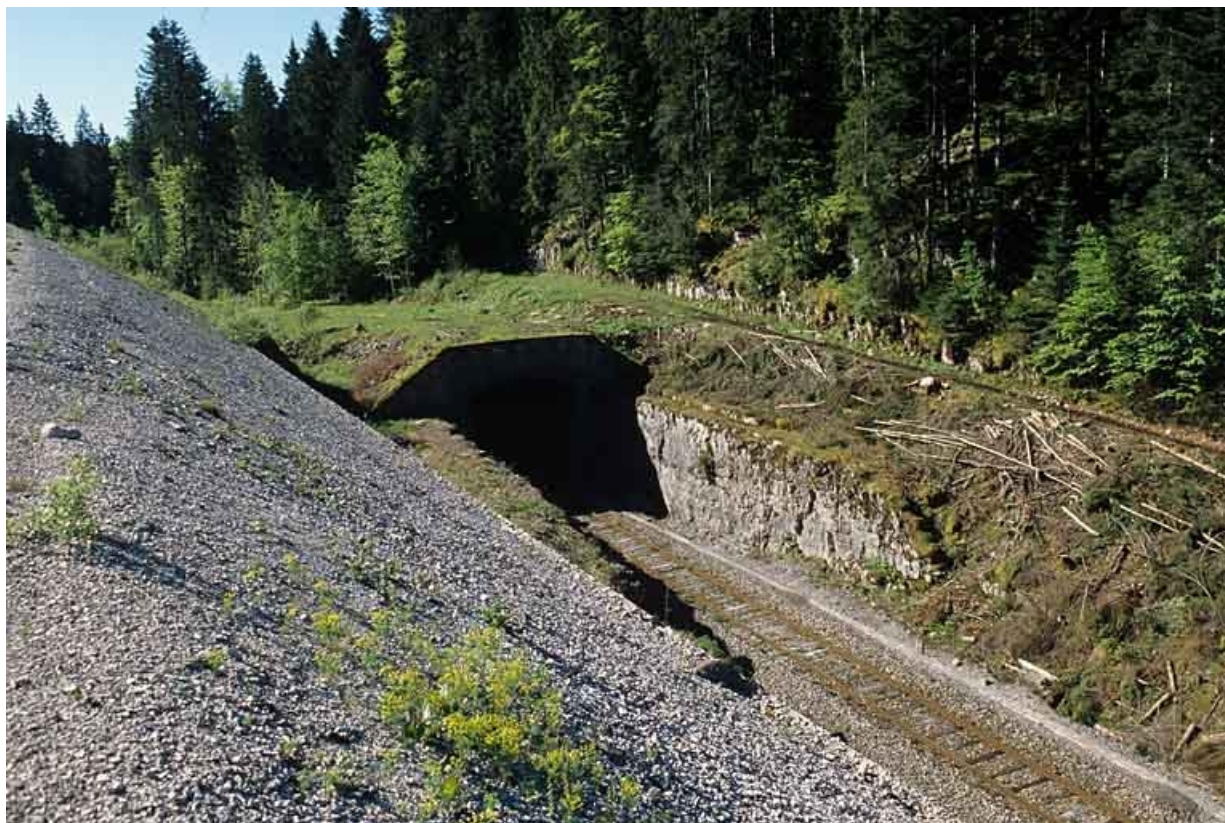
Vue plongeante sur la tête côté Andelot-en-Montagne (nord-ouest).

39, Morbier, lieudit : le Bois de la Savine