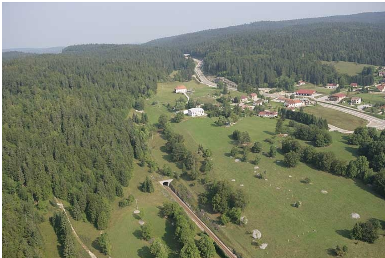
Vue aérienne de la tête côté La Cluse, depuis le sud.

39, Morbier, lieudit : le Bois de la Savine