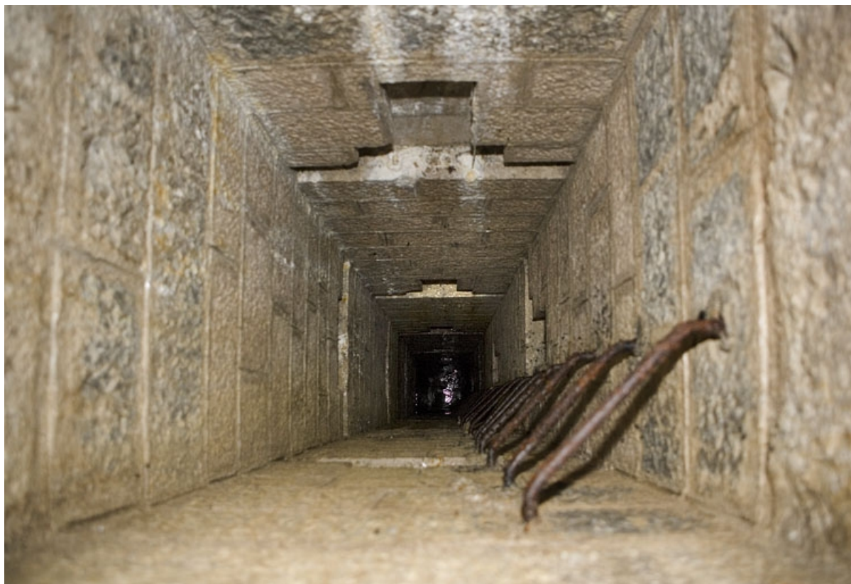
Chambres de mine sud-ouest : intérieur du puits.

39, Morbier, lieudit : le Bois de la Savine