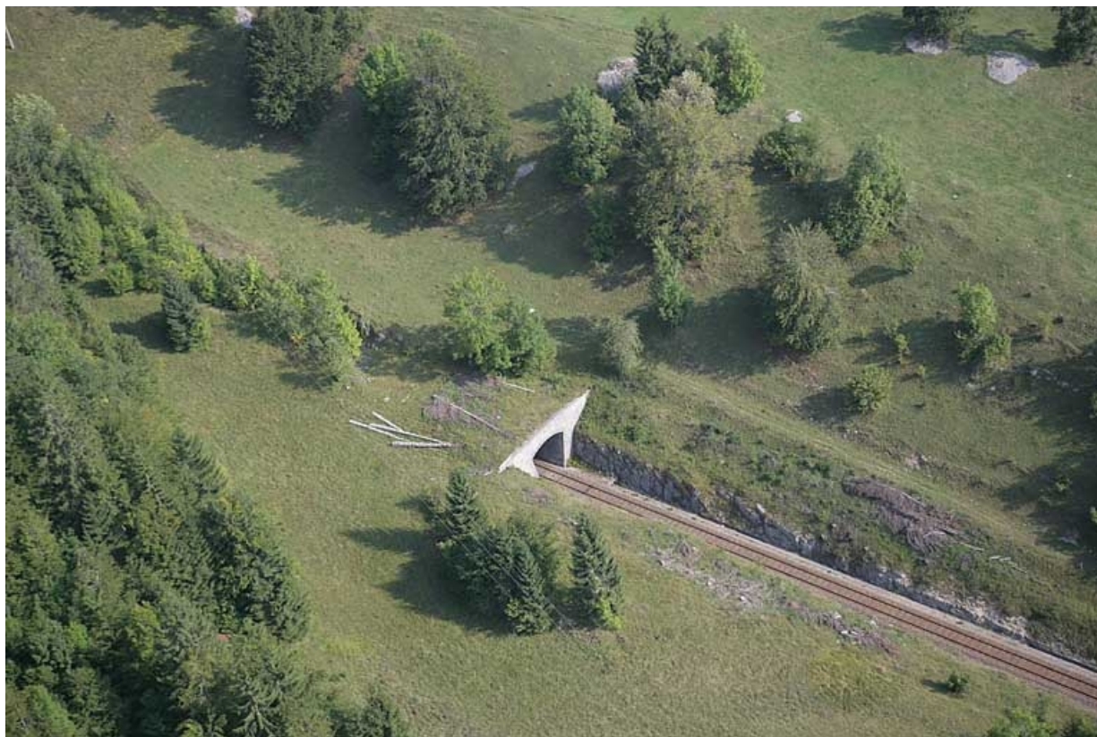
Vue aérienne rapprochée de la tête côté La Cluse, depuis le sud.

39, Morbier, lieudit : le Bois de la Savine