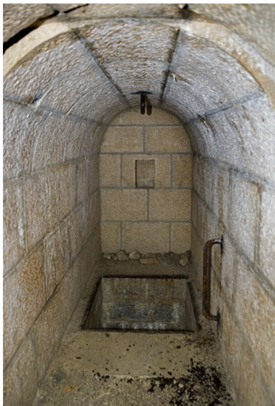
Chambres de mine sud-ouest : fond de la galerie et puits.

39, Morbier, lieudit : le Bois de la Savine