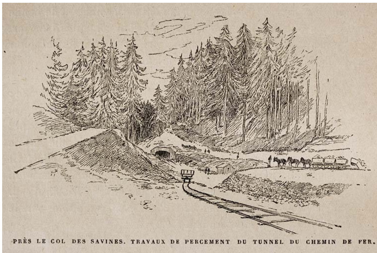
Près le col des Savines. Travaux de percement du tunnel du chemin de fer, 1897.

39, Morbier, lieudit : le Bois de la Savine