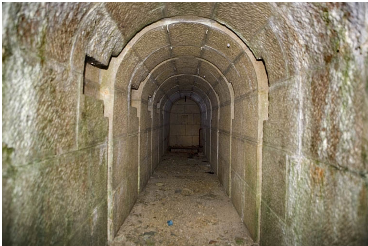
Chambres de mine sud-ouest : galerie, vue depuis l'entrée.

39, Morbier, lieudit : le Bois de la Savine