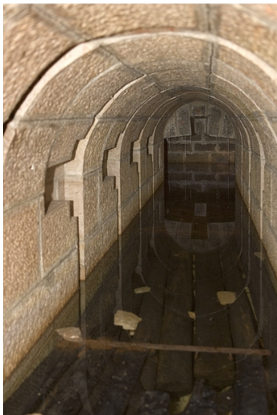
Chambres de mine centrale : galerie inférieure.

39, Morbier, lieudit : le Bois de la Savine