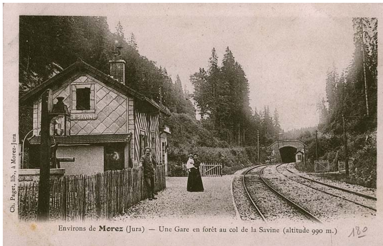
Environs de Morez (Jura) - une Gare en forêt au col de la Savine (altitude 990 m.) [entrée du tunnel côté Andelot-en-Montagne], entre 1899 et 1903.

39, Morbier, lieudit : le Bois de la Savine