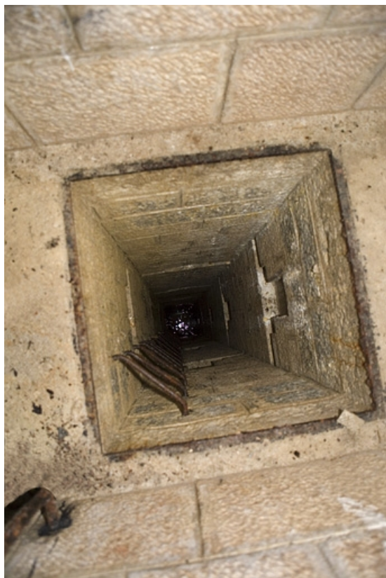
Chambres de mine sud-ouest : vue d'ensemble du puits.

39, Morbier, lieudit : le Bois de la Savine