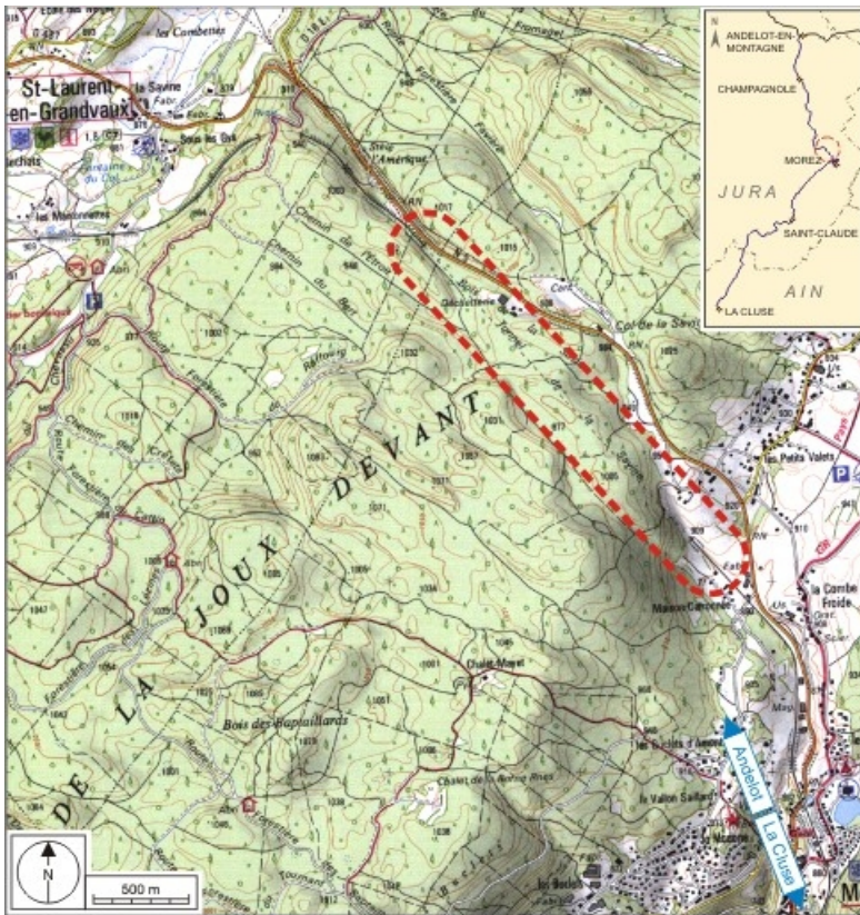
Carte et schéma de localisation. Carte topographique, IGN, 2000, dalles F087_049, F087_050, F088_049 et F088_050, échelle 1:25 000. Scan 25, licence n° 2008/CISE/2968.

39, Morbier, lieudit : le Bois de la Savine