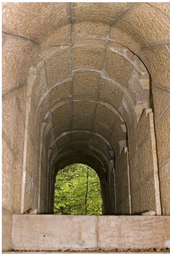
Chambres de mine centrale : galerie supérieure, vue depuis l'escalier.

39, Morbier, lieudit : le Bois de la Savine