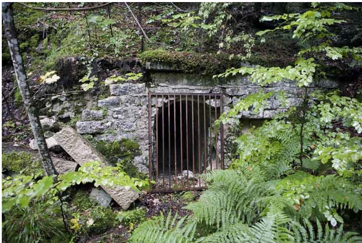
Chambres de mine sud-ouest : entrée de la galerie.

39, Morbier, lieudit : le Bois de la Savine