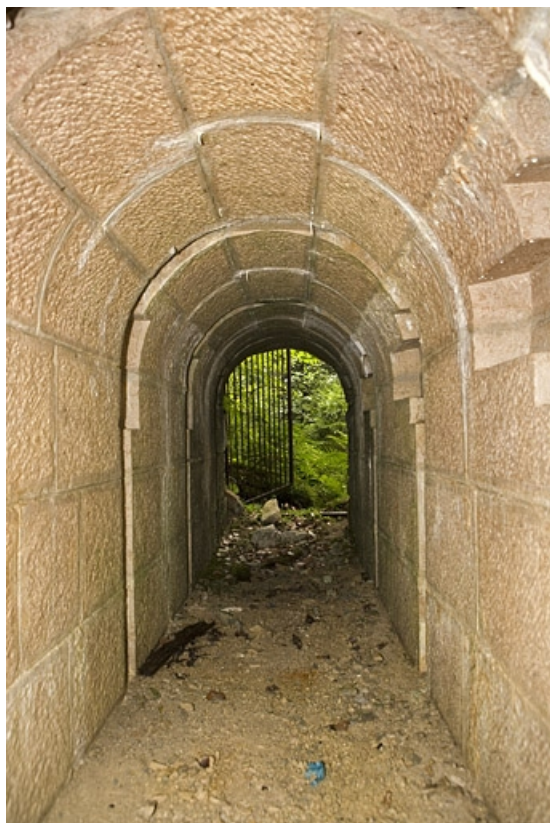
Chambres de mine sud-ouest : galerie, vue depuis le fond.

39, Morbier, lieudit : le Bois de la Savine