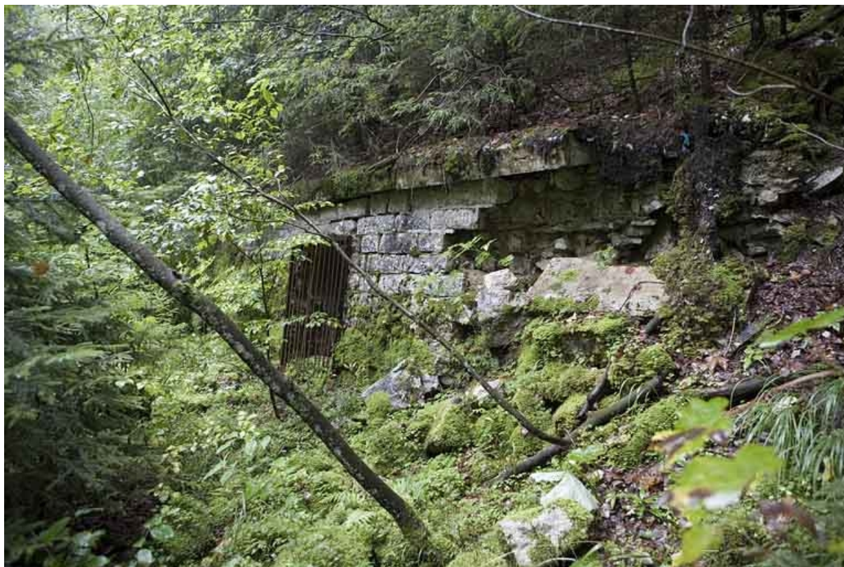
Chambres de mine centrale : entrée de la galerie.

39, Morbier, lieudit : le Bois de la Savine