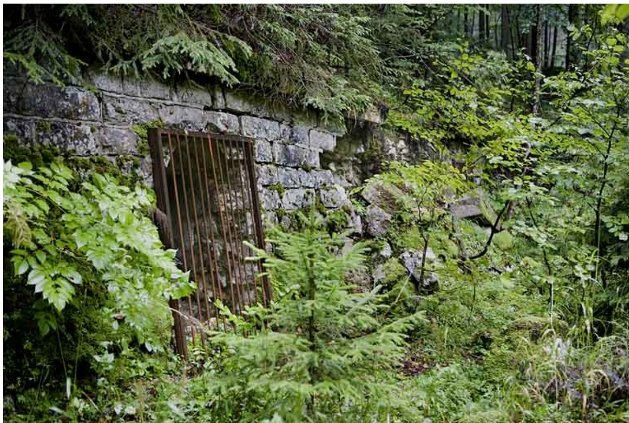
Chambres de mine : vue d'ensemble de l'entrée des galeries centrale et sud-ouest.

39, Morbier, lieudit : le Bois de la Savine