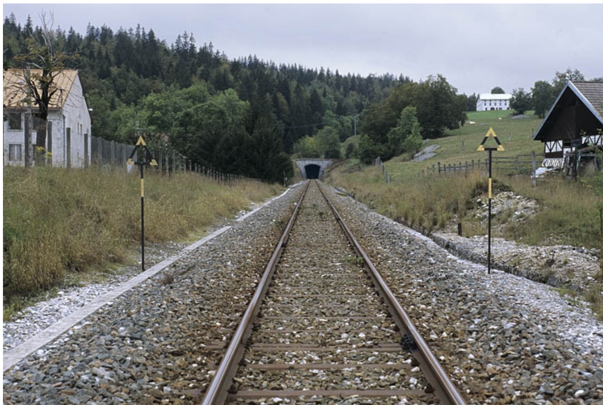
Vue d'ensemble depuis le passage à niveau n° 33, côté La Cluse. 39, Morbier, lieudit : le Bois de la Savine