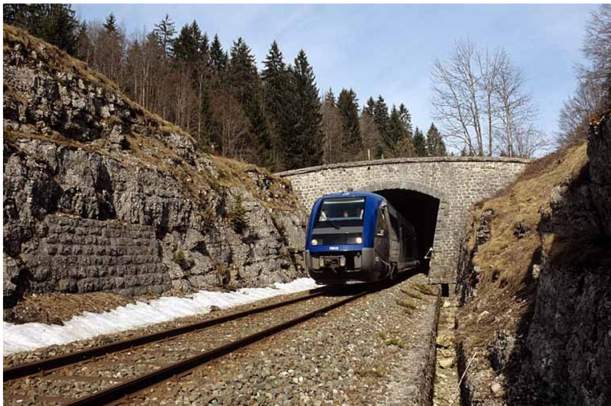
Tête côté La Cluse (sud-est), avec autorail X 73500.

39, Morbier, lieudit : le Bois de la Savine