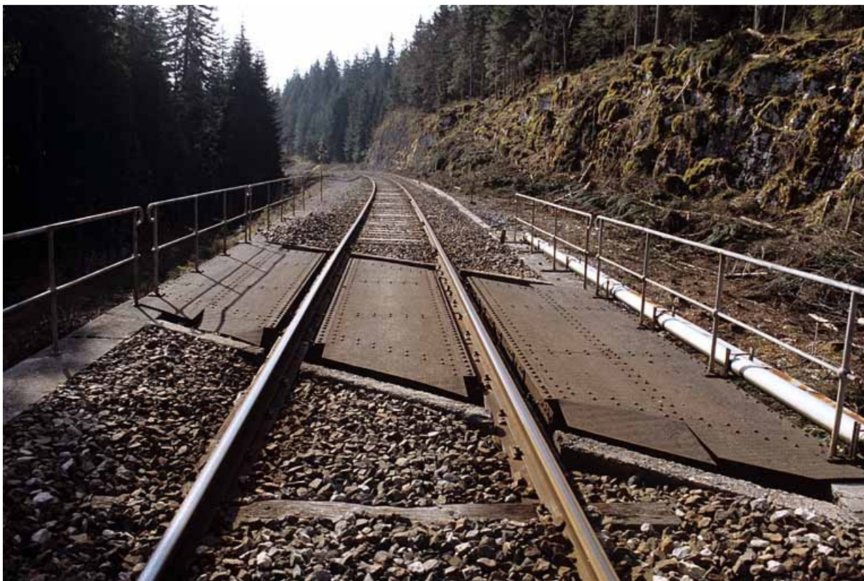
Tablier métallique, depuis la voie côté Andelot-en-Montagne. 39, Saint-Laurent-en-Grandvaux, lieudit : la Forêt de la Joux devant