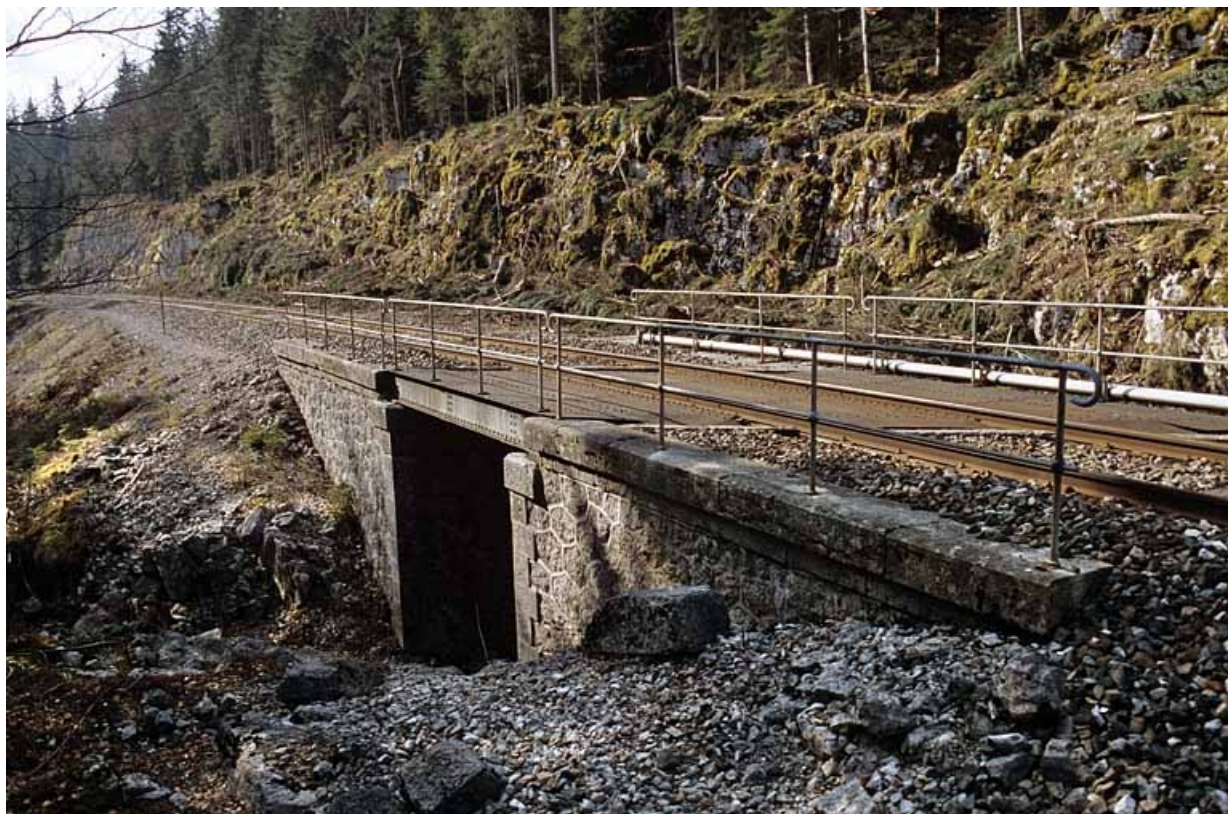
Elévation orientale vue en enfilade, depuis le nord (côté Andelot-en-Montagne).

39, Saint-Laurent-en-Grandvaux, lieudit : la Forêt de la Joux devant