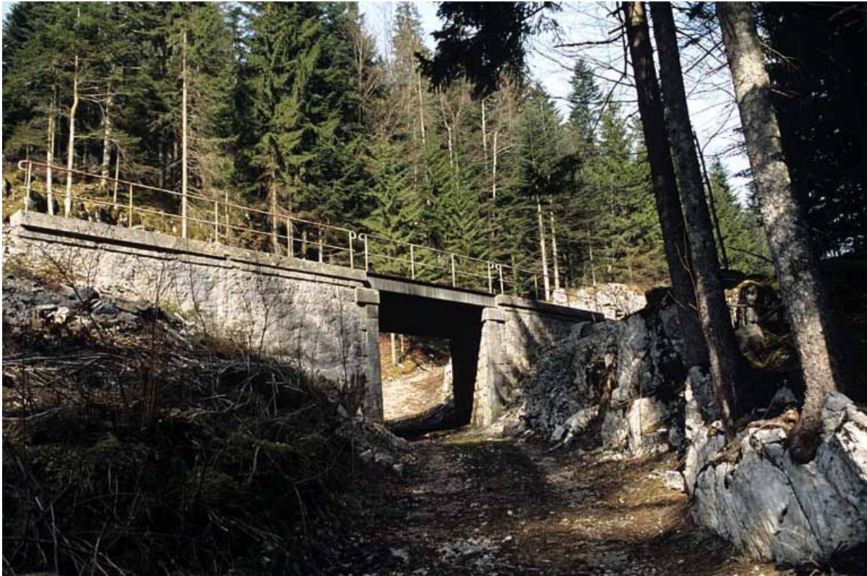
Vue d'ensemble, depuis le chemin à l'est.

39, Saint-Laurent-en-Grandvaux, lieudit : la Forêt de la Joux devant