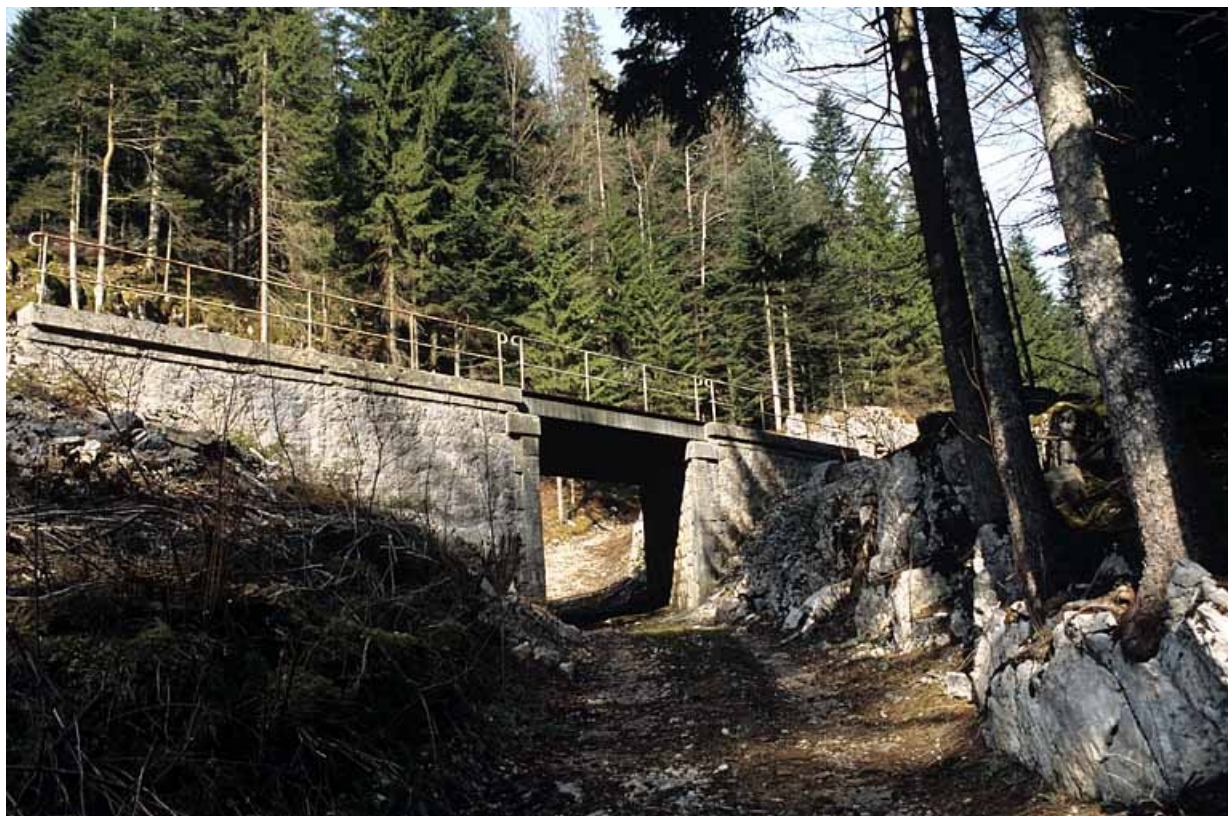
Vue d'ensemble, depuis le chemin à l'est.

39, Saint-Laurent-en-Grandvaux, lieudit : la Forêt de la Joux devant