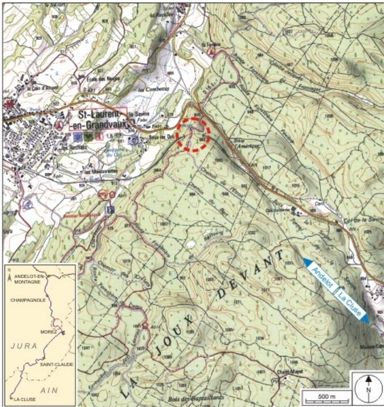
Carte et schéma de localisation. Carte topographique, IGN, 2000, dalles F087_049, F087_050, F088_049 et F088_050, échelle 1:25 000. Scan 25, licence n° 2008/CISE/2968.

39, Saint-Laurent-en-Grandvaux, lieudit : la Forêt de la Joux devant