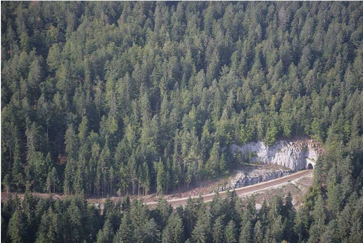
Vue aérienne de la tête côté La Cluse, depuis l'est.

39, Saint-Laurent-en-Grandvaux, lieudit : la Forêt de la Joux devant