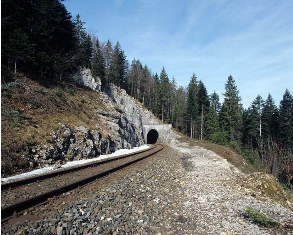
Vue d'ensemble de la tête côté La Cluse.

39, Saint-Laurent-en-Grandvaux, lieudit : la Forêt de la Joux devant