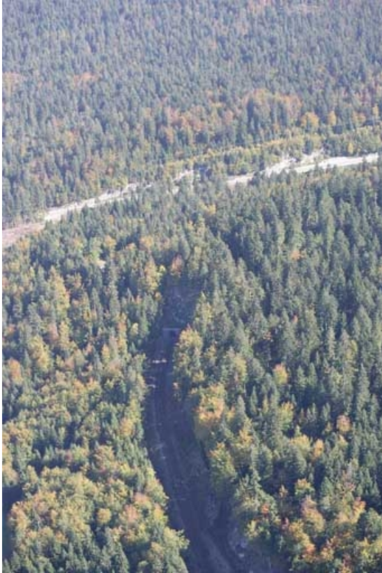
Vue aérienne de la tête côté Andelot-en-Montagne, depuis l'ouest.

39, Saint-Laurent-en-Grandvaux, lieudit : la Forêt de la Joux devant