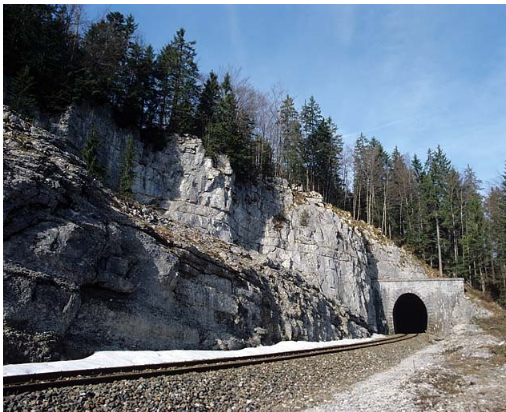
Tête côté La Cluse et paroi rocheuse.

39, Saint-Laurent-en-Grandvaux, lieudit : la Forêt de la Joux devant