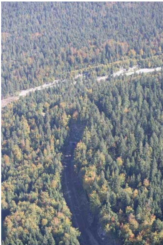
Vue aérienne de la tête côté Andelot-en-Montagne, depuis l'ouest.

39, Saint-Laurent-en-Grandvaux, lieudit : la Forêt de la Joux devant