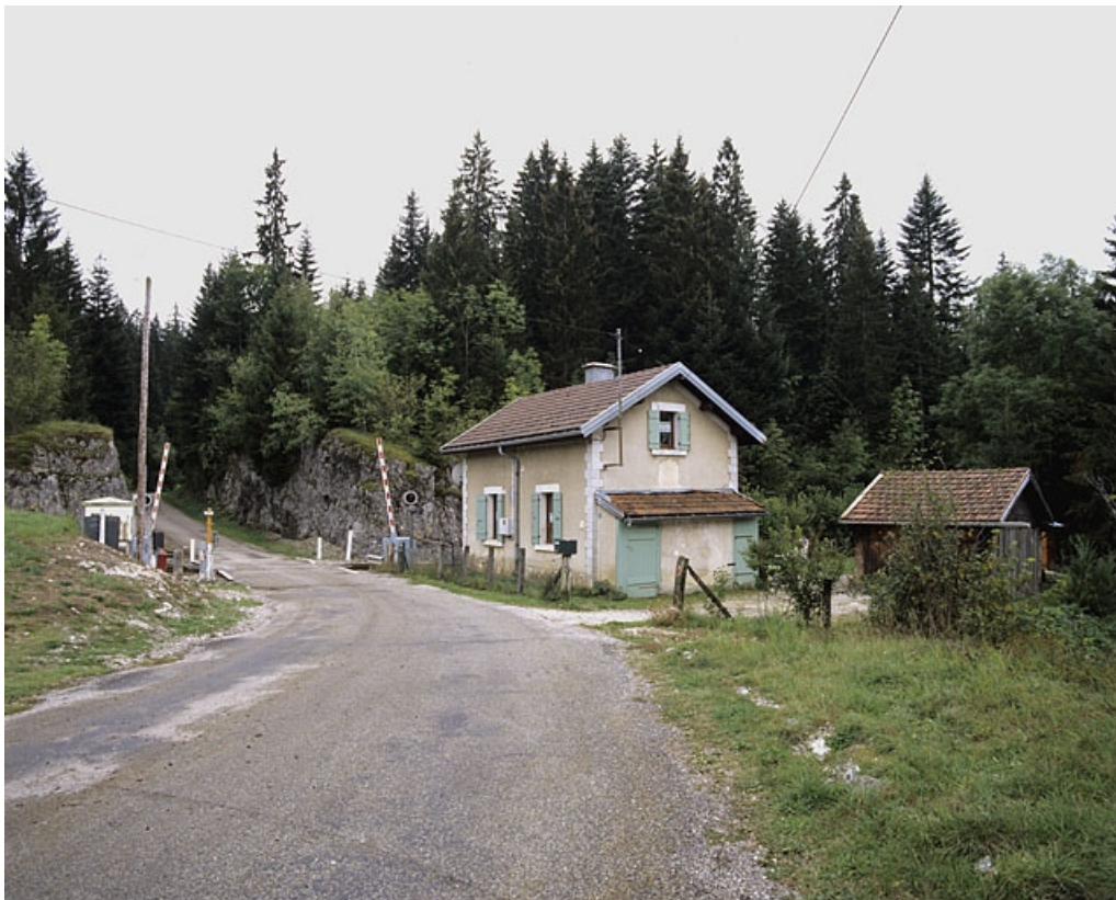
Vue d'ensemble, depuis le nord.

39, Saint-Laurent-en-Grandvaux, 12 route des Gyps, lieudit : sur les Frasses