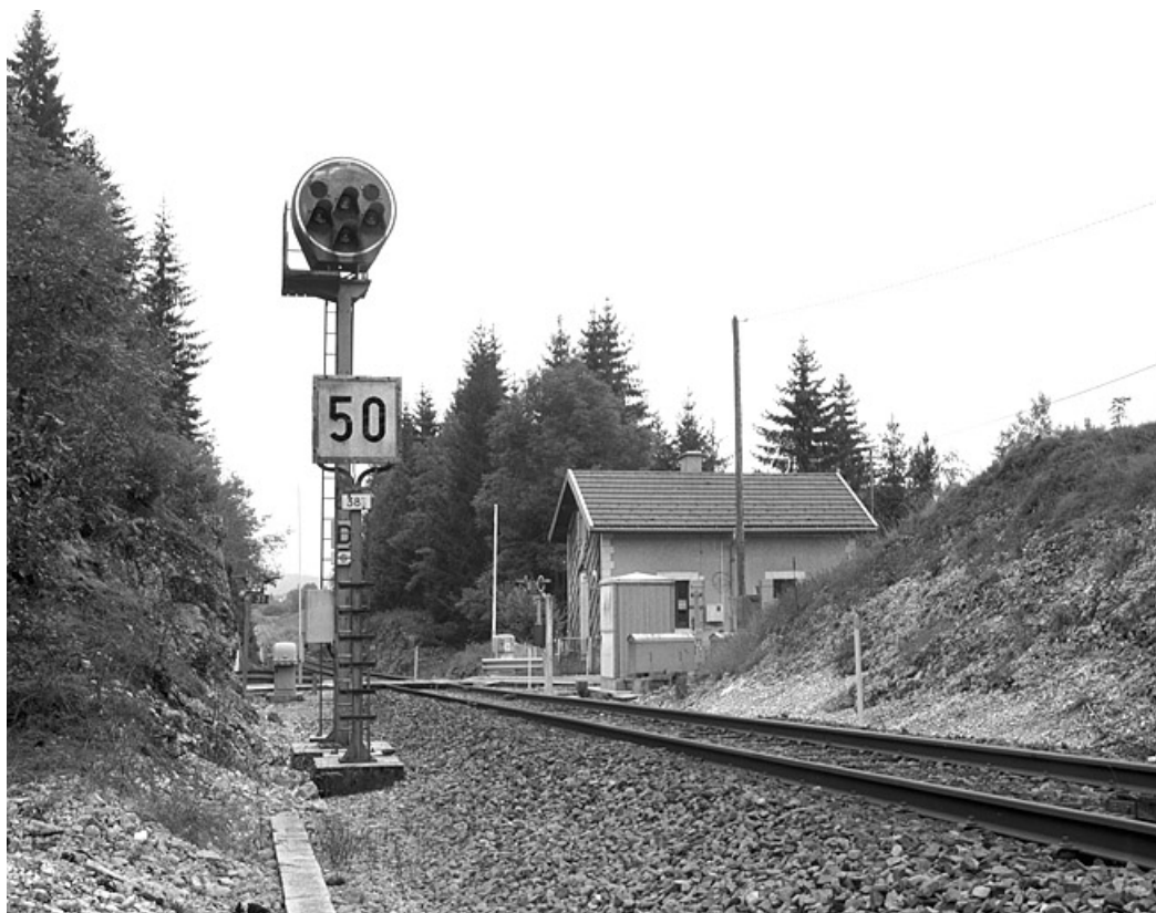
Vue d'ensemble depuis la voie, à l'est (côté La Cluse).

39, Saint-Laurent-en-Grandvaux, 12 route des Gyps, lieudit : sur les Frasses