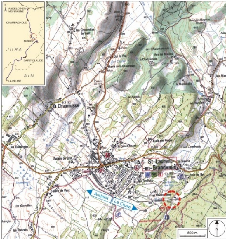
Carte et schéma de localisation. Carte topographique, IGN, 2000, dalle F087_049, échelle 1:25 000. Scan 25, licence n° 2008/CISE/2968.

39, Saint-Laurent-en-Grandvaux, 12 route des Gyps, lieudit : sur les Frasses