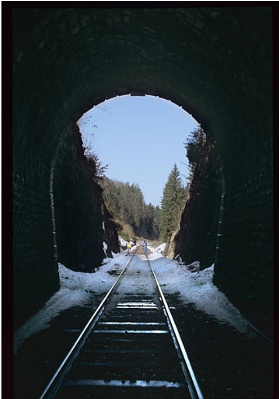
Intérieur (côté Andelot-en-Montagne) : tête. 39, La Chaumusse, lieudit : la Vie de la Serre