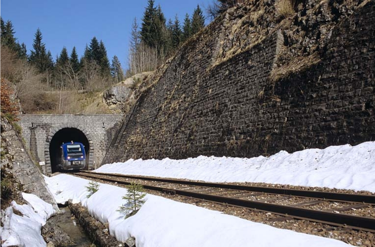
Vue d'ensemble de la tête côté La Cluse, avec autorail X 73500.

39, La Chaumusse, lieudit : la Vie de la Serre