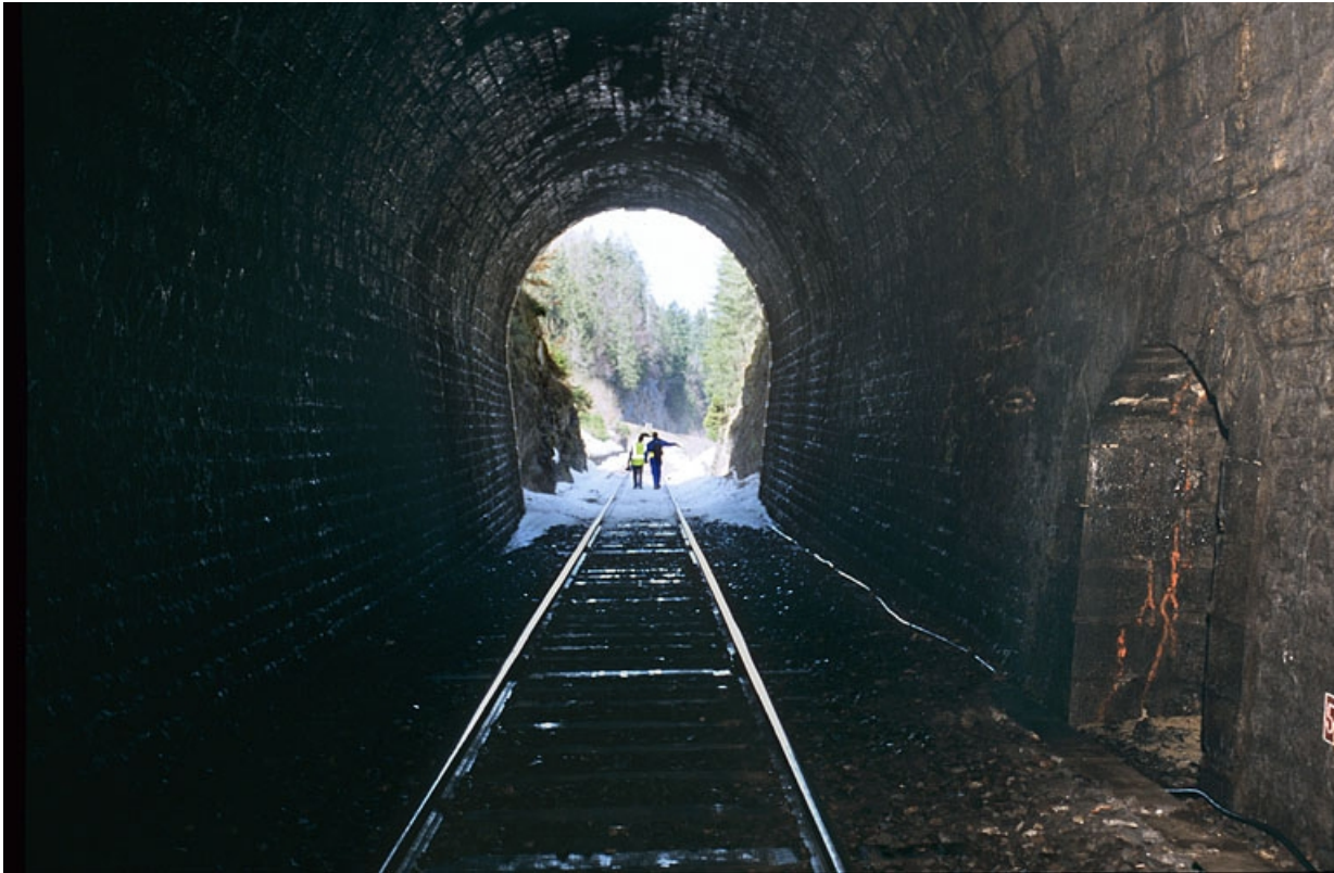
Intérieur (côté Andelot-en-Montagne) : tête et refuge.

39, La Chaumusse, lieudit : la Vie de la Serre