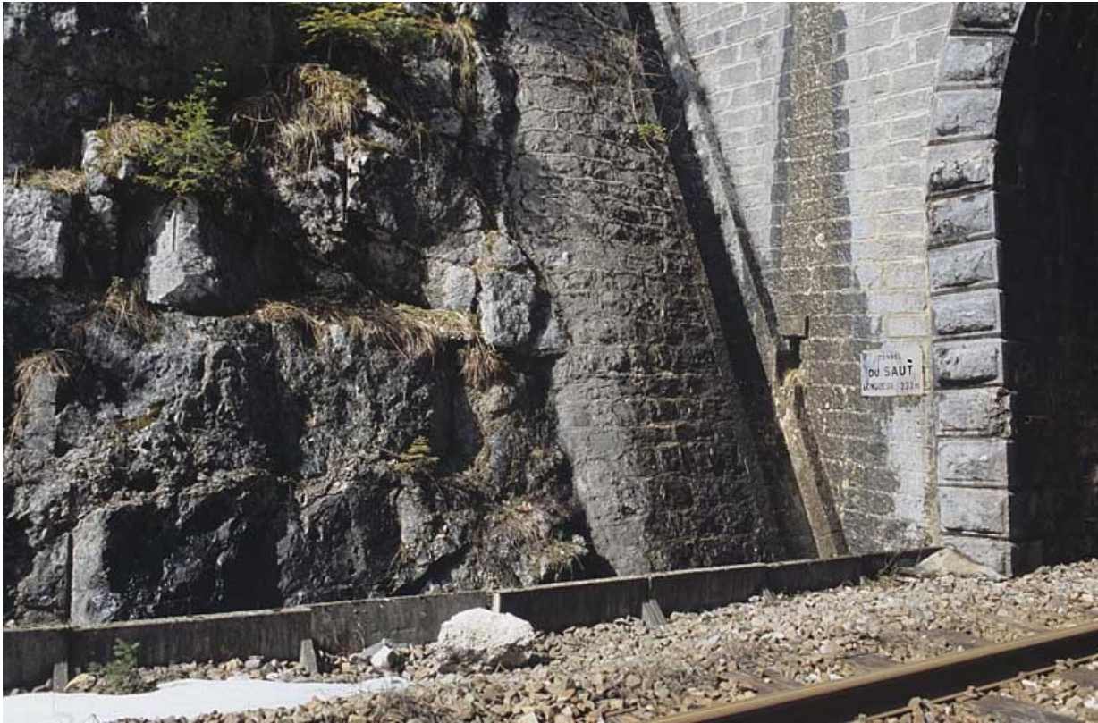
Tête côté La Cluse : descente d'eau, chantepleure et caniveau (détail).

39, La Chaumusse, lieudit : la Vie de la Serre