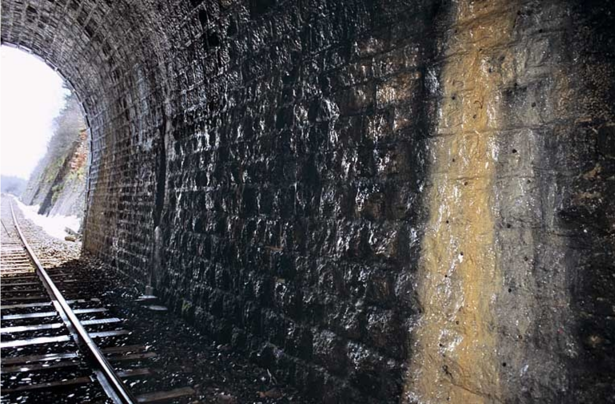
Intérieur (côté La Cluse) : appareil à bossages du mur et voile de calcite. 39, La Chaumusse, lieudit : la Vie de la Serre