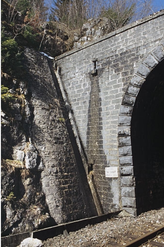
Tête côté La Cluse : descente d'eau, chantepleures et caniveau.

39, La Chaumusse, lieudit : la Vie de la Serre