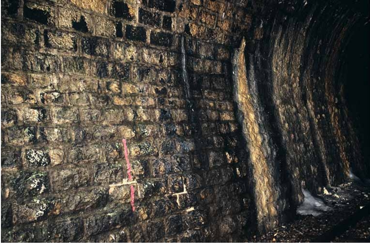
Intérieur (côté La Cluse) : appareil à bossages du mur et voile de calcite.

39, La Chaumusse, lieudit : la Vie de la Serre