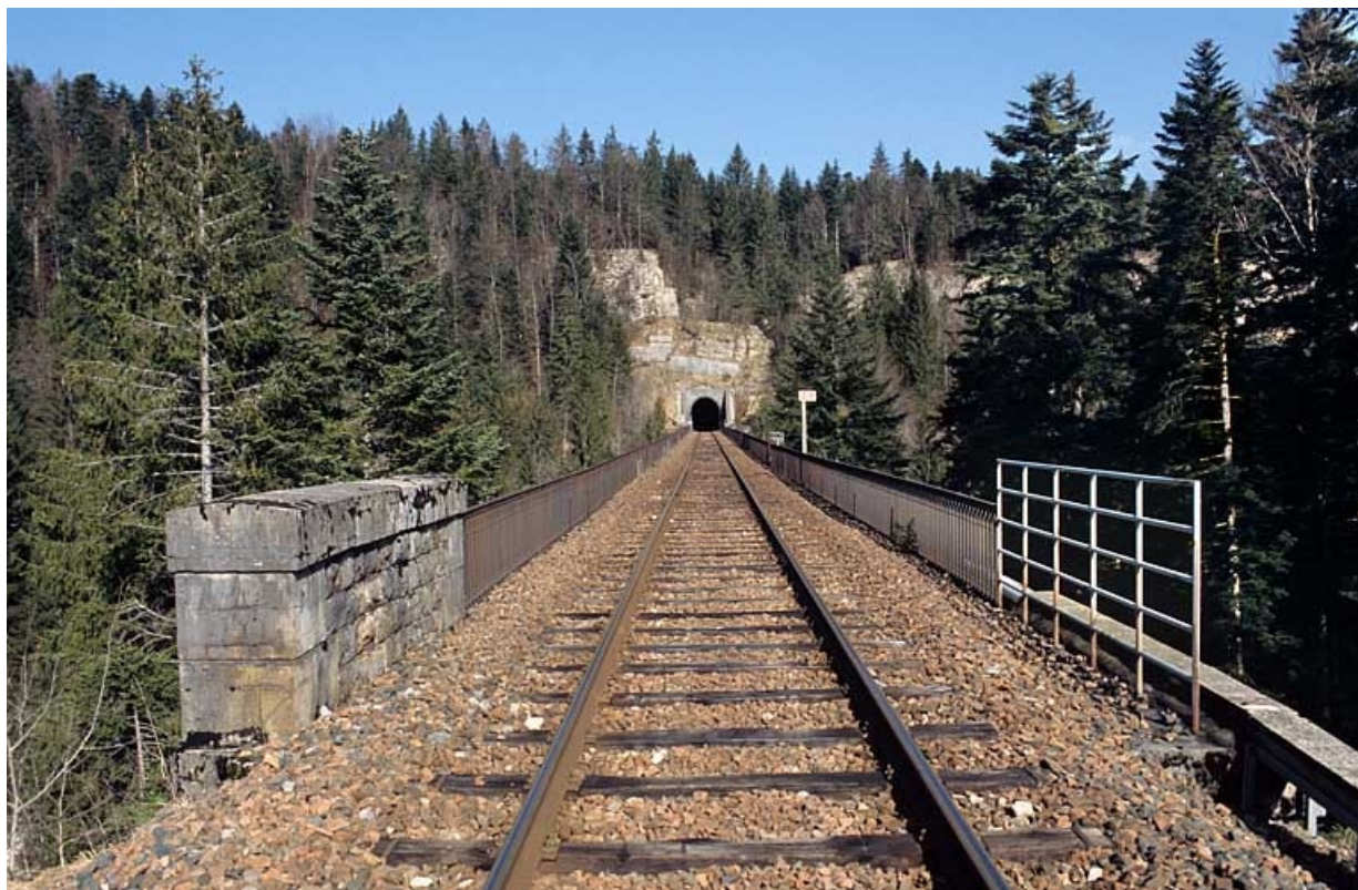
Viaduc et tunnel : vue d'ensemble côté La Cluse.

39, La Chaux-du-Dombief V.C. 201 E, lieudit : Morillon