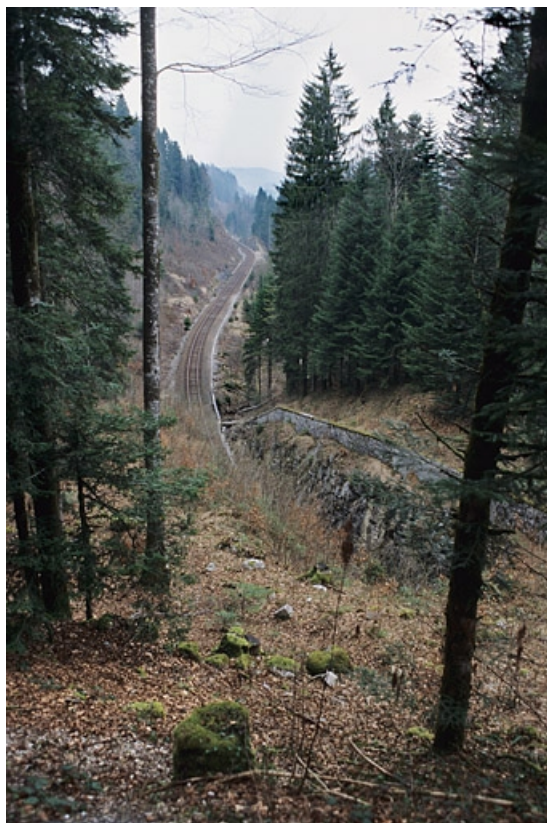
Tranchée et mur de protection côté Andelot-en-Montagne.

39, La Chaux-du-Dombief V.C. 201 E, lieudit : Morillon