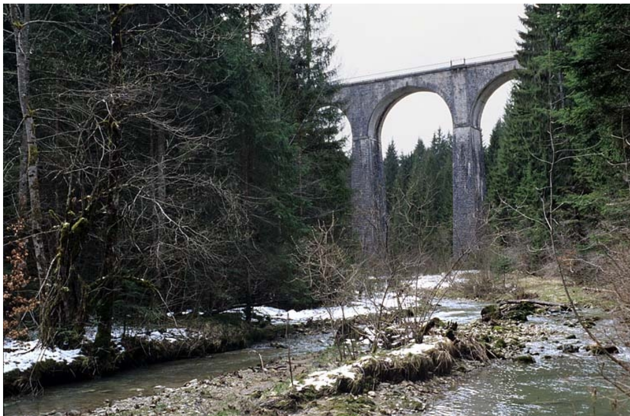
Viaduc : vue d'ensemble, depuis le fond du vallon au nord-est.

39, La Chaux-du-Dombief V.C. 201 E, lieudit : Morillon