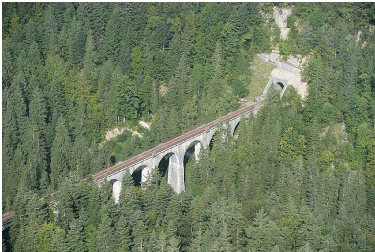
Vue aérienne du tunnel et du viaduc, depuis le sud-est.

39, La Chaux-du-Dombief V.C. 201 E, lieudit : Morillon