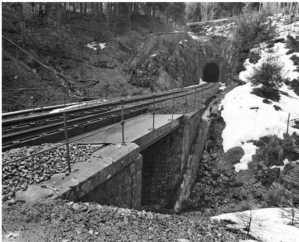
Pont et tunnel : vue d'ensemble du côté Andelot-en-Montagne.

39, La Chaux-du-Dombief V.C. 201 E, lieudit : Morillon