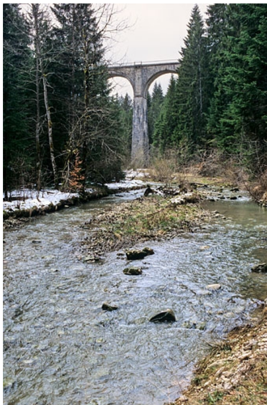
Viaduc : vue d'une pile, depuis le fond du vallon au nord-est.

39, La Chaux-du-Dombief V.C. 201 E, lieudit : Morillon