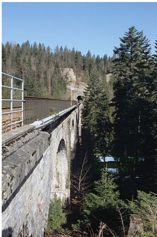
Viaduc : élévation orientale vue en enfilade, depuis le côté La Cluse.

39, La Chaux-du-Dombief V.C. 201 E, lieudit : Morillon