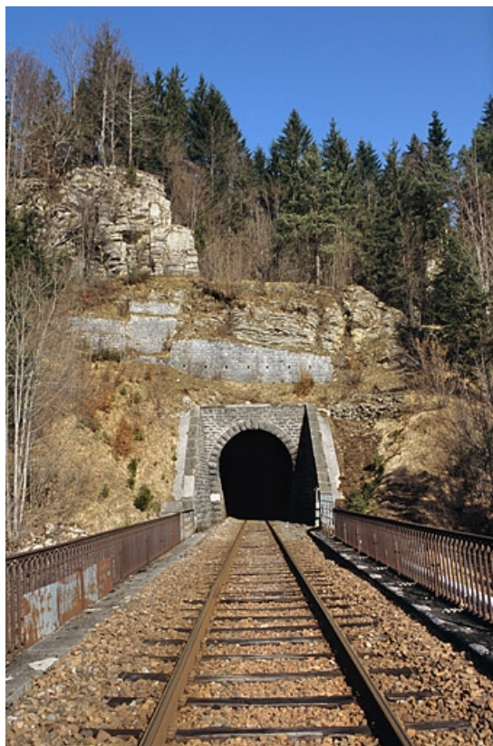
Tunnel : tête du côté La Cluse.

39, La Chaux-du-Dombief V.C. 201 E, lieudit : Morillon