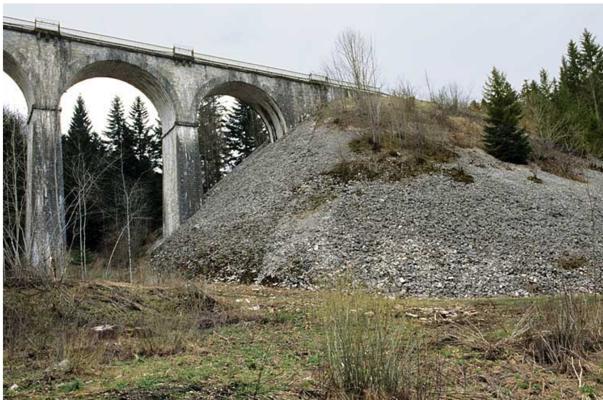
Extrémité et quart de cône côté Andelot-en-Montagne, depuis l'est.