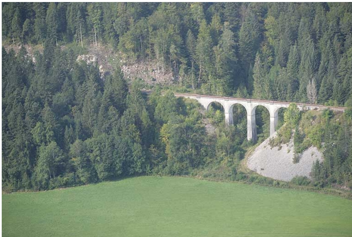
Vue aérienne, depuis le nord-est.