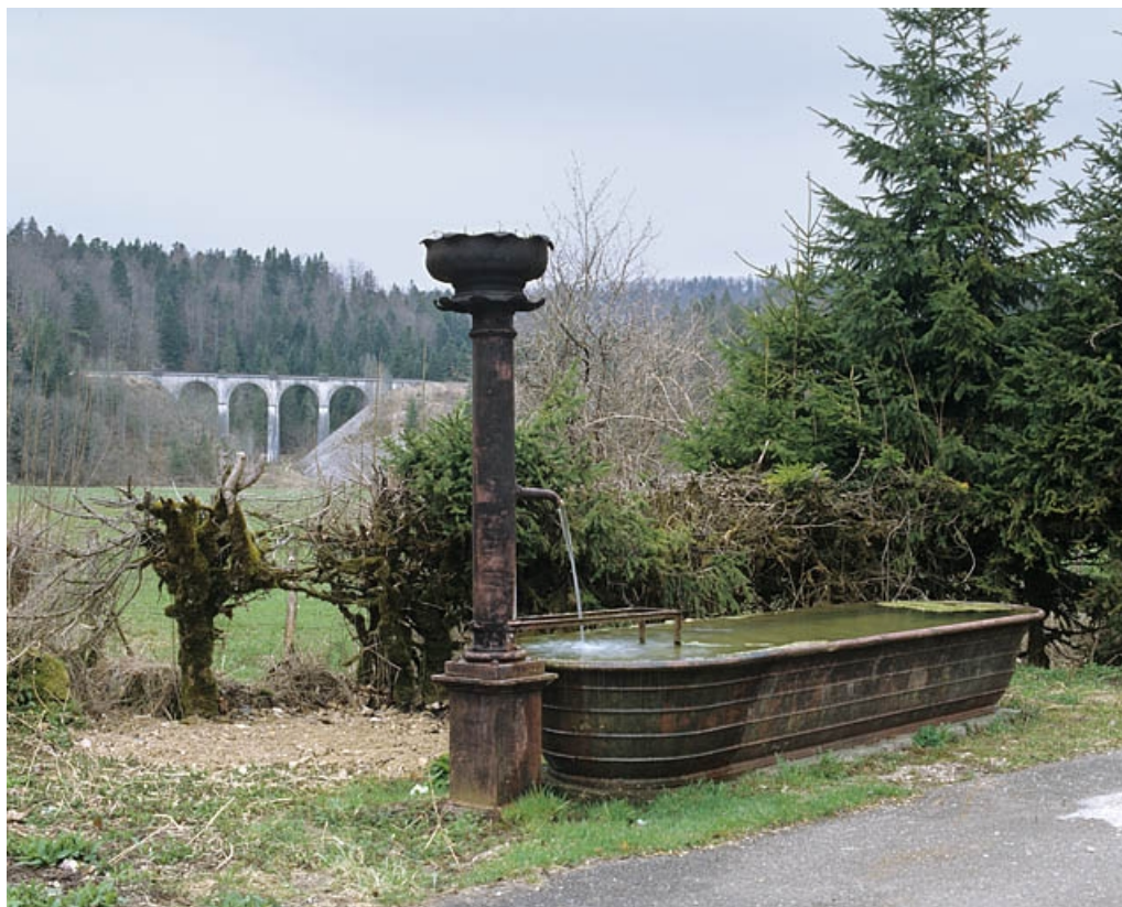
Vue d'ensemble depuis l'est, avec fontaine au premier plan (cadrage horizontal).