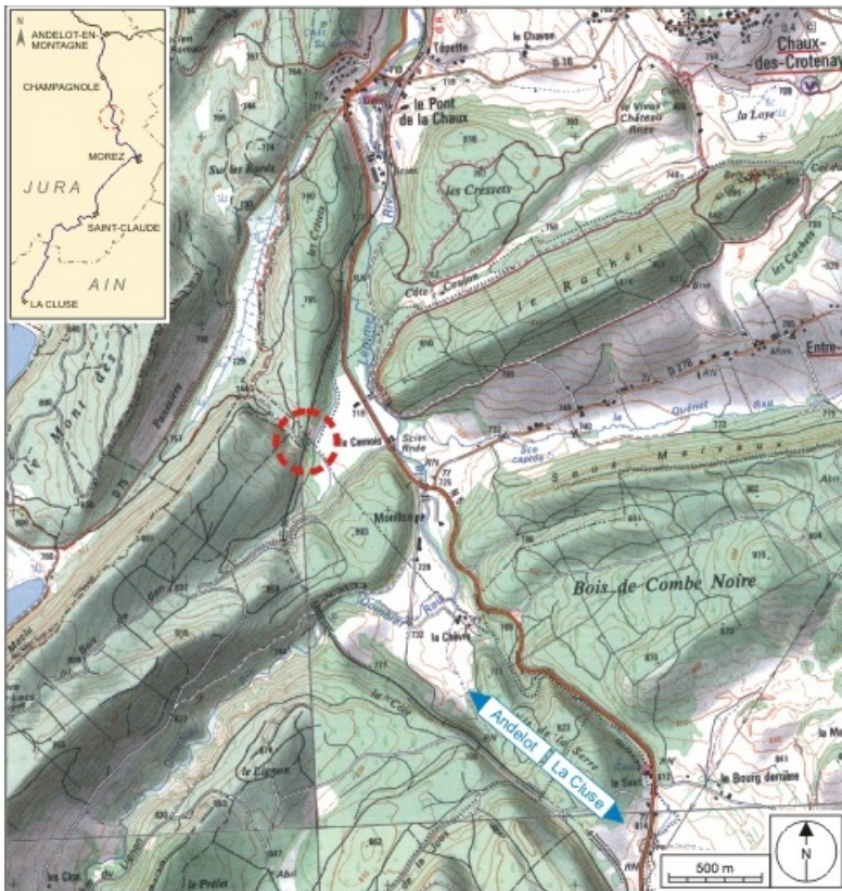
Carte et schéma de localisation. Carte topographique, IGN, 2000, dalles F087_048 et F087_049, échelle 1:25 000. Scan 25, licence n° 2008/CISE/2968.