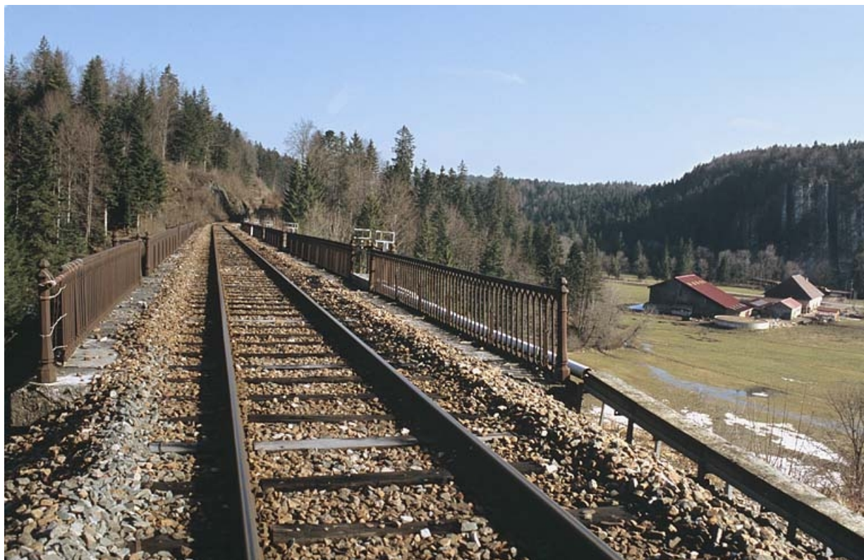
Voie sur le viaduc, depuis le côté La Cluse.