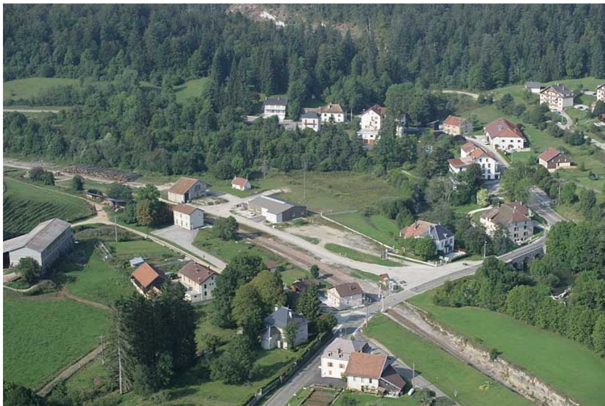
Vue aérienne du quartier de la gare, depuis le nord-est.

39, Chaux-des-Crotenay, 4 rue de la Gare, lieudit : le Pont de la Chaux