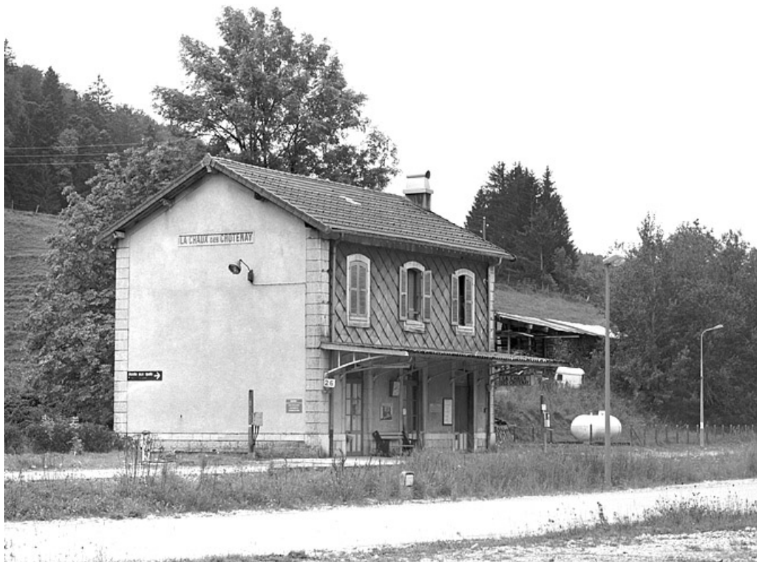
Bâtiment des voyageurs : façades postérieure (côté voie) et latérale gauche. 39, Chaux-des-Crotenay, 4 rue de la Gare, lieudit : le Pont de la Chaux