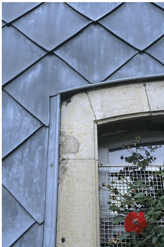
Bâtiment des voyageurs : détail de l'essentage de tôle de l'élévation latérale sud.

39, Chaux-des-Crotenay, 4 rue de la Gare, lieudit : le Pont de la Chaux