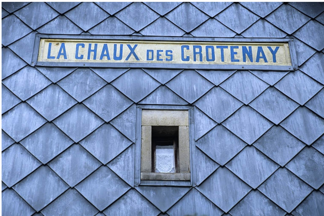
Bâtiment des voyageurs : nom de la gare porté sur l'élévation latérale sud (côté La Cluse). 39, Chaux-des-Crotenay, 4 rue de la Gare, lieudit : le Pont de la Chaux