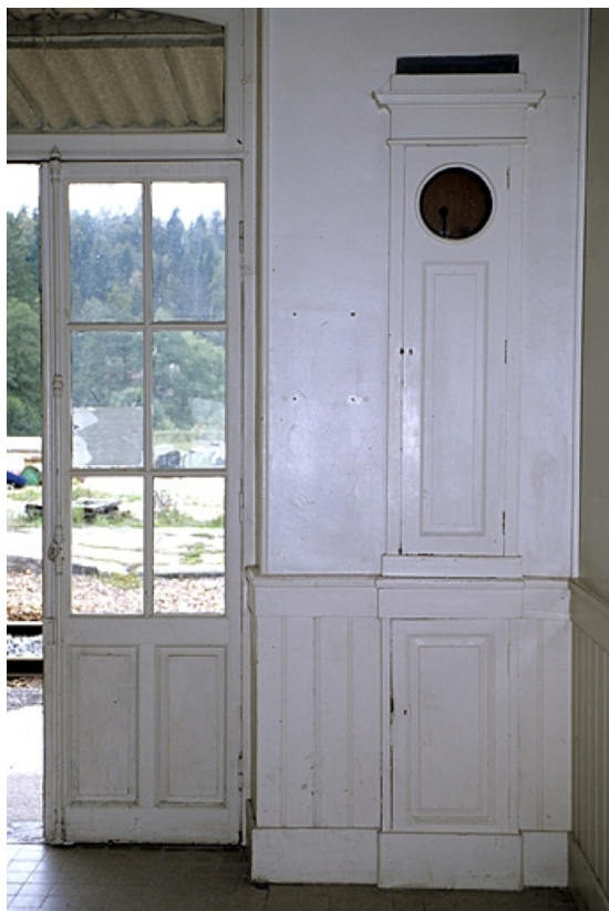
Bâtiment des voyageurs : caisse d'horloge comtoise encastrée dans le mur de la salle d'attente.

39, Chaux-des-Crotenay, 4 rue de la Gare, lieudit : le Pont de la Chaux