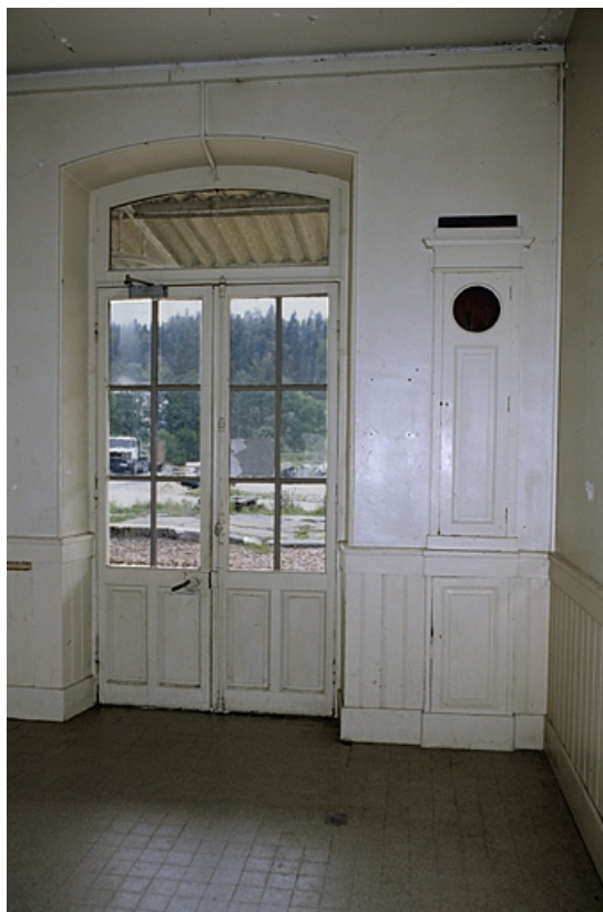
Bâtiment des voyageurs : intérieur de la salle d'attente.

39, Chaux-des-Crotenay, 4 rue de la Gare, lieudit : le Pont de la Chaux