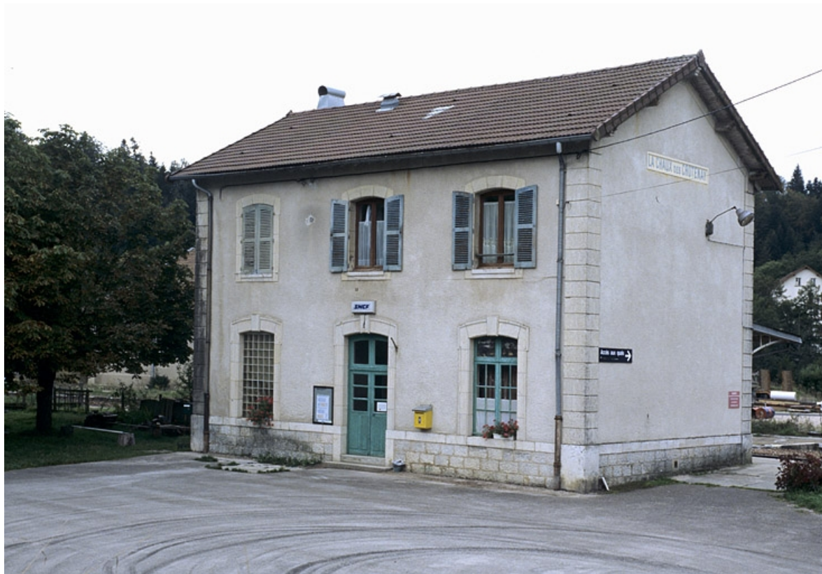
Bâtiment des voyageurs : façade antérieure, de trois quarts droite. 39, Chaux-des-Crotenay, 4 rue de la Gare, lieudit : le Pont de la Chaux