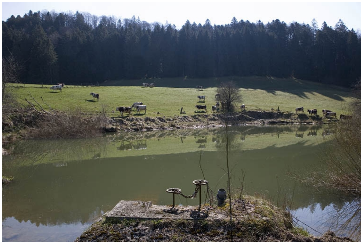
Réservoir : vue d'ensemble, depuis l'ouest.

39, Chaux-des-Crotenay, 4 rue de la Gare, lieudit : le Pont de la Chaux