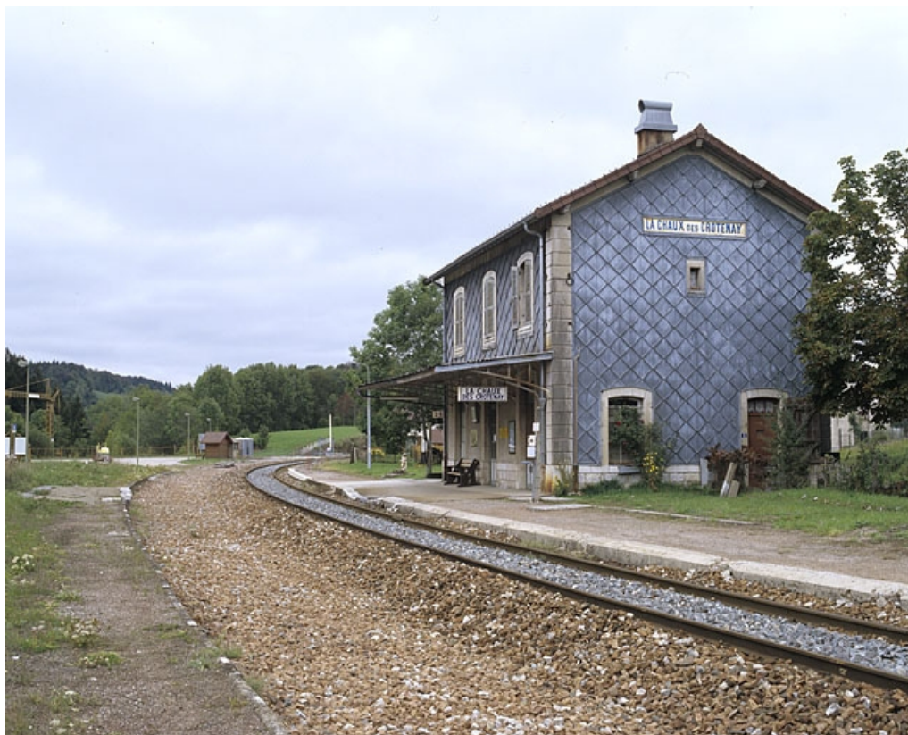
Bâtiment des voyageurs : façades postérieure (côté voie) et latérale droite.

39, Chaux-des-Crotenay, 4 rue de la Gare, lieudit : le Pont de la Chaux