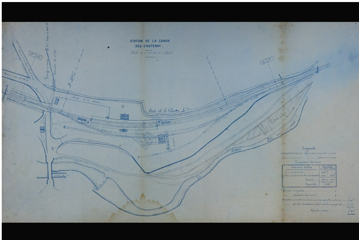
Plan au 1/1000 de l'emplacement de la station de La Chaux-des-Crotenay avec indication des voies d'accès, 1880. 39, Chaux-des-Crotenay, 4 rue de la Gare, lieudit : le Pont de la Chaux