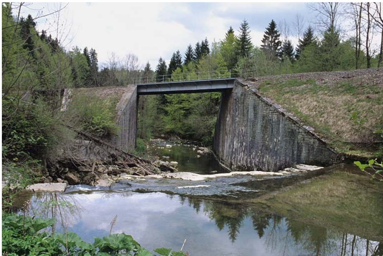
Pont sur la Lemme : vue d'ensemble, côté La Cluse.

39, Chaux-des-Crotenay R.N. 5, lieudit : les Belettes