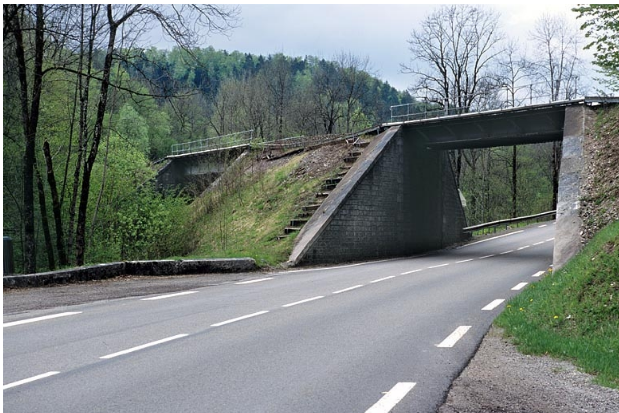
Pont sur la route nationale n° 5 : vue d'ensemble, depuis le côté Andelot-en-Montagne 39, Chaux-des-Crotenay R.N. 5, lieudit : les Belettes