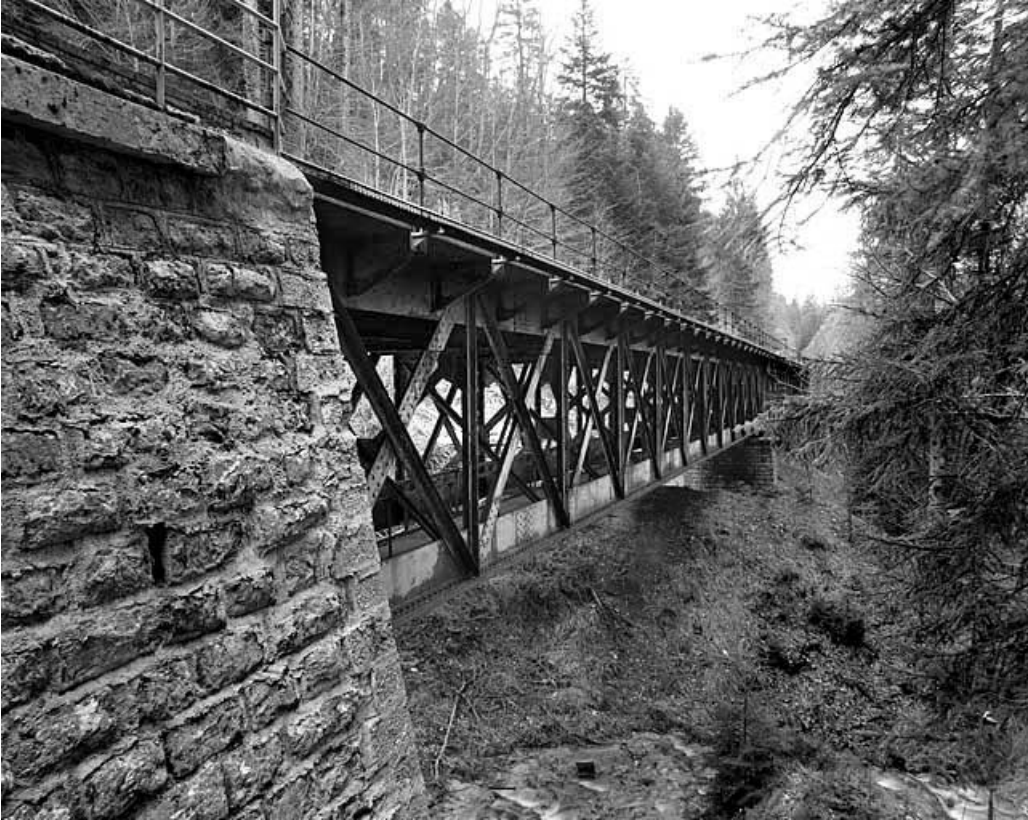
Viaduc : l'extrémité sud (vers La Cluse), côté vallée.

39, Chaux-des-Crotenay, lieudit : les Belettes