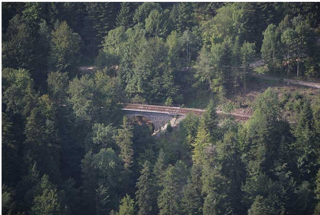
Vue aérienne du viaduc, depuis le nord.

39, Le Vaudioux Route forestière de Sous la Baume, lieudit : Malproche