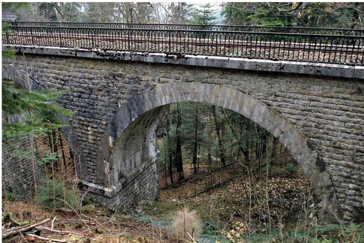
Viaduc : détail d'une travée, au sud (côté rocher).

39, Le Vaudioux Route forestière de Sous la Baume, lieudit : Malproche