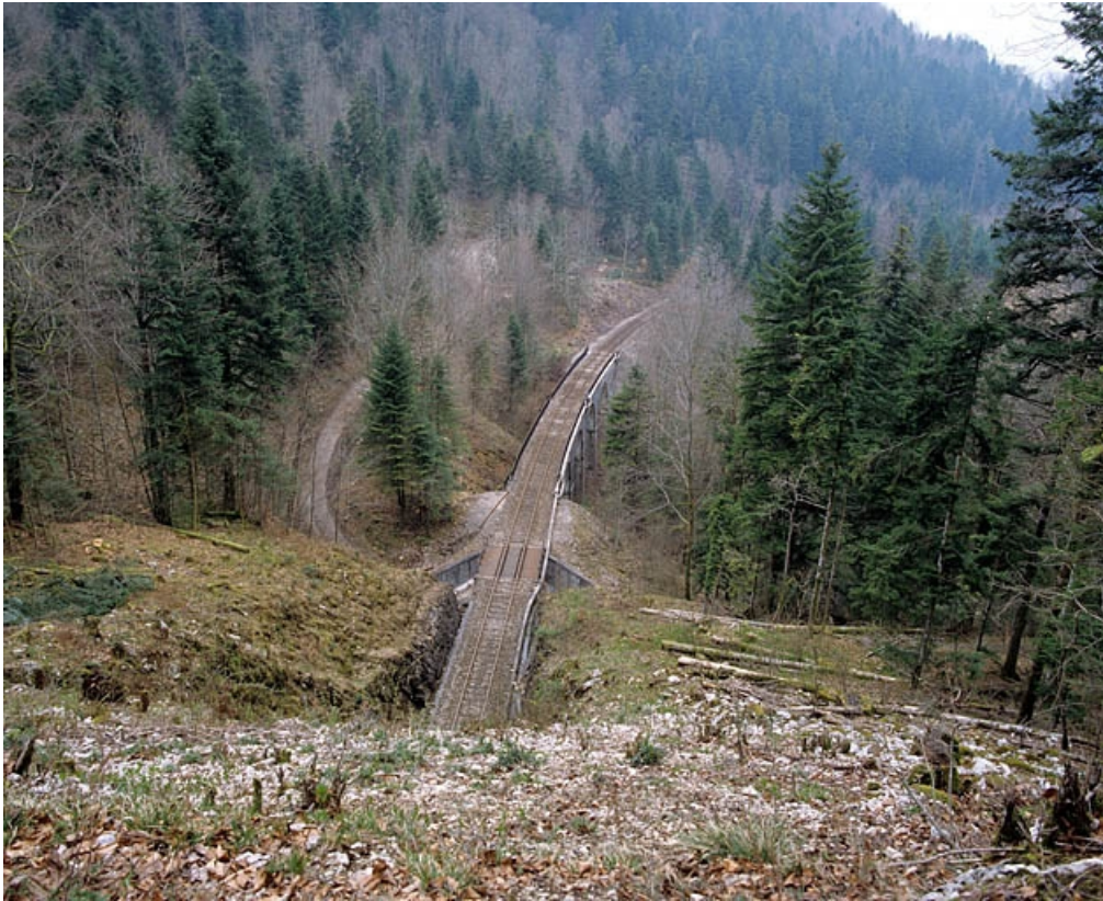
Vue d'ensemble plongeante, depuis la tête ouest du tunnel (côté Andelot-en-Montagne).

39, Le Vaudioux Route forestière de Sous la Baume, lieudit : Malproche