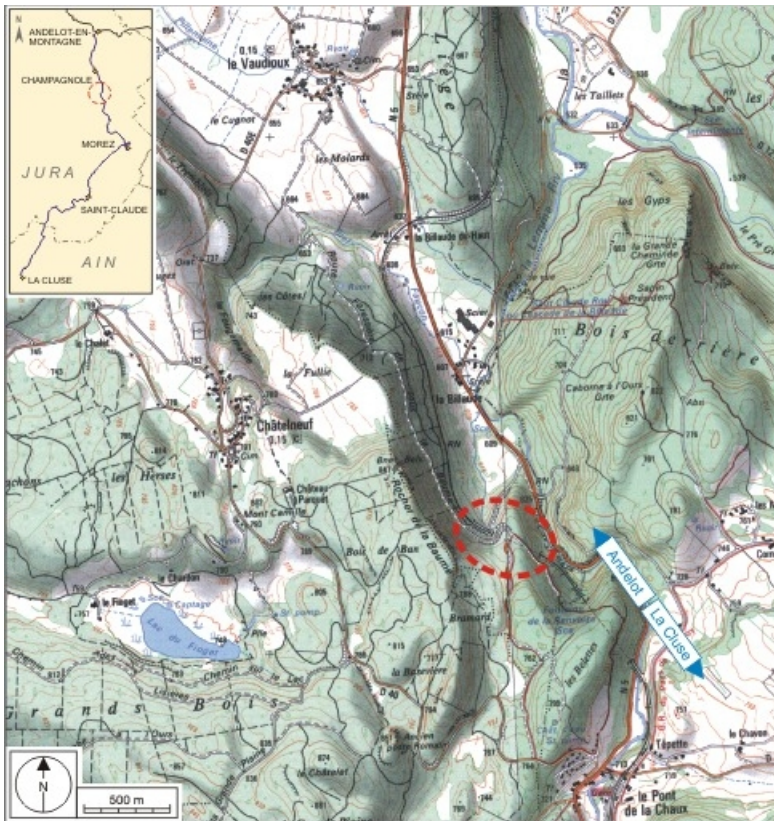
Carte et schéma de localisation. Carte topographique, IGN, 2000, dalle F087_048, échelle 1:25 000. Scan 25, licence n° 2008/CISE/2968.

39, Le Vaudouix Route forestière de Sous la Baume, lieudit : Malproche