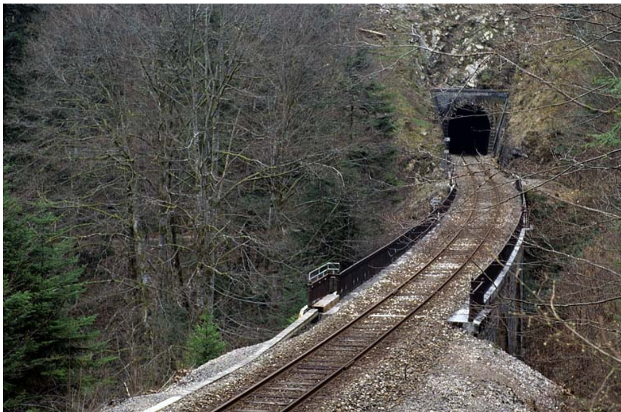
Viaduc : vue d'ensemble, depuis le nord-ouest (côté Andelot-en-Montagne).

39, Le Vaudioux Route forestière de Sous la Baume, lieudit : Malproche