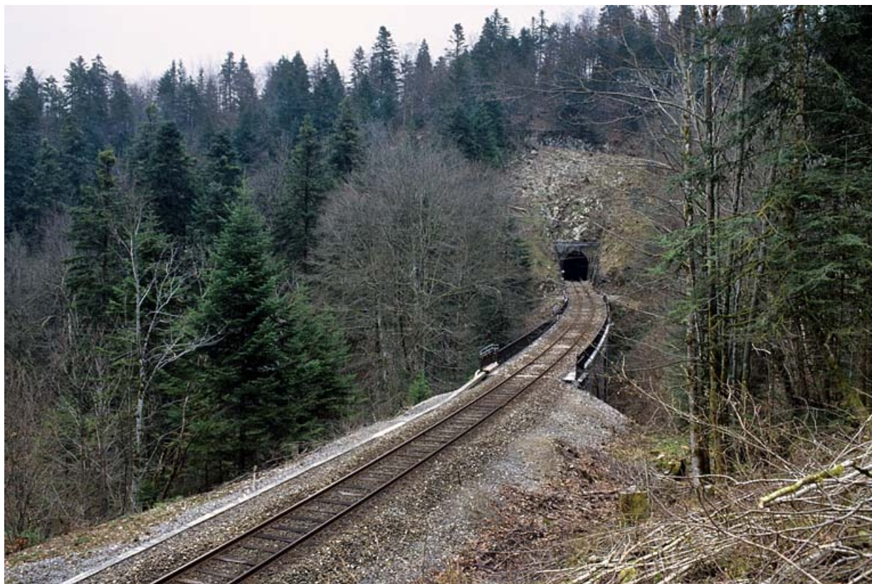
Vue d'ensemble, depuis le nord-ouest (côté Andelot-en-Montagne). 39, Le Vaudioux Route forestière de Sous la Baume, lieudit : Malproche