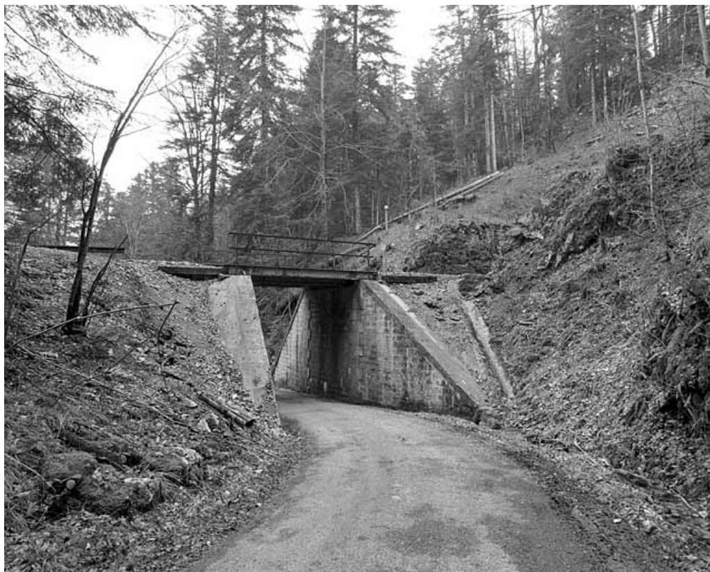
Pont, depuis la route côté rocher.

39, Le Vaudioux Route forestière de Sous la Baume, lieudit : Malproche