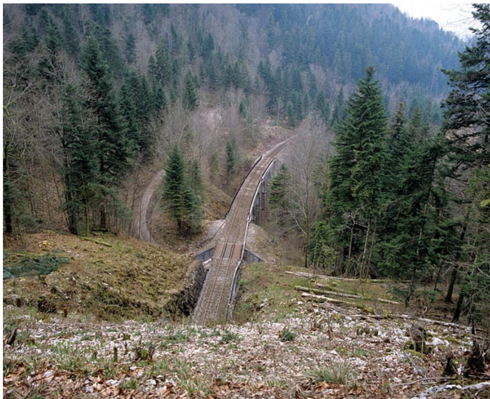
Vue d'ensemble plongeante, depuis la tête ouest du tunnel (côté Andelot-en-Montagne).

39, Le Vaudioux Route forestière de Sous la Baume, lieudit : Malproche