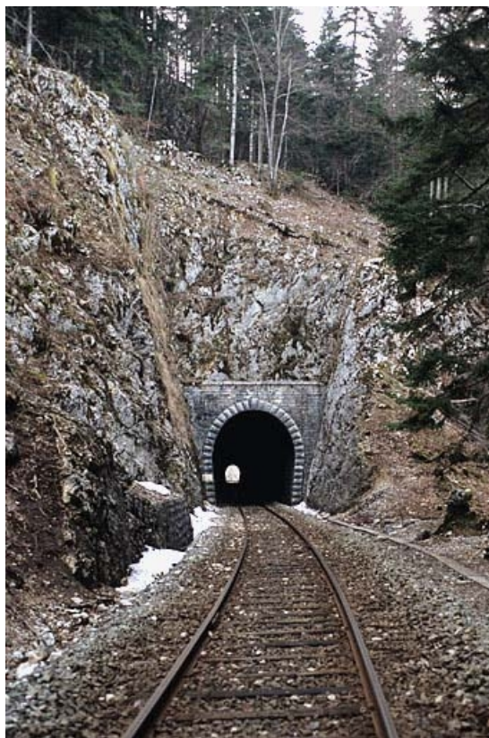
Tunnel : tête côté La Cluse.

39, Le Vaudioux Route forestière de Sous la Baume, lieudit : Malproche