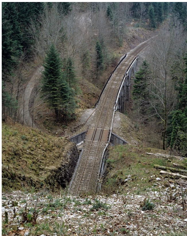
Vue d'ensemble plongeante, depuis la tête ouest du tunnel (côté Andelot-en-Montagne).

39, Le Vaudioux Route forestière de Sous la Baume, lieudit : Malproche