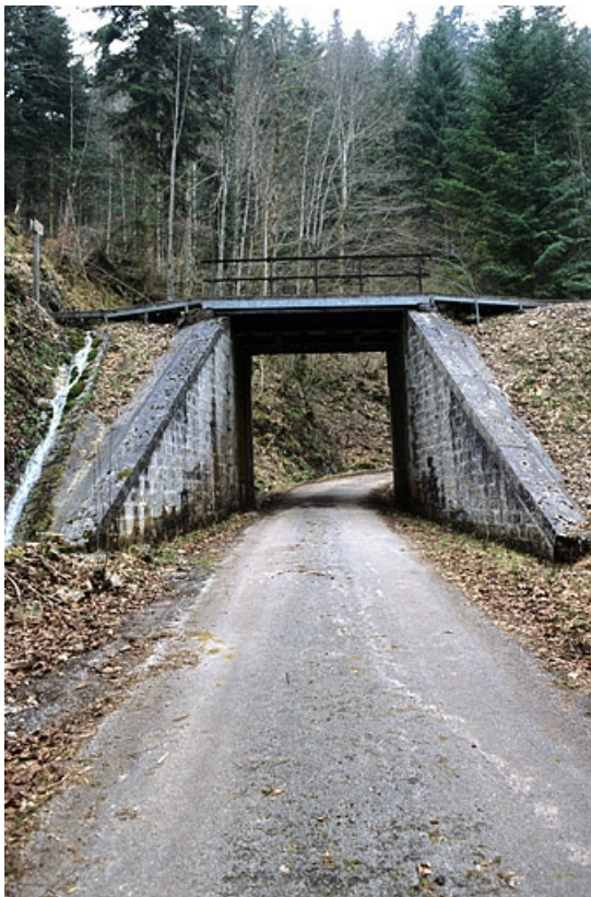
Pont, depuis la route côté vallée.

39, Le Vaudioux Route forestière de Sous la Baume, lieudit : Malproche