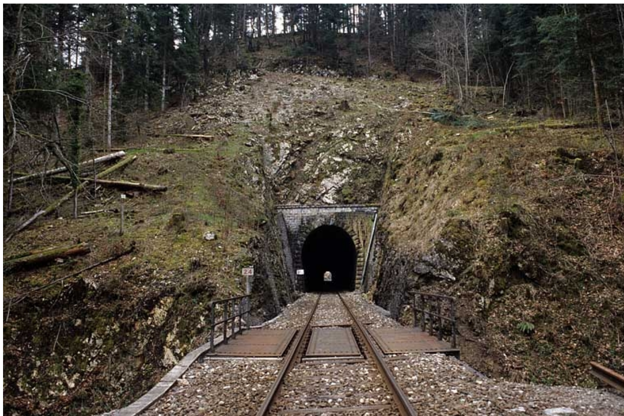
Pont et tunnel, depuis la plate-forme côté Andelot-en-Montagne.

39, Le Vaudioux Route forestière de Sous la Baume, lieudit : Malproche