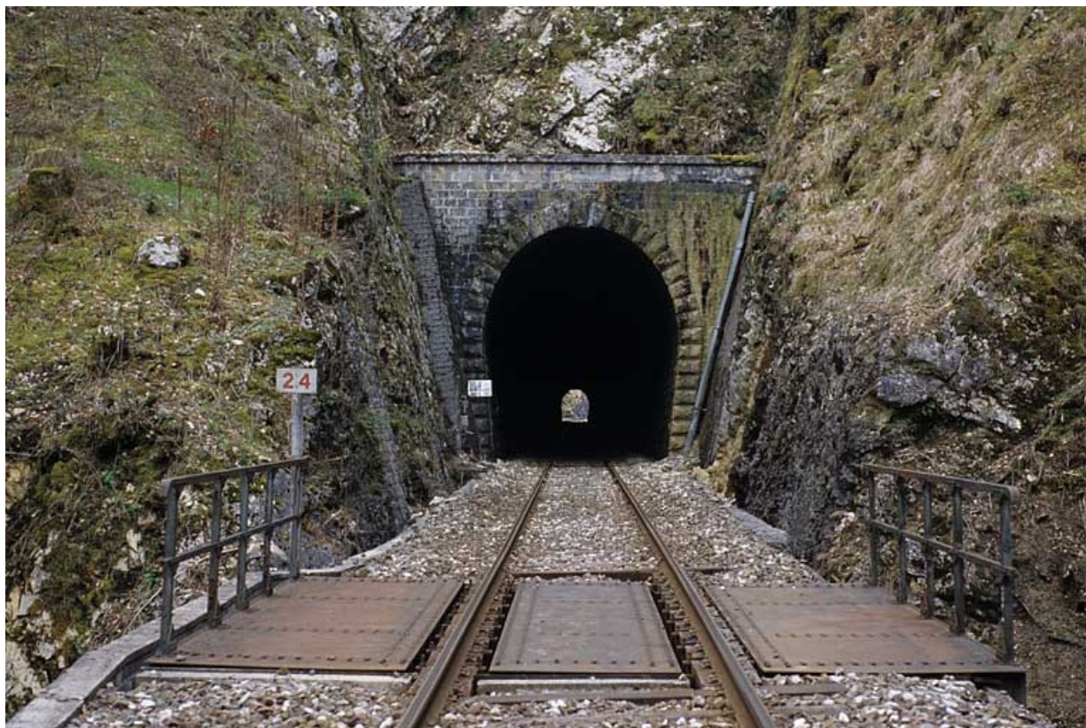
Tunnel : tête côté Andelot-en-Montagne.

39, Le Vaudioux Route forestière de Sous la Baume, lieudit : Malproche