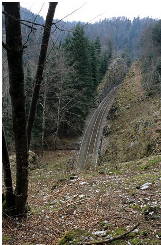
Vue plongeante sur la voie, passant en tranchée à la sortie du tunnel côté La Cluse.

39, Le Vaudioux Route forestière de Sous la Baume, lieudit : Malproche