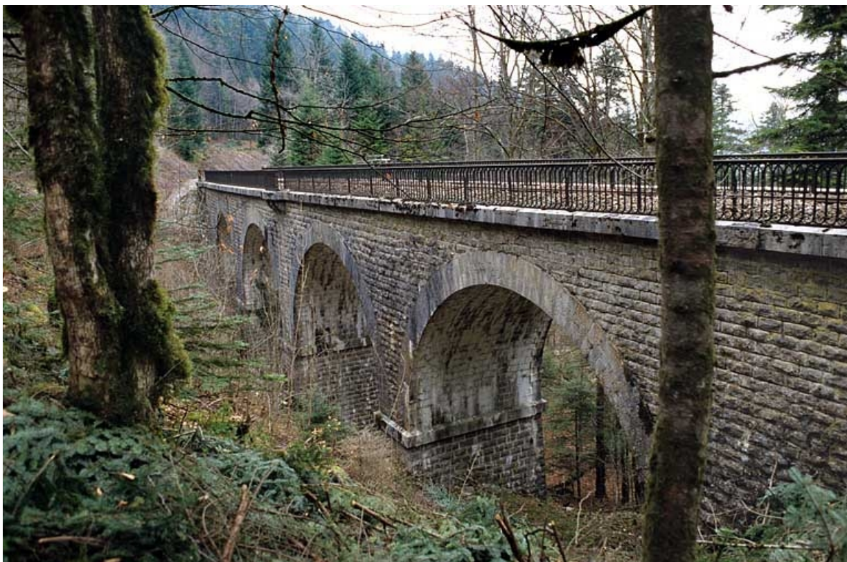
Viaduc : élévation sud (côté rocher).

39, Le Vaudioux Route forestière de Sous la Baume, lieudit : Malproche