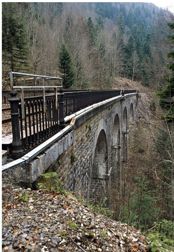
Viaduc : élévation nord (côté vallée), vue en enfilade.

39, Le Vaudioux Route forestière de Sous la Baume, lieudit : Malproche