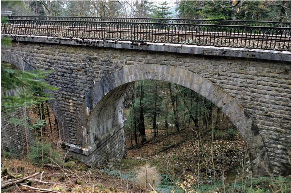
Viaduc : détail d'une travée, au sud (côté rocher).

39, Le Vaudioux Route forestière de Sous la Baume, lieudit : Malproche