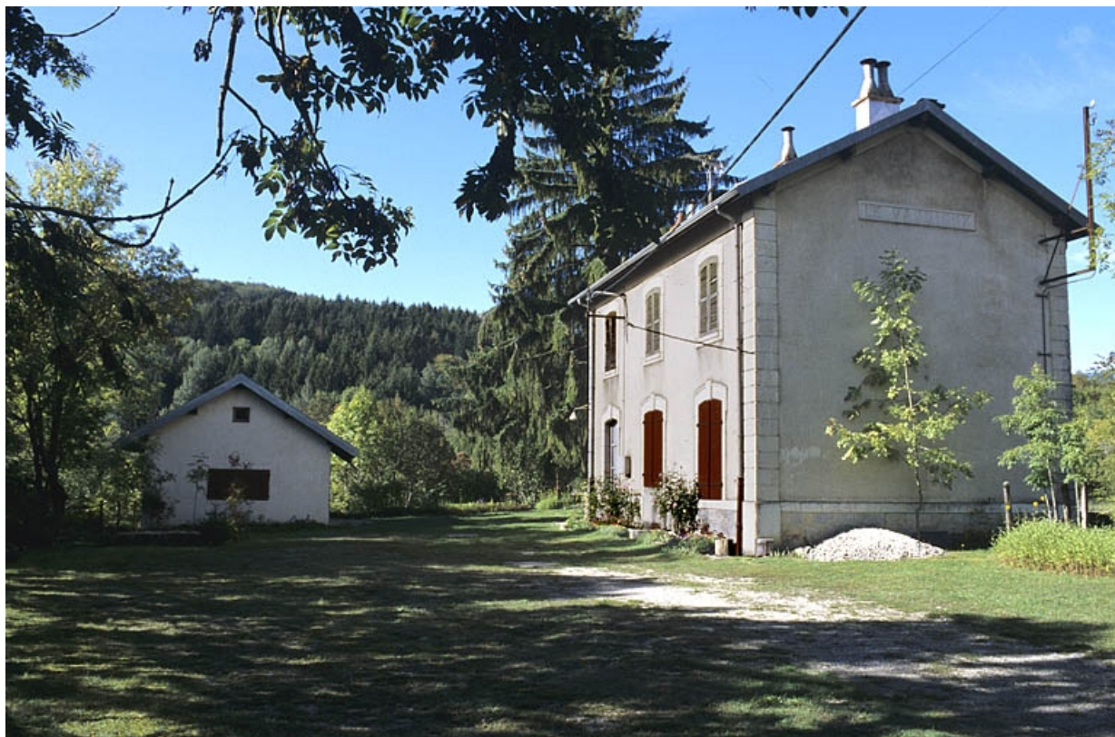
Façade antérieure du bâtiment des voyageurs, de trois quarts droite.

39, Le Vaudioux R.N. 5, lieudit : la Billaude du Haut