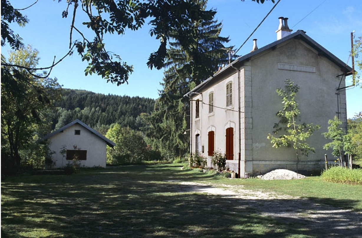
Façade antérieure du bâtiment des voyageurs, de trois quarts droite.

39, Le Vaudioux R.N. 5, lieudit : la Billaude du Haut