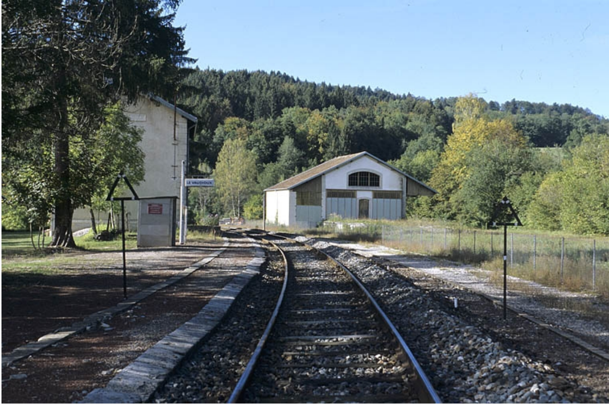
Quai des voyageurs et voie, depuis le côté Andelot-en-Montagne.

39, Le Vaudioux R.N. 5, lieudit : la Billaude du Haut