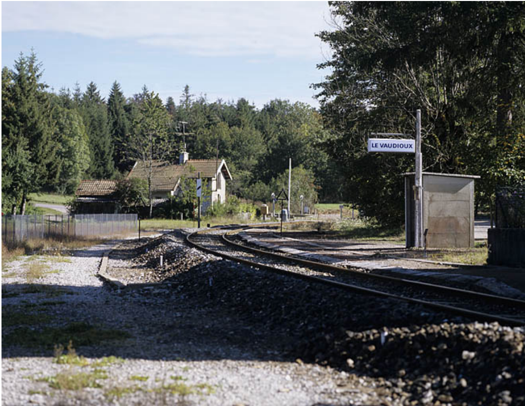
Quai des voyageurs et voie, vers le côté Andelot-en-Montagne.

39, Le Vaudioux R.N. 5, lieudit : la Billaude du Haut