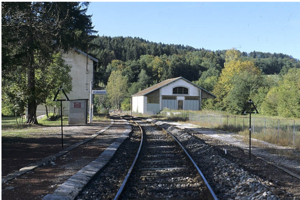
Quai des voyageurs et voie, depuis le côté Andelot-en-Montagne.

39, Le Vaudioux R.N. 5, lieudit : la Billaude du Haut