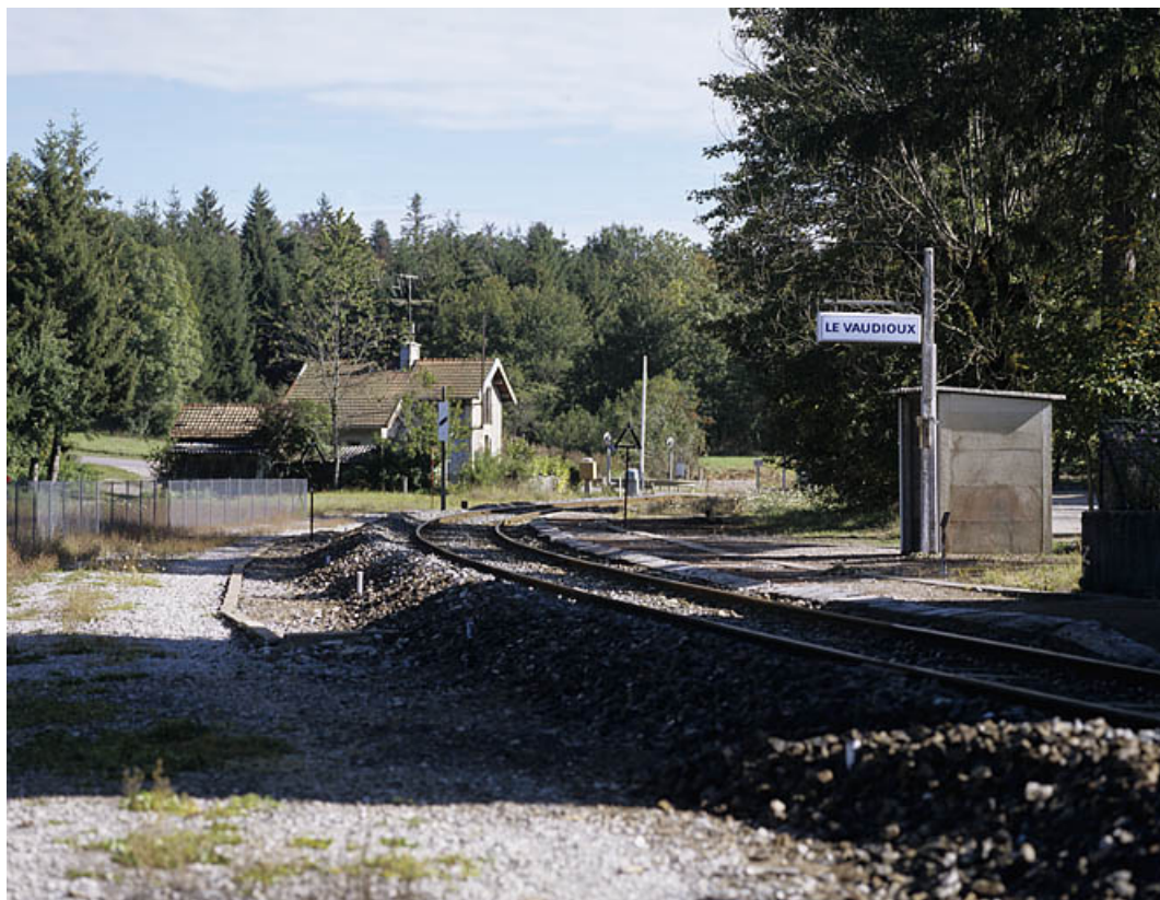
Quai des voyageurs et voie, vers le côté Andelot-en-Montagne.

39, Le Vaudioux R.N. 5, lieudit : la Billaude du Haut