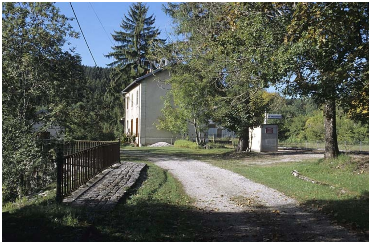
Bâtiment des voyageurs depuis le chemin d'accès, au nord-est.

39, Le Vaudioux R.N. 5, lieudit : la Billaude du Haut