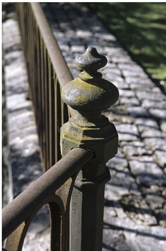
Motif d'amortissement d'un potelet du garde-corps.

39, Le Vaudioux R.N. 5, lieudit : la Billaude du Haut