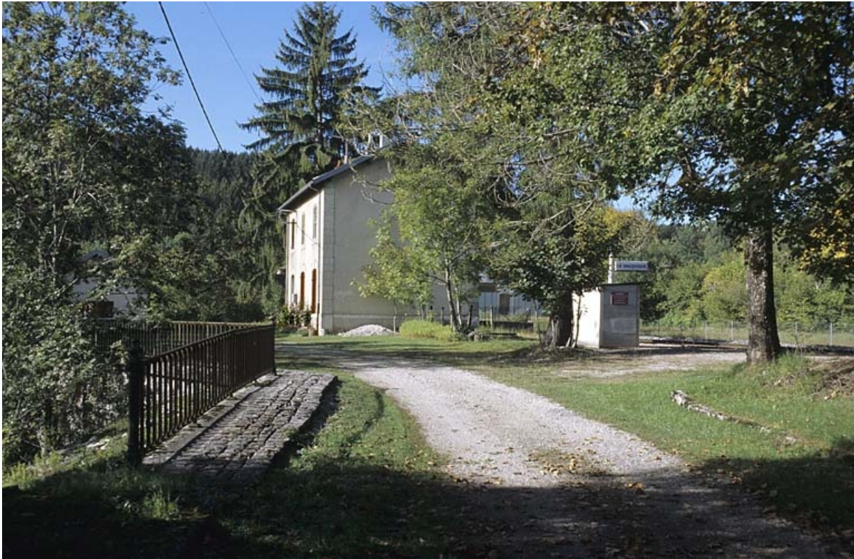
Bâtiment des voyageurs depuis le chemin d'accès, au nord-est.

39, Le Vaudioux R.N. 5, lieudit : la Billaude du Haut