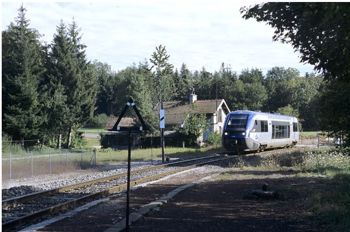
Arrivée en gare d'un autorail X 73500.

39, Le Vaudioux R.N. 5, lieudit : la Billaude du Haut