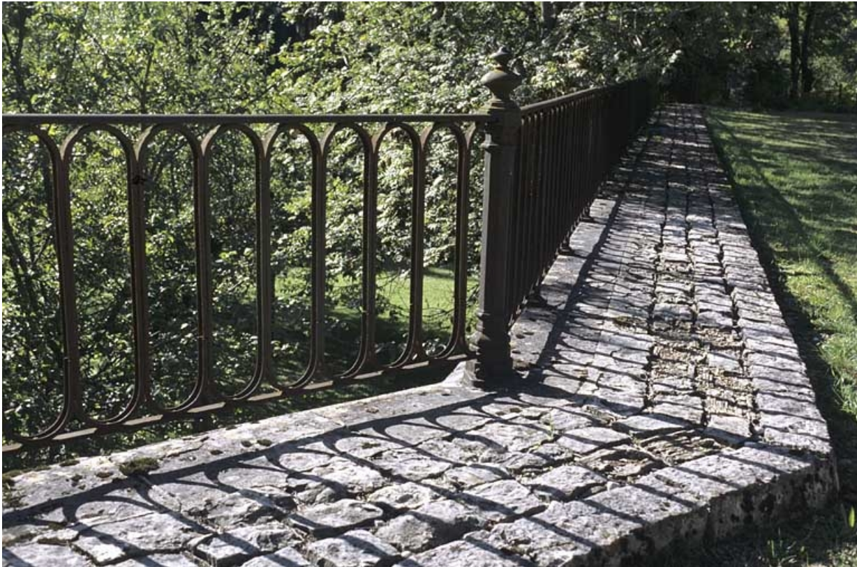
Garde-corps métallique de la cour des voyageurs.

39, Le Vaudioux R.N. 5, lieudit : la Billaude du Haut