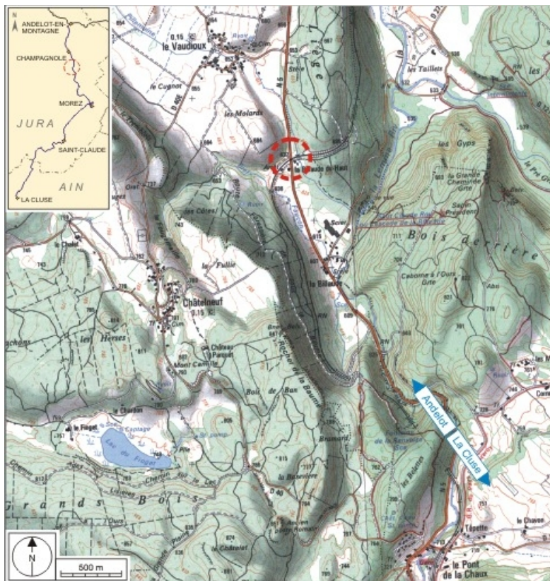
Carte et schéma de localisation. Carte topographique, IGN, 2000, dalle F087_048, échelle 1:25 000. Scan 25, licence n° 2008/CISE/2968.

39, Le Vaudioux R.N. 5, lieudit : la Billaude du Haut