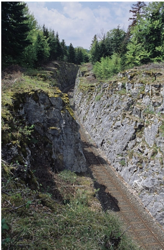
Tranchée côté Andelot-en-Montagne, vue du pont.