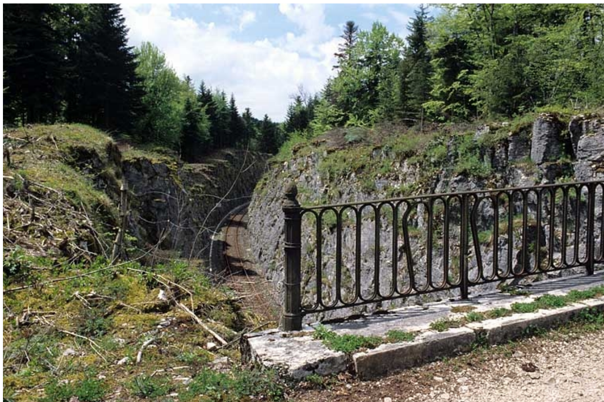
Tranchée côté Andelot-en-Montagne et détail du garde-corps.