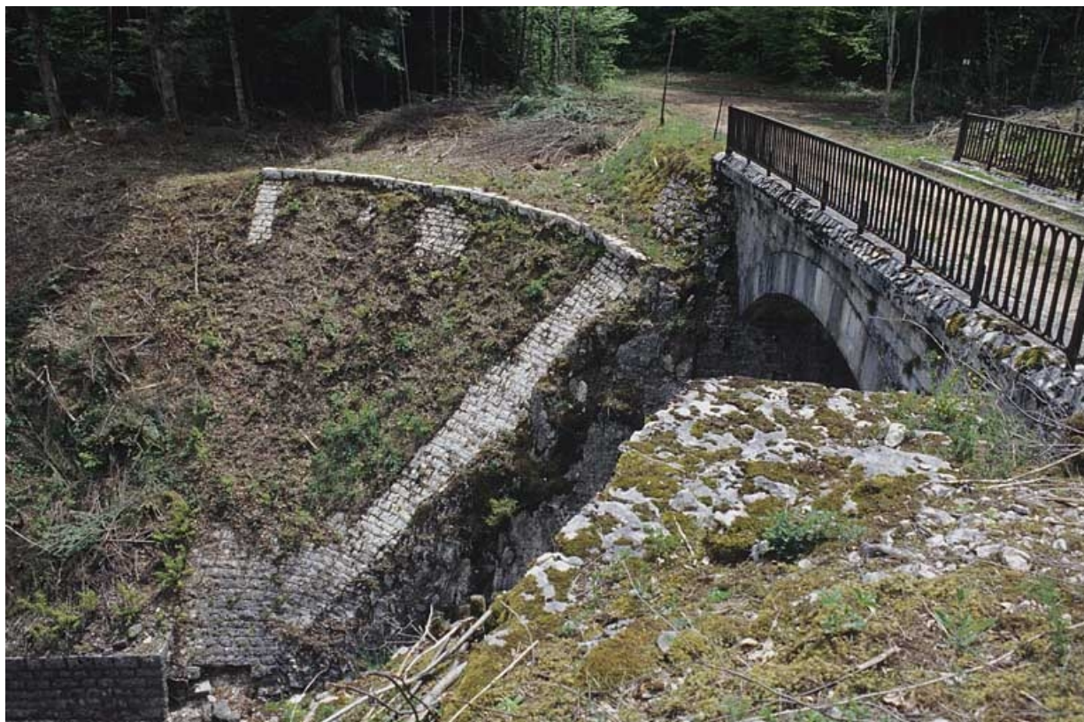
Mur en quart de cône pointe en bas.