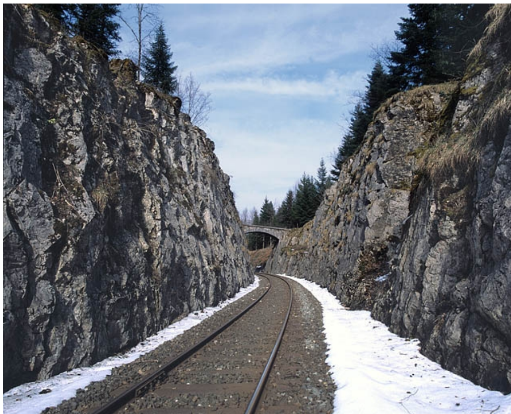
Vue d'ensemble du pont et de la tranchée, depuis la voie (côté Andelot-en-Montagne).