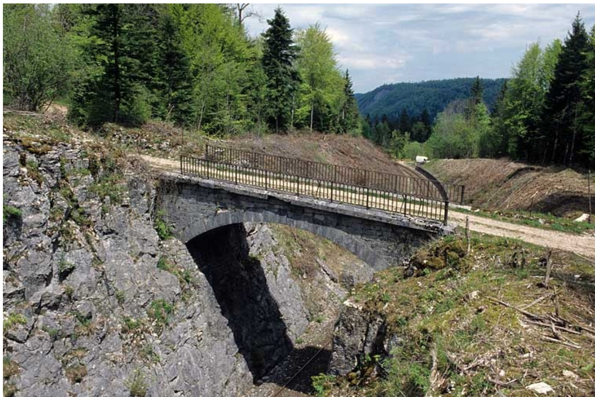
Vue plongeante, depuis le sud (côté La Cluse).