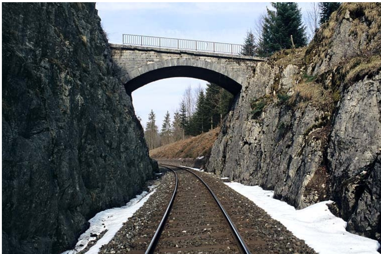
Vue d'ensemble, depuis la voie (côté Andelot-en-Montagne).