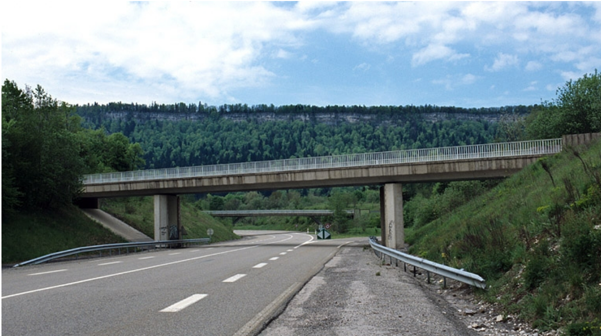
Vue d'ensemble, depuis le nord.

39, Champagnole R.N. 5, lieudit : la Roche