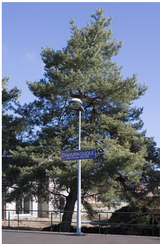
Lampadaire et panneau identifiant la halte.