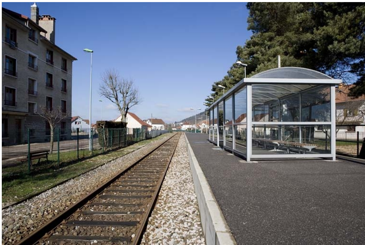
Vue d'ensemble, depuis le côté La Cluse.