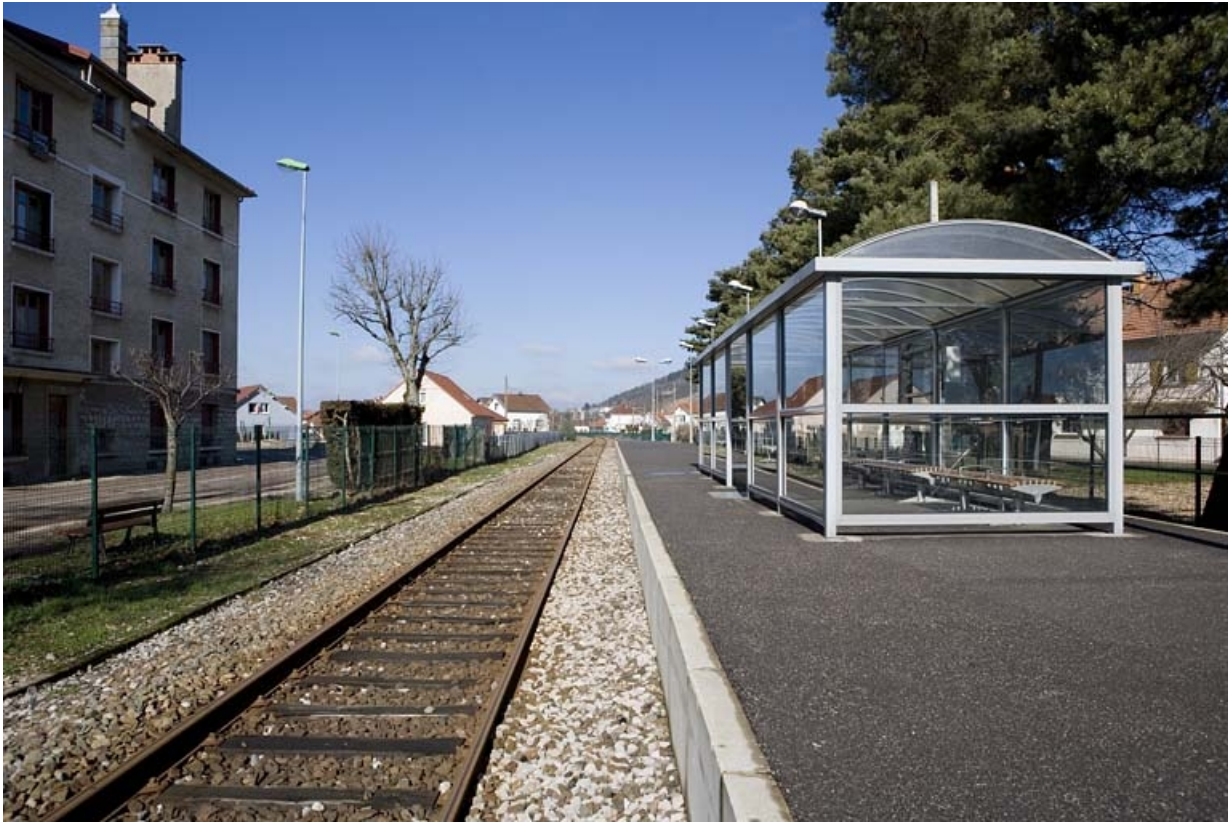
Vue d'ensemble, depuis le côté La Cluse.