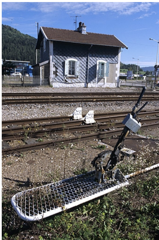
Au premier plan, levier de manoeuvre d'appareil de voie.

39, Champagnole rue Léon et Georges Bazinet