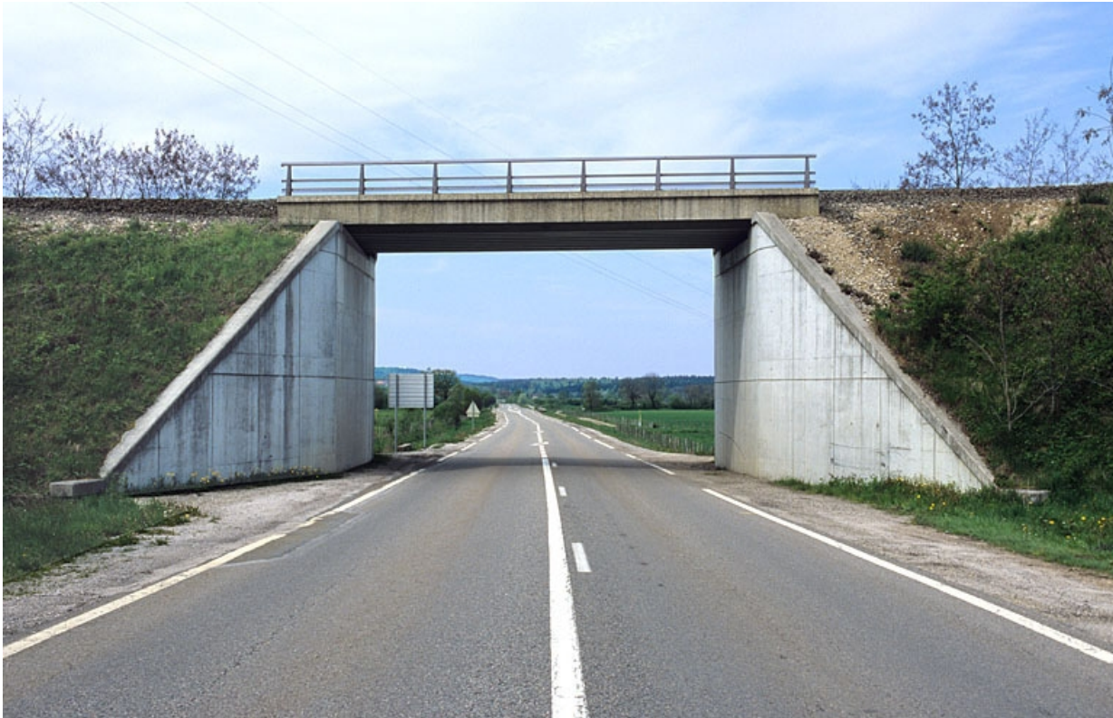
Vue d'ensemble, depuis l'est.

39, Champagnole R.D. 5, lieudit : la Garenne