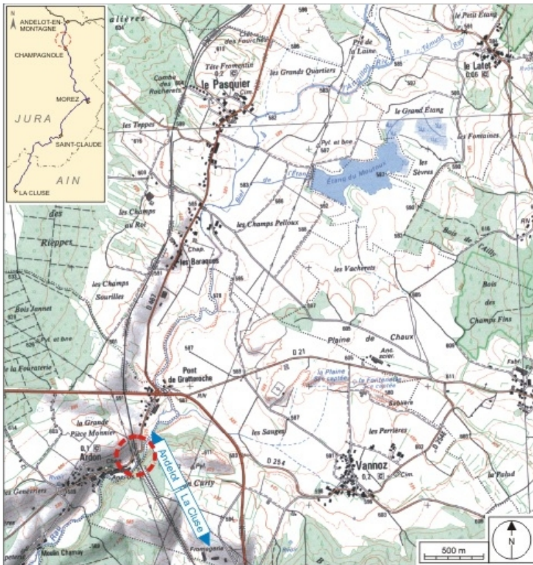
Carte et schéma de localisation. Carte topographique, IGN, 2000, dalle F087_047, échelle 1:25 000. Scan 25, licence n° 2008/CISE/2968.