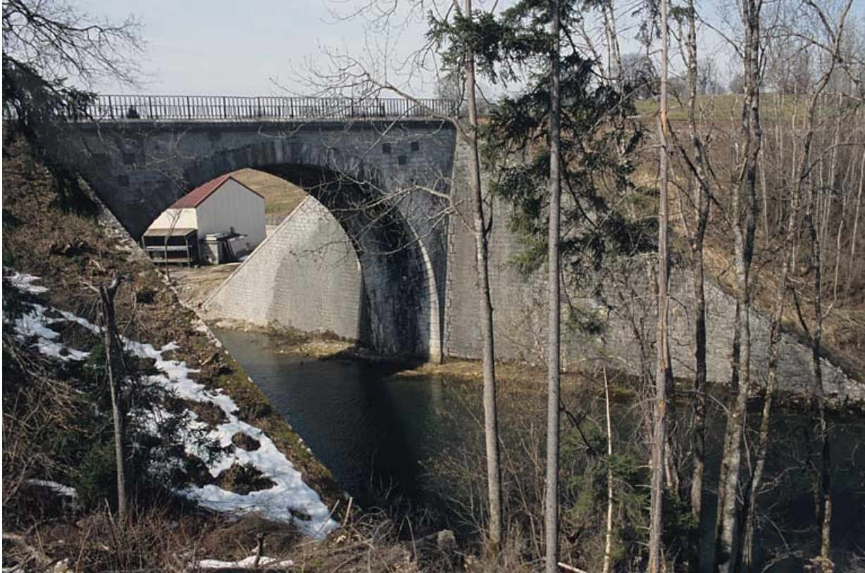
Pont sur l'Angillon : vue d'ensemble, depuis l'est (amont, rive gauche). 39, Ardon R.D. 27