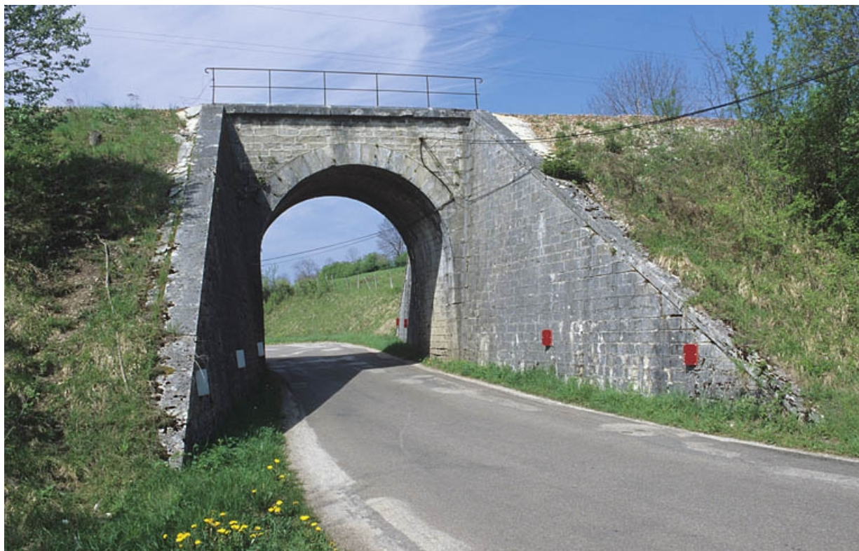
Pont sur la route départementale n° 27 : vue d'ensemble, depuis l'est. 39, Ardon R.D. 27