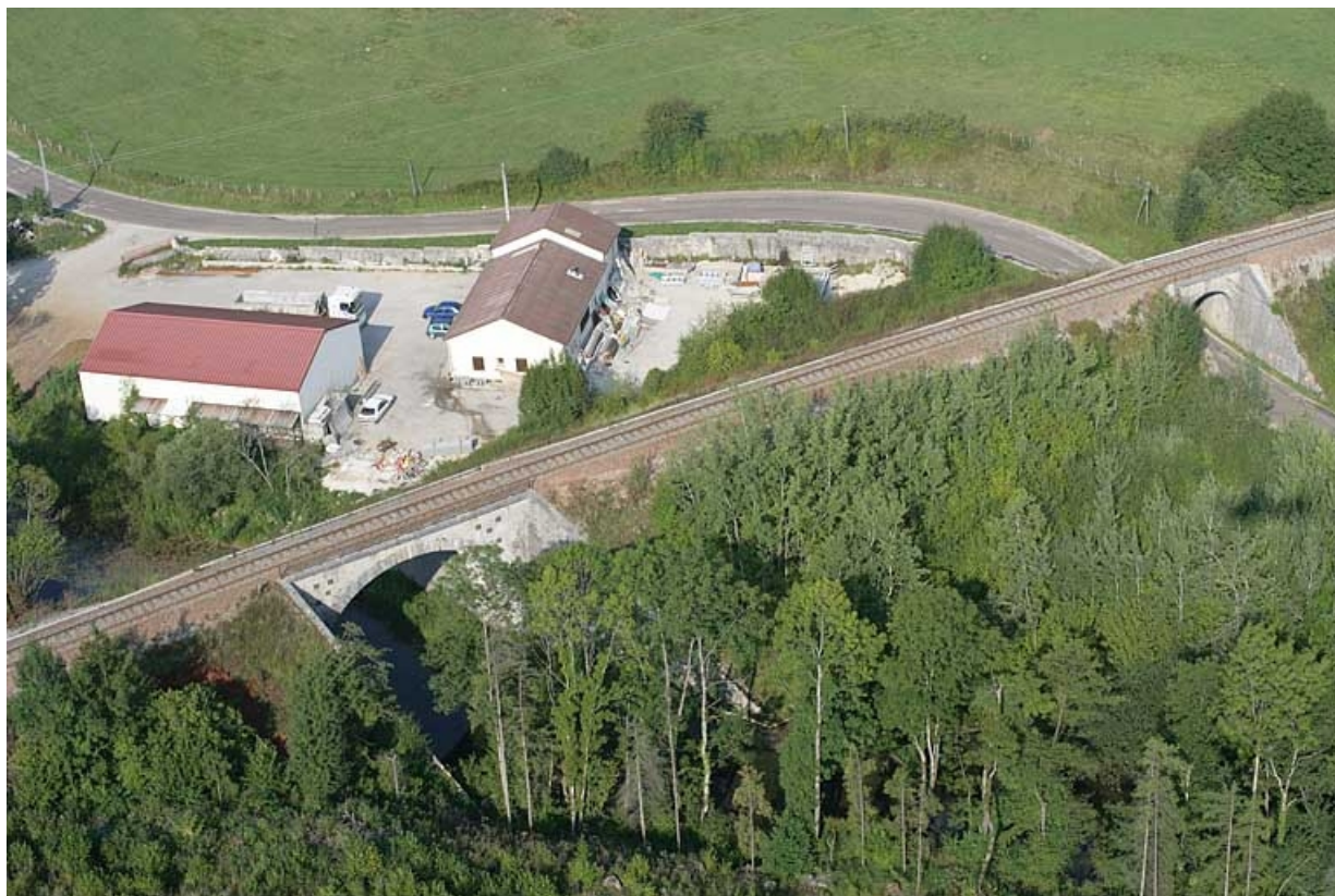
Vue aérienne, depuis l'est. 39, Ardon R.D. 27