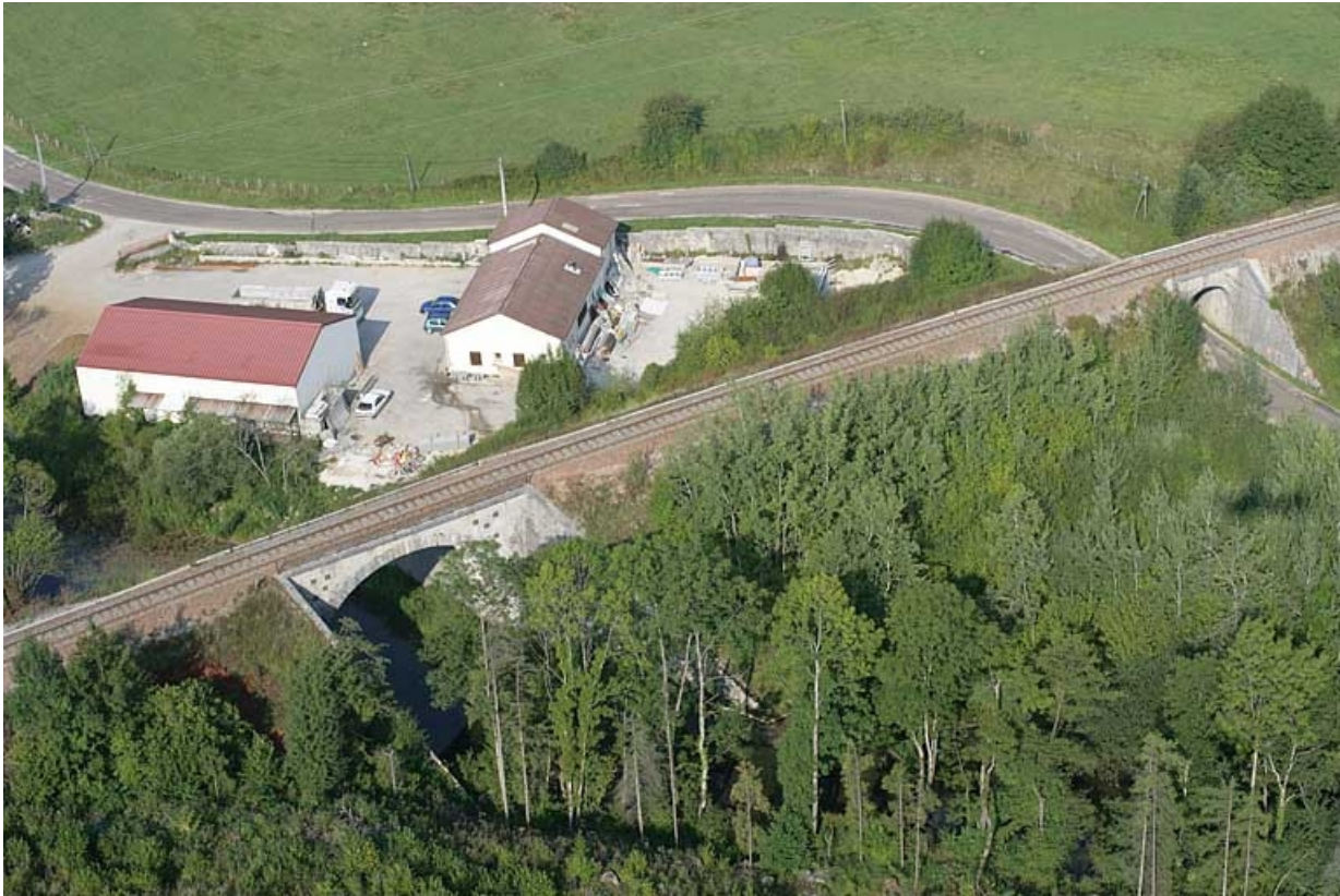
Vue aérienne, depuis l'est.