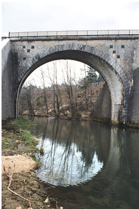
Pont sur l'Angillon : tête ouest (aval), appareil hélicoïdal. 39, Ardon R.D. 27