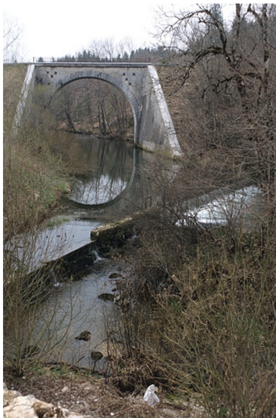
Au premier plan, le barrage de l'ancienne usine de menuiserie de la société des Constructions métalliques Fillod. 39, Ardon R.D. 27