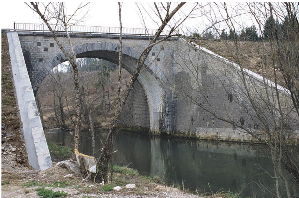
Pont sur l'Angillon : tête ouest (aval).