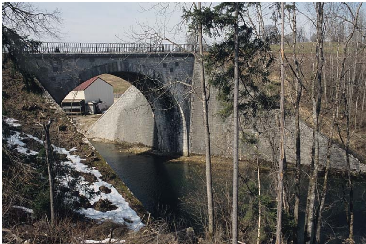
Pont sur l'Angillon : vue d'ensemble, depuis l'est (amont, rive gauche). 39, Ardon R.D. 27