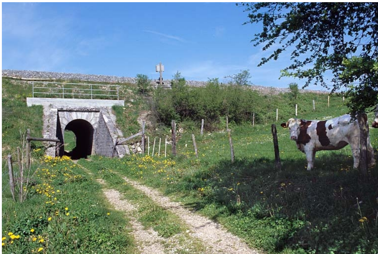
Vue d'ensemble de trois quarts, depuis l'est.