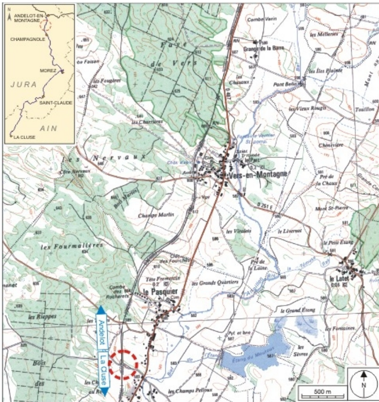
Carte et schéma de localisation. Carte topographique, IGN, 2000, dalle F087_047, échelle 1:25 000. Scan 25, licence n° 2008/CISE/2968.

39, Le Pasquier V.C. 1, lieudit : les Champs au Roi