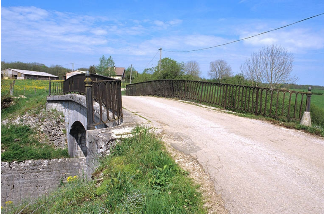
Tablier et garde-corps, depuis le nord-ouest.

39, Le Pasquier V.C. 1, lieudit : les Champs au Roi