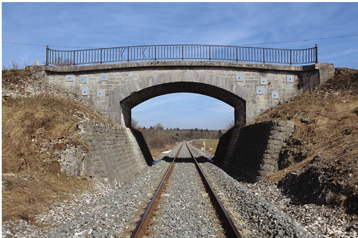
Vue d'ensemble, depuis le nord (côté Andelot-en-Montagne).

39, Le Pasquier V.C. 1, lieudit : les Champs au Roi