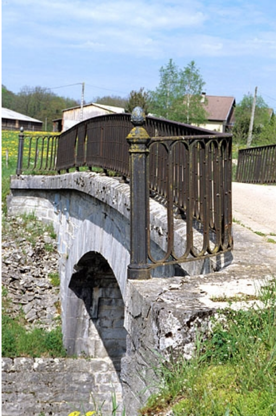
Vue d'ensemble du garde-corps nord.

39, Le Pasquier V.C. 1, lieudit : les Champs au Roi