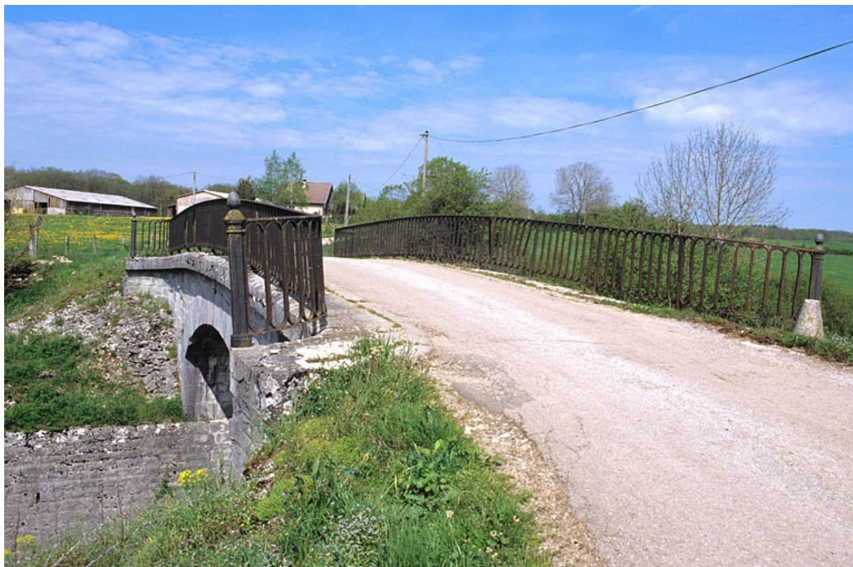
Tablier et garde-corps, depuis le nord-ouest.

39, Le Pasquier V.C. 1, lieudit : les Champs au Roi