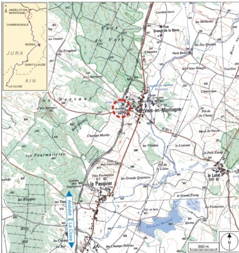
Carte et schéma de localisation. Carte topographique, IGN, 2000, dalle F087_047, échelle 1:25 000. Scan 25, licence n° 2008/CISE/2968.

39, Vers-en-Montagne, 79, 80 chemin du Quai