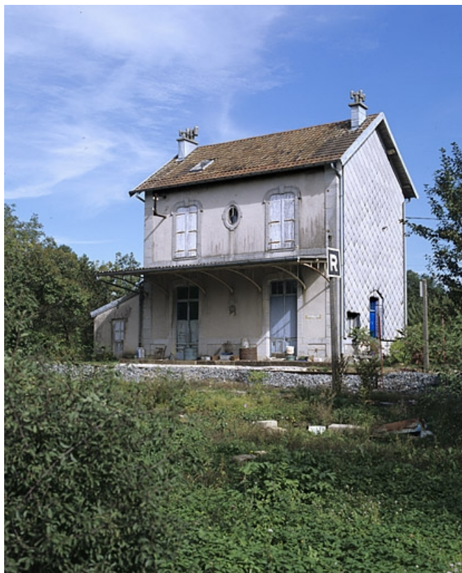
Façade postérieure, de trois quarts droite. 39, Vers-en-Montagne, 79, 80 chemin du Quai