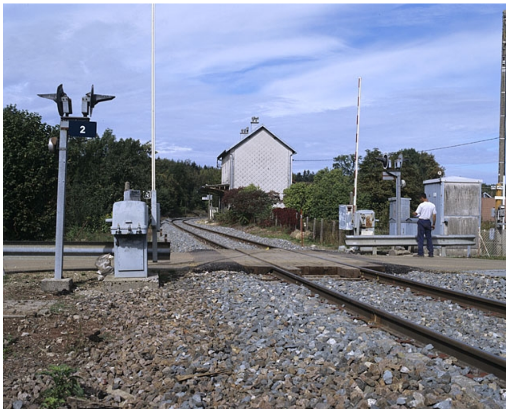
Vue d'ensemble depuis le passage à niveau n° 2, au sud.

39, Vers-en-Montagne, 79, 80 chemin du Quai