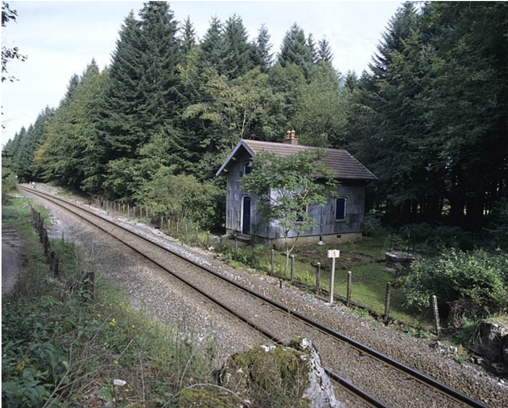
Vue d'ensemble, depuis le sud-ouest.

39, Vers-en-Montagne, lieudit : Forêt domaniale des Grands Bois