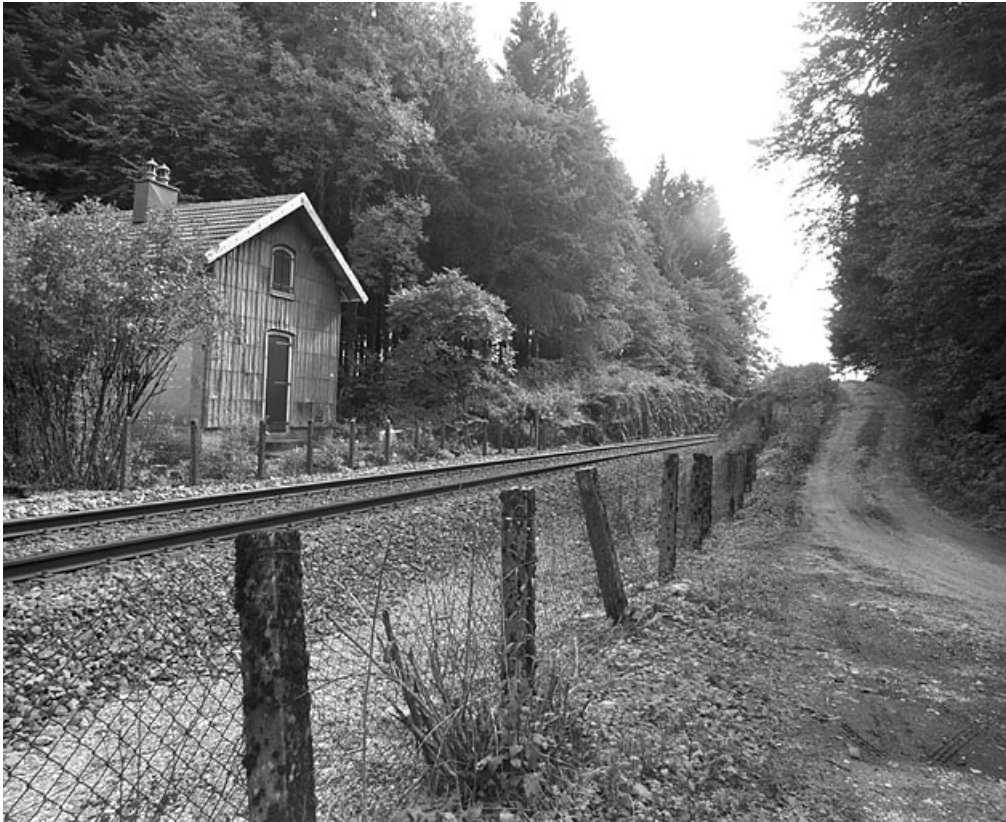
Vue d'ensemble, depuis le nord.

39, Vers-en-Montagne, lieudit : Forêt domaniale des Grands Bois