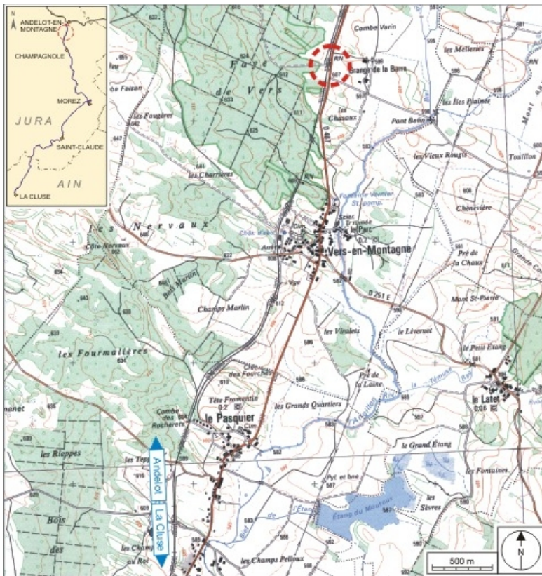
Carte et schéma de localisation. Carte topographique, IGN, 2000, dalle F087_047, échelle 1:25 000. Scan 25, licence n° 2008/CISE/2968.

39, Vers-en-Montagne chemin de la Sommière des Grands Plants, lieudit : Grange de la Barre