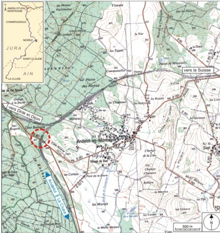
Carte et schéma de localisation. Carte topographique, IGN, 2000, dalle F087_046, échelle 1:25 000. Scan 25, licence n° 2008/CISE/2968.

39, Andelot-en-Montagne R.D. 467, lieu-dit : aux Rondes