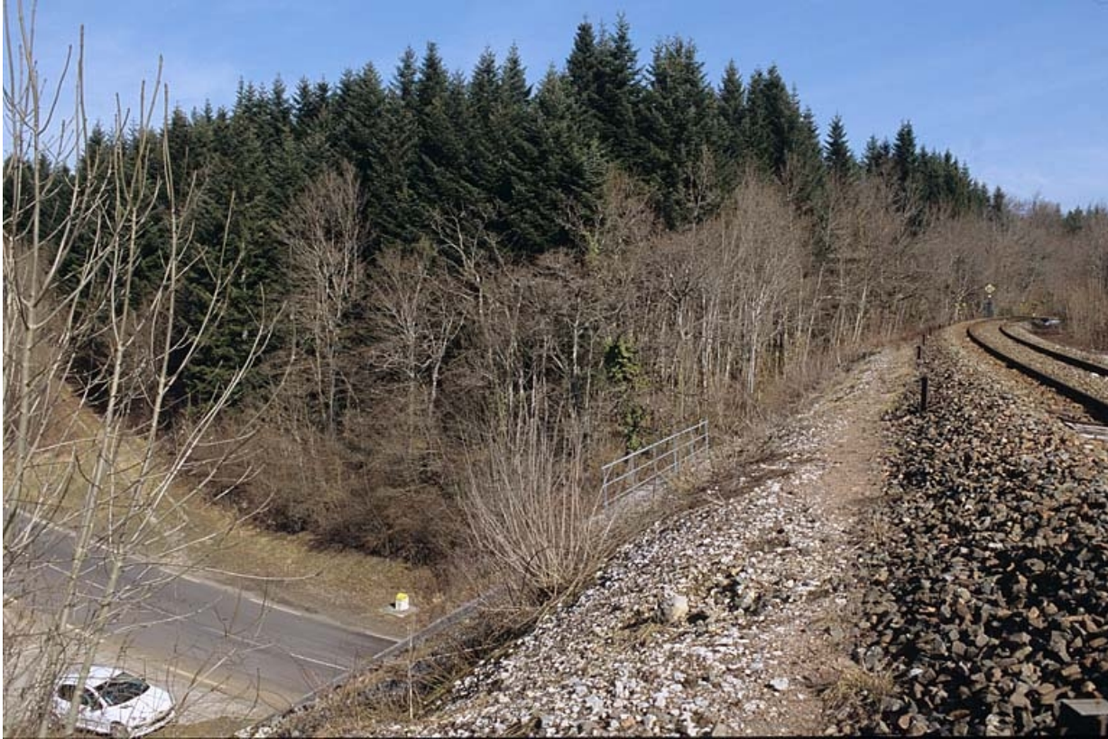
Plate-forme, depuis la voie côté La Cluse.

39, Andelot-en-Montagne R.D. 467, lieudit : aux Rondes