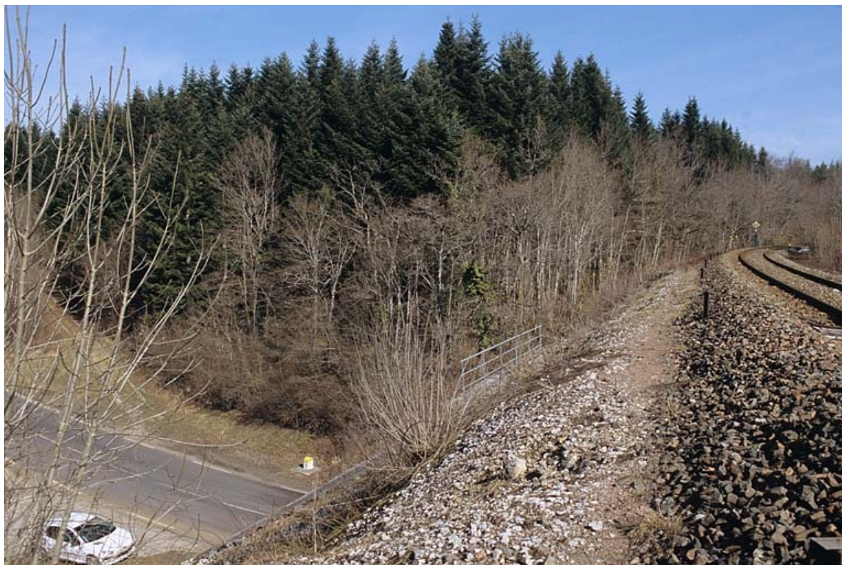
Plate-forme, depuis la voie côté La Cluse.

39, Andelot-en-Montagne R.D. 467, lieudit : aux Rondes