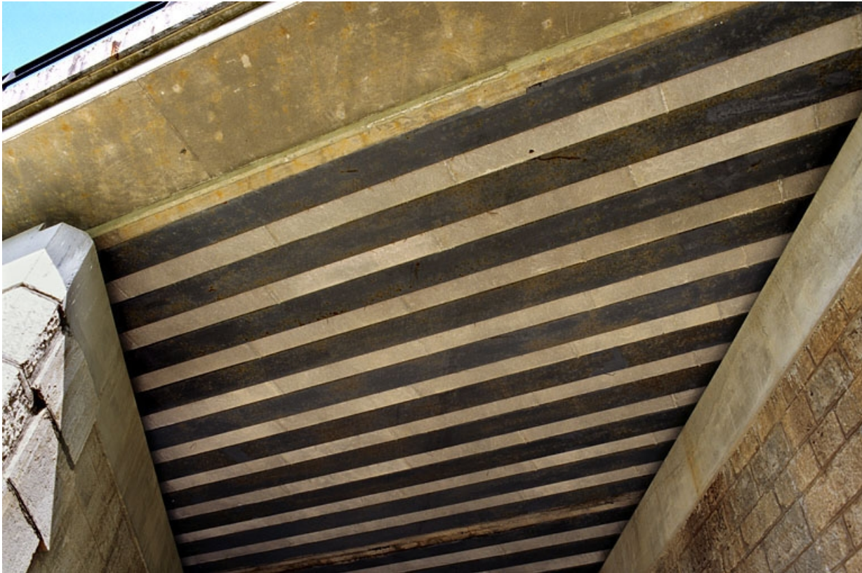
Face inférieure du tablier : poutrelles enrobées.

39, Andelot-en-Montagne, lieudit : les Millières