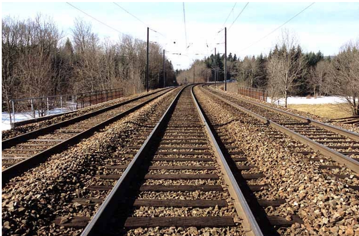
Face supérieure du tablier. La voie de gauche est à destination de La Cluse. 39, Andelot-en-Montagne, lieudit : les Millières