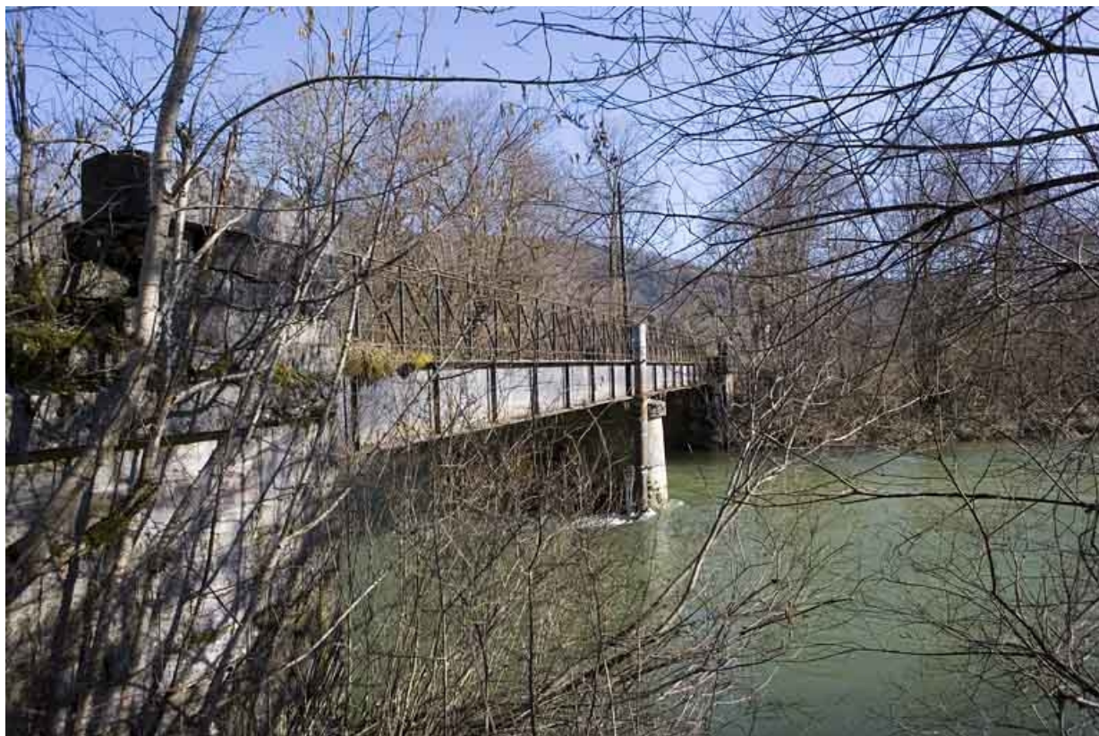
Vue en enfilade, depuis la rive gauche en amont.

39, Syam chemin de la Gare, lieudit : les Forges