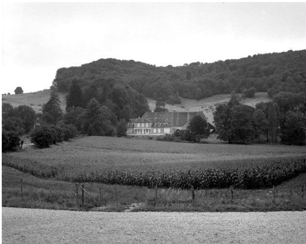
Vue de situation.