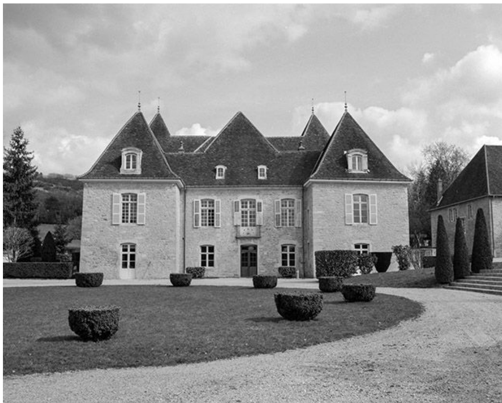
Corps du logis principal, façade antérieure.