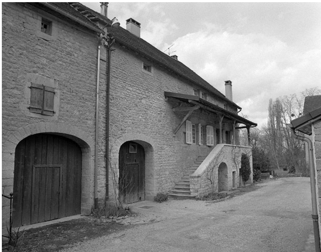
Façade antérieure vue de trois quarts gauche. 39, Gevingey