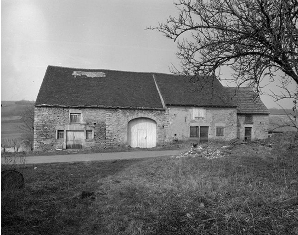
Façade antérieure, vue de face.