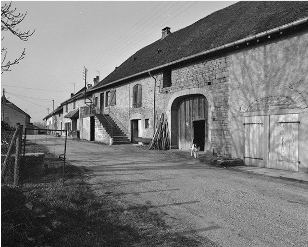
Façade antérieure, vue de trois quarts.