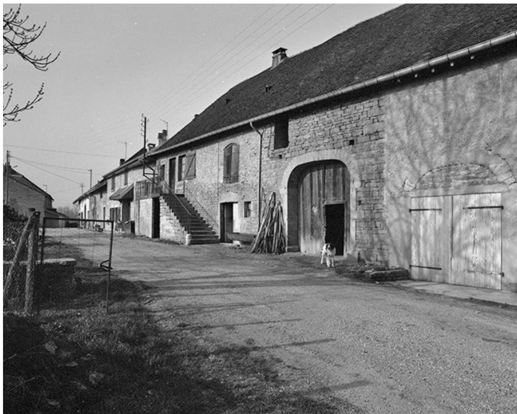
Façade antérieure, vue de trois quarts.