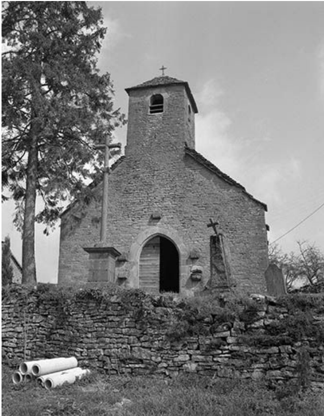
Machine Barker, vue de face.