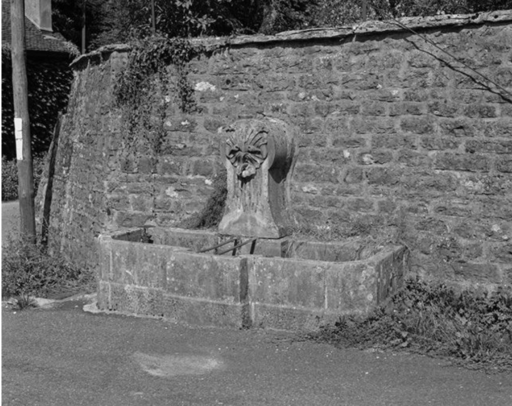
Fontaine située rue des Vignettes.