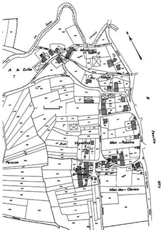
Cadastre : 1980 A (2e feuille).