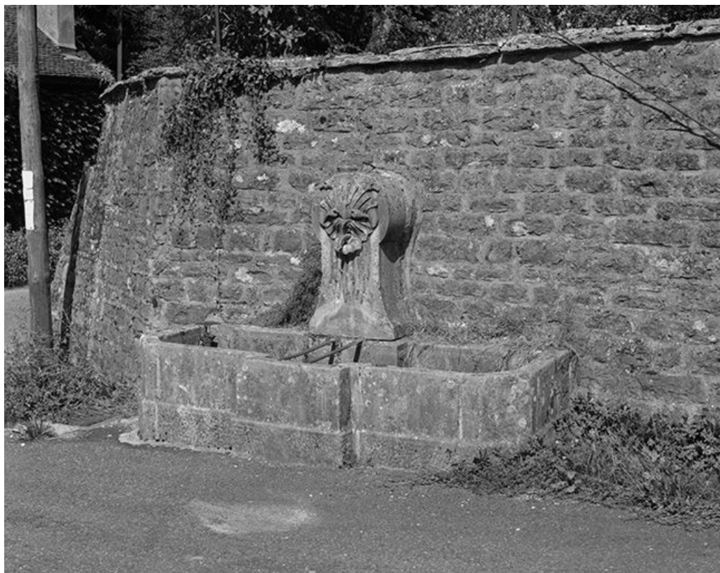
Fontaine située rue des Vignettes.