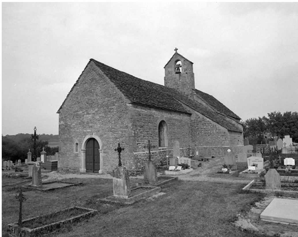
Façade antérieure et face droite.