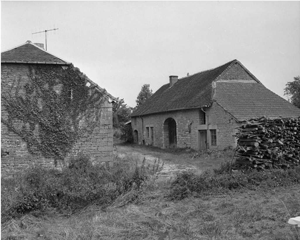
Cadastre 1980, section B1, 1ère feuille, parcelle 151.