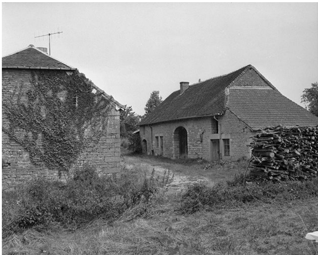
Cadastre 1980, section B1, 1ère feuille, parcelle 151.