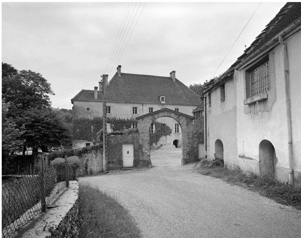
Le portail et le logis vus depuis la rue.