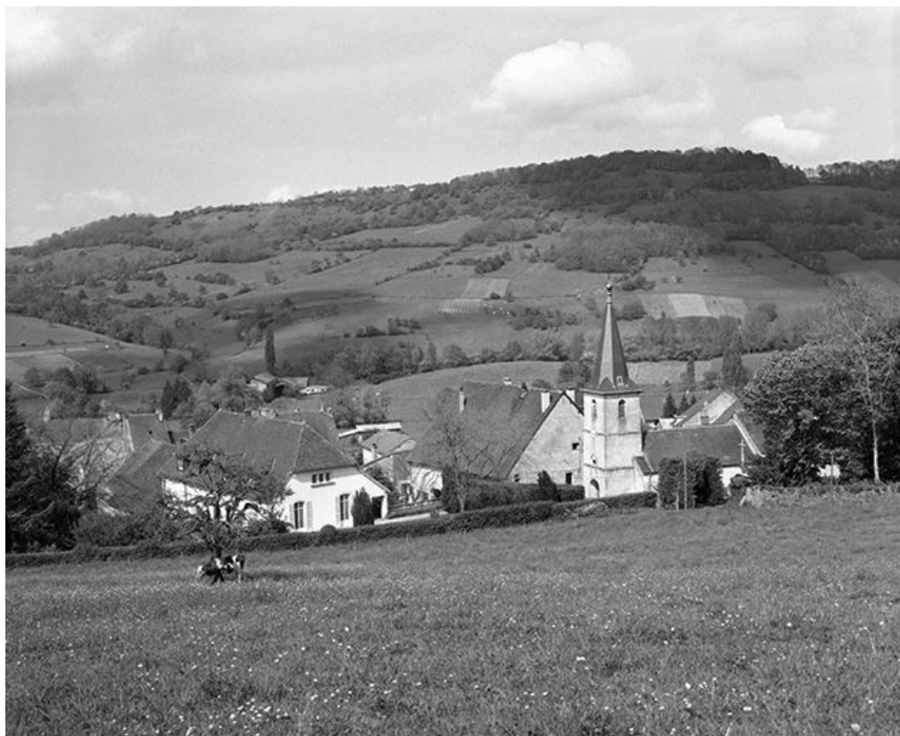
Vue de situation.