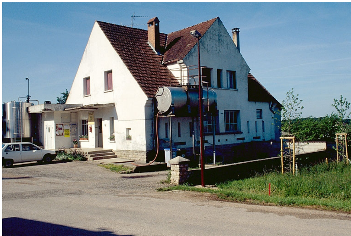
Vue d'ensemble depuis le nord-ouest.