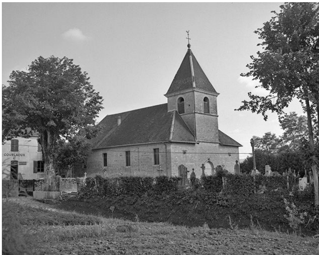
Extérieur : façade antérieure et face gauche.