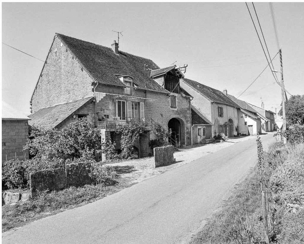
Vue générale de trois quarts.