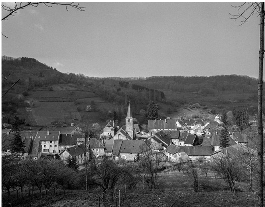
Vue générale du village depuis l'est.