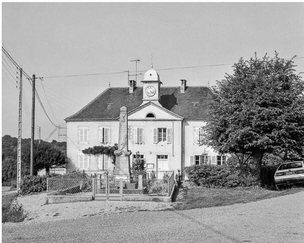
Façade antérieure vue de face.