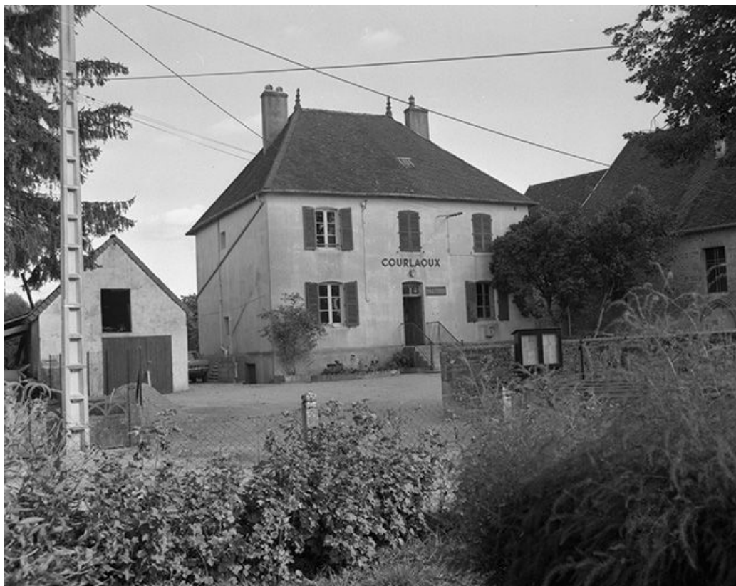
Mairie située rue des Ecoles, à côté de l'église : façade antérieure. 39, Courlaoux