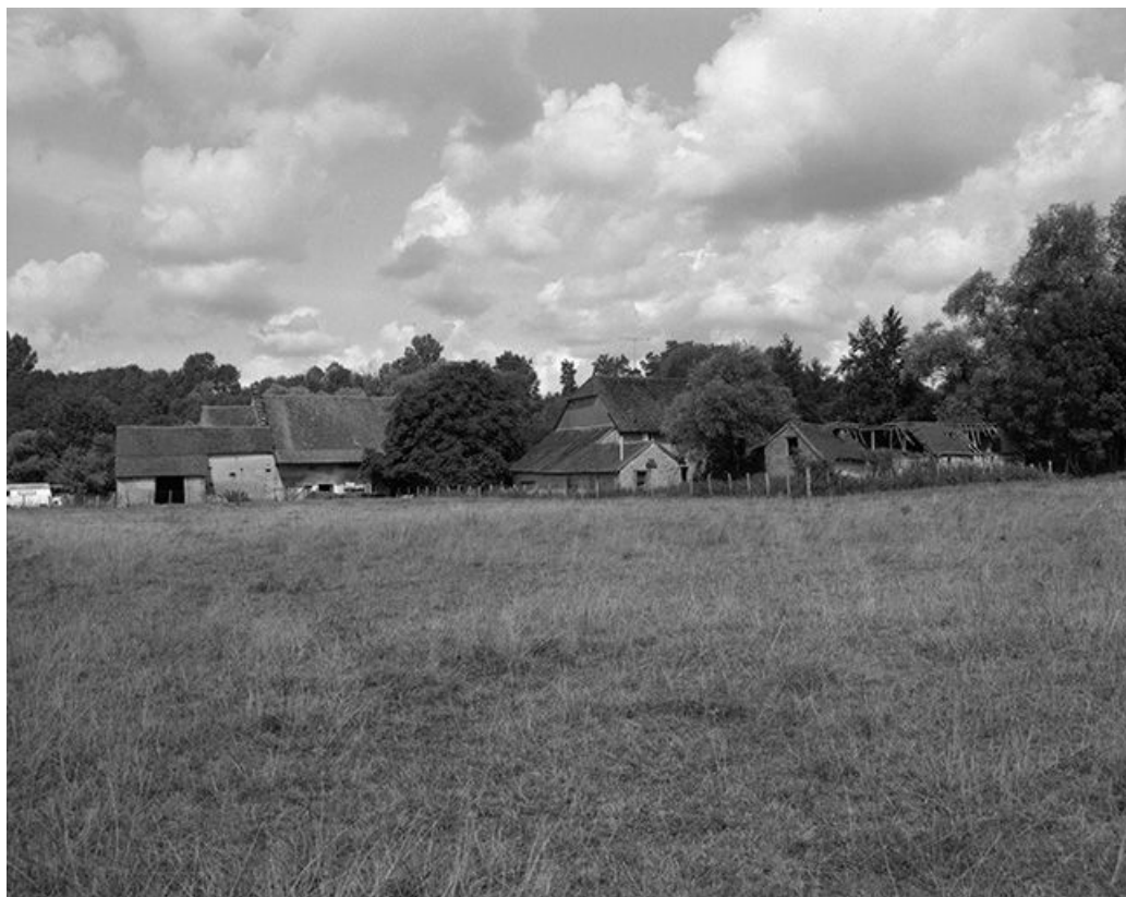
Vue de situation.