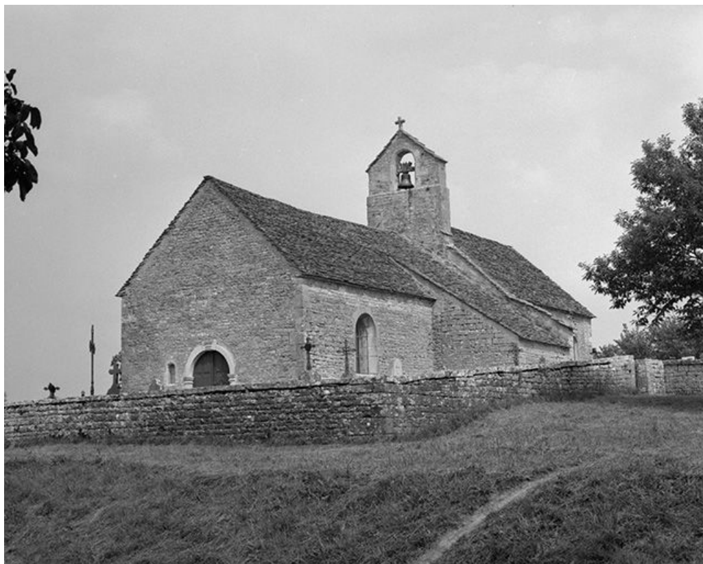
Façade antérieure et face droite.