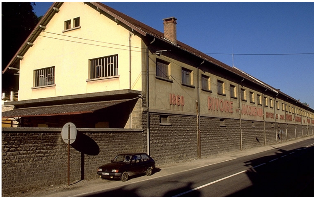
Pièce d'affinage (1953).