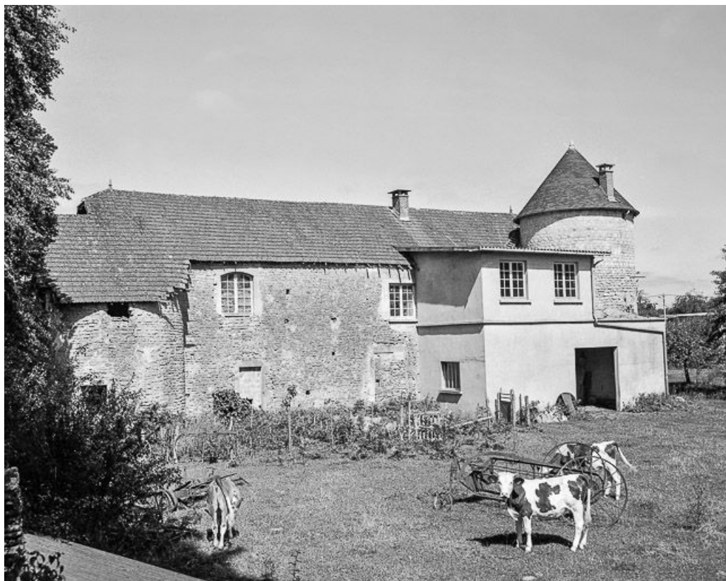
Ferme dite château située au lieudit Beyne : vue d'ensemble.