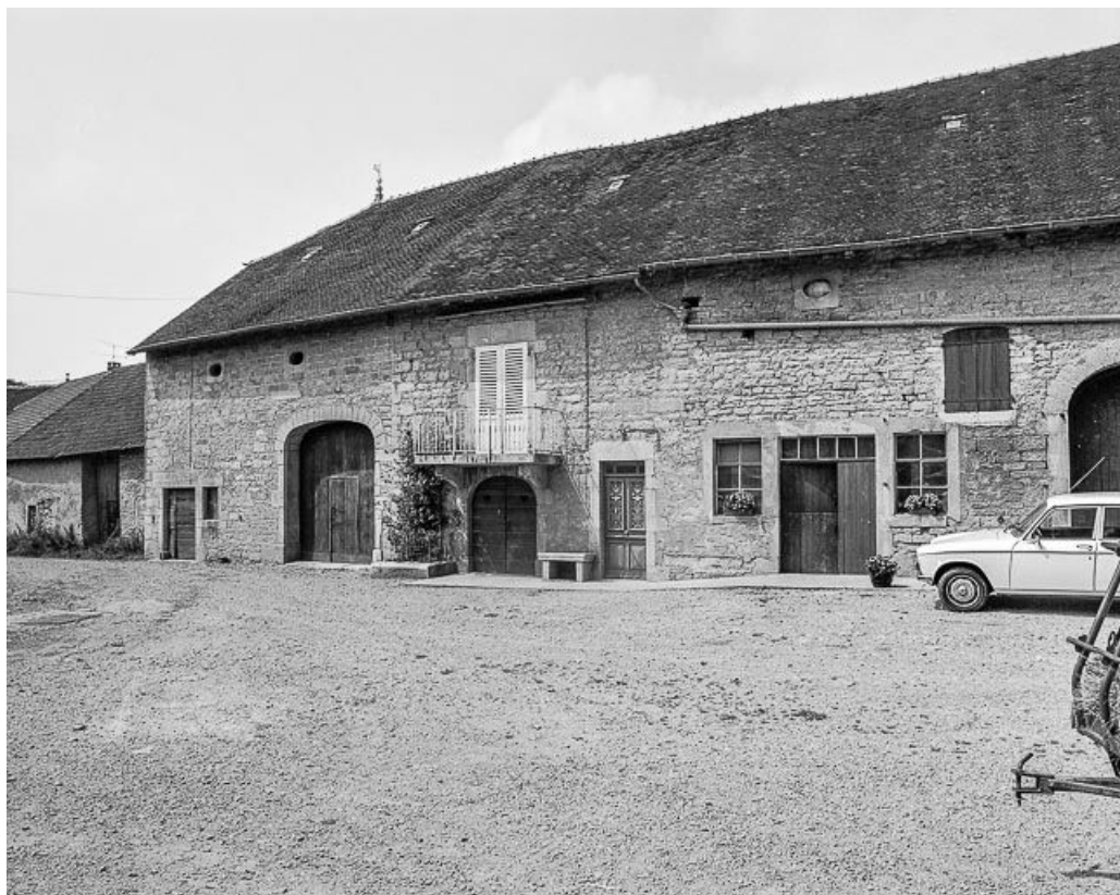
Vue de trois quarts droit.