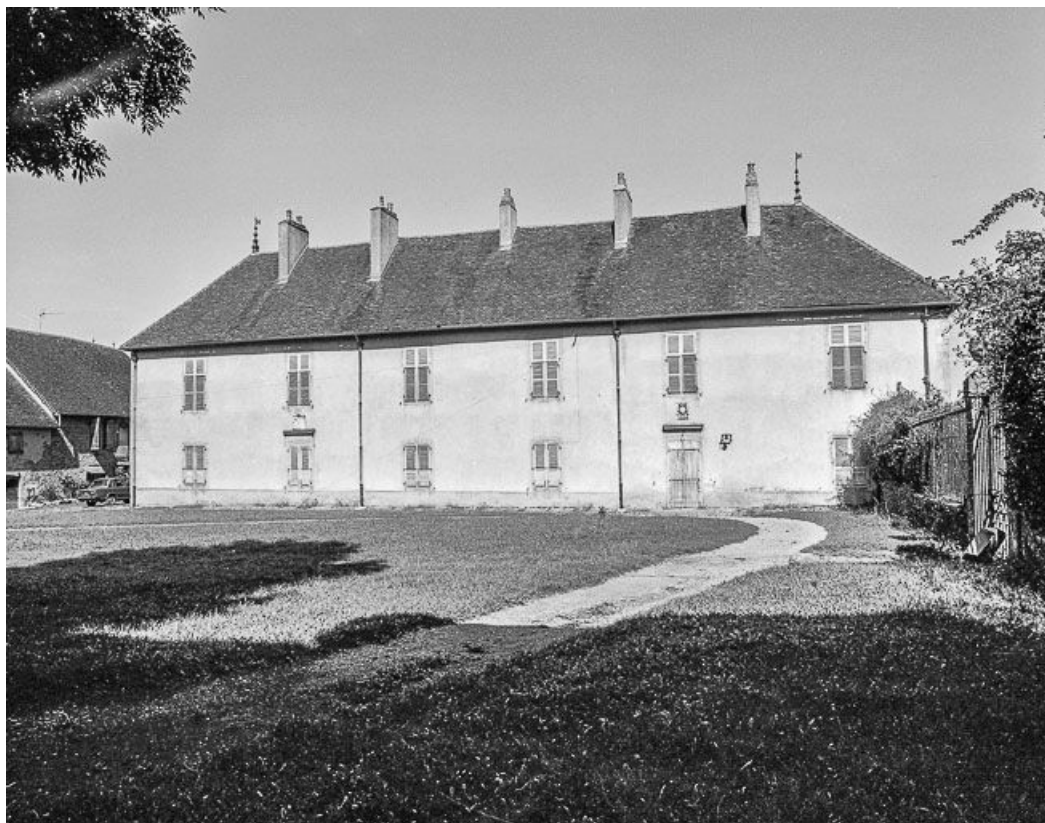
Vue du logis.