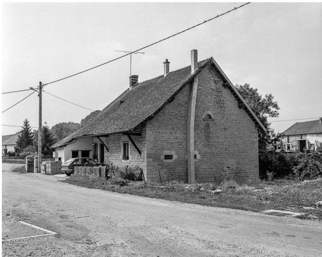
Vue de trois quarts droit.