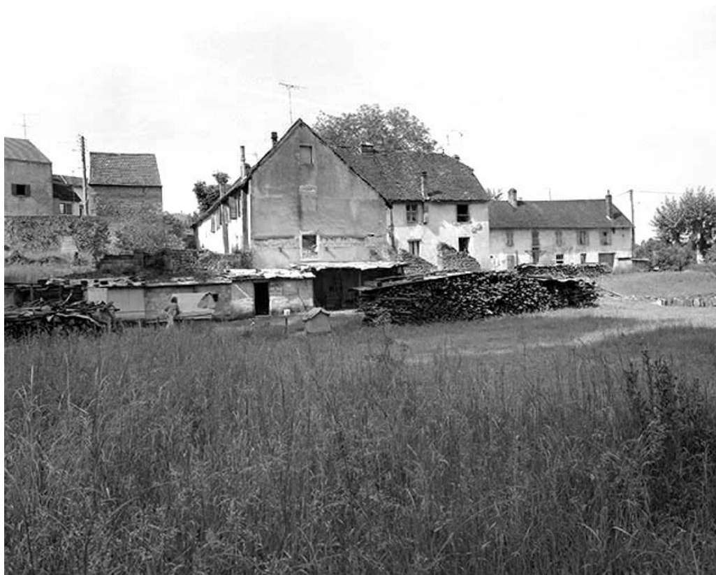
Vue d'ensemble depuis le nord-ouest.