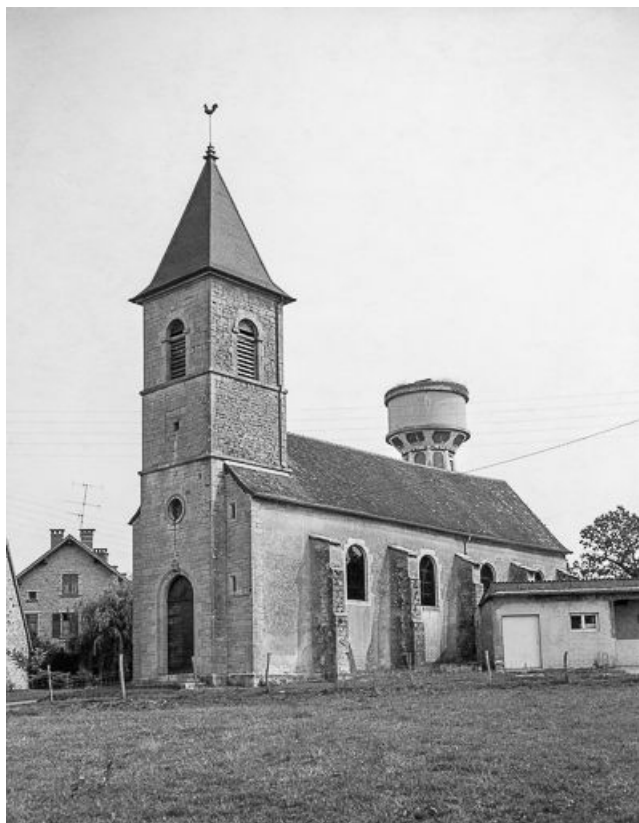
Façade antérieure et face droite.