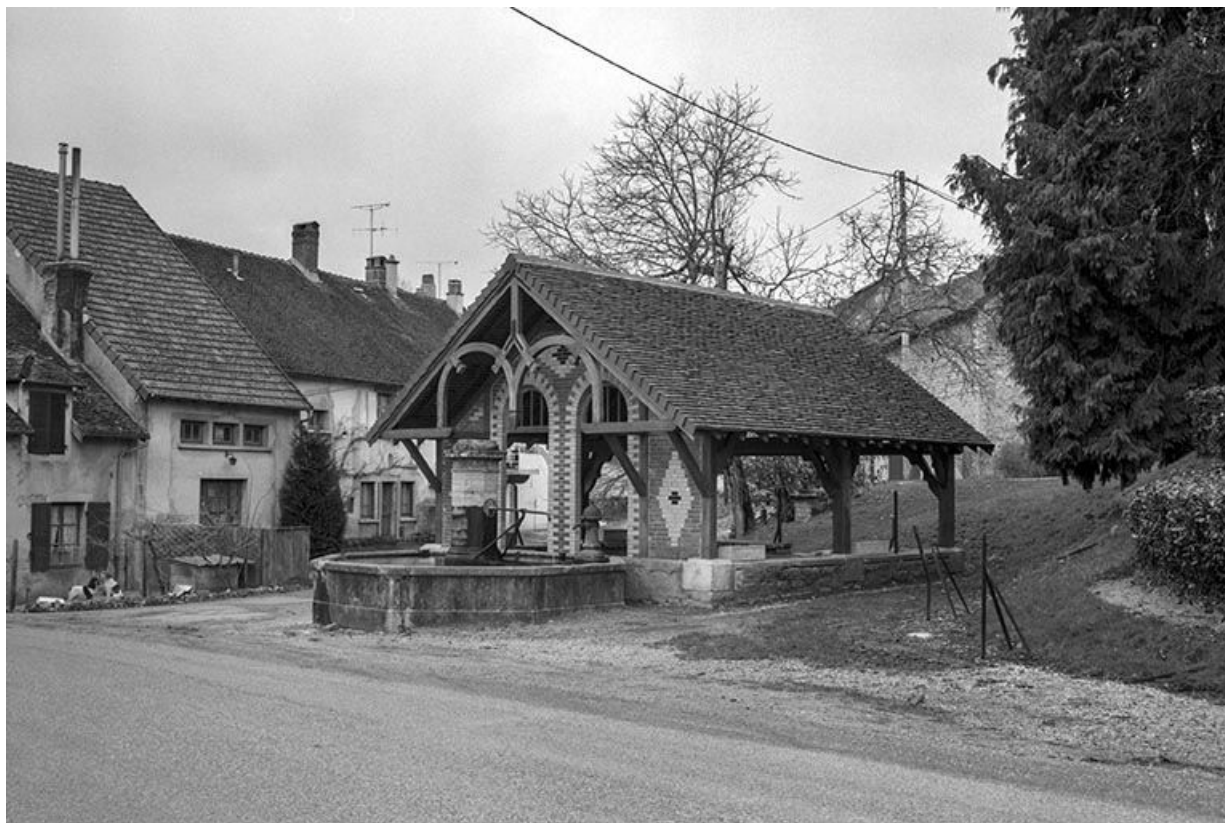
Vue de trois quarts.