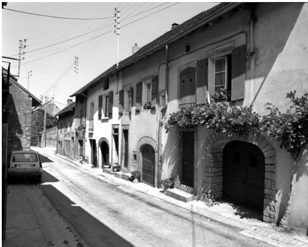
Façade antérieure vue de trois quarts droit.