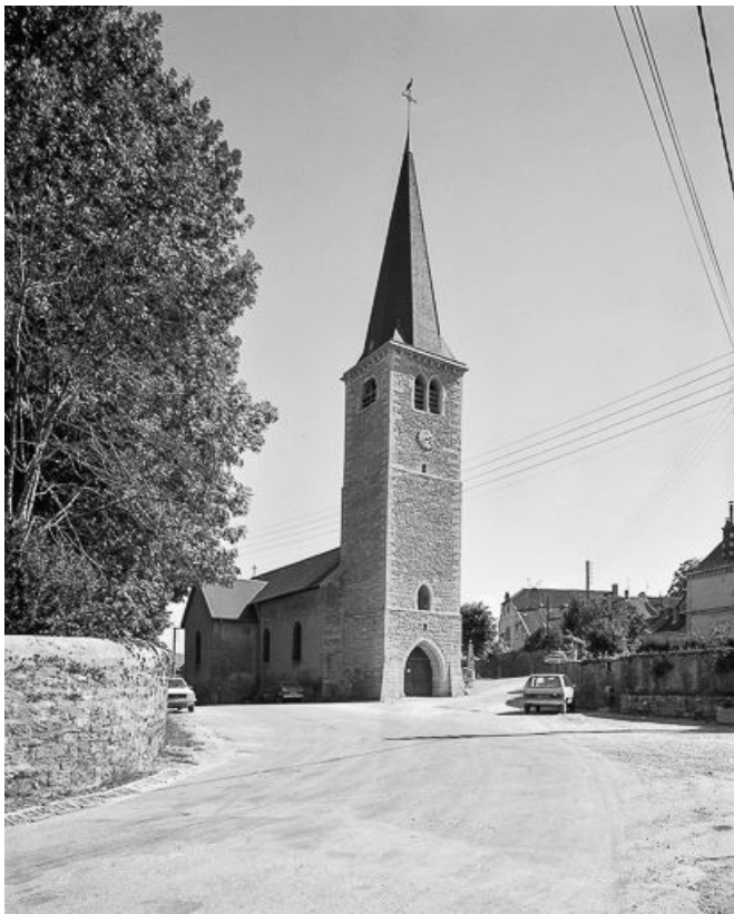
Façades antérieure et latérale gauche.