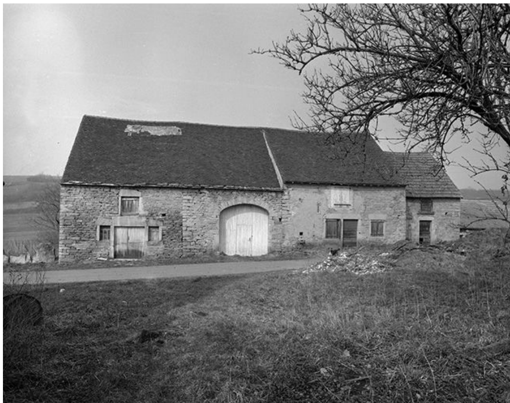
Façade antérieure, vue de face.