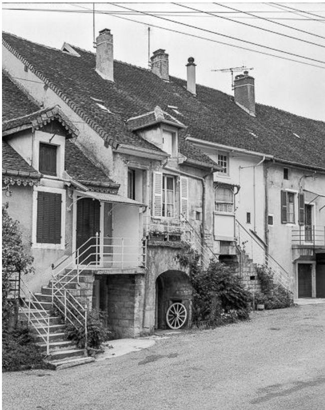
Façade antérieure vue de trois quarts gauche.