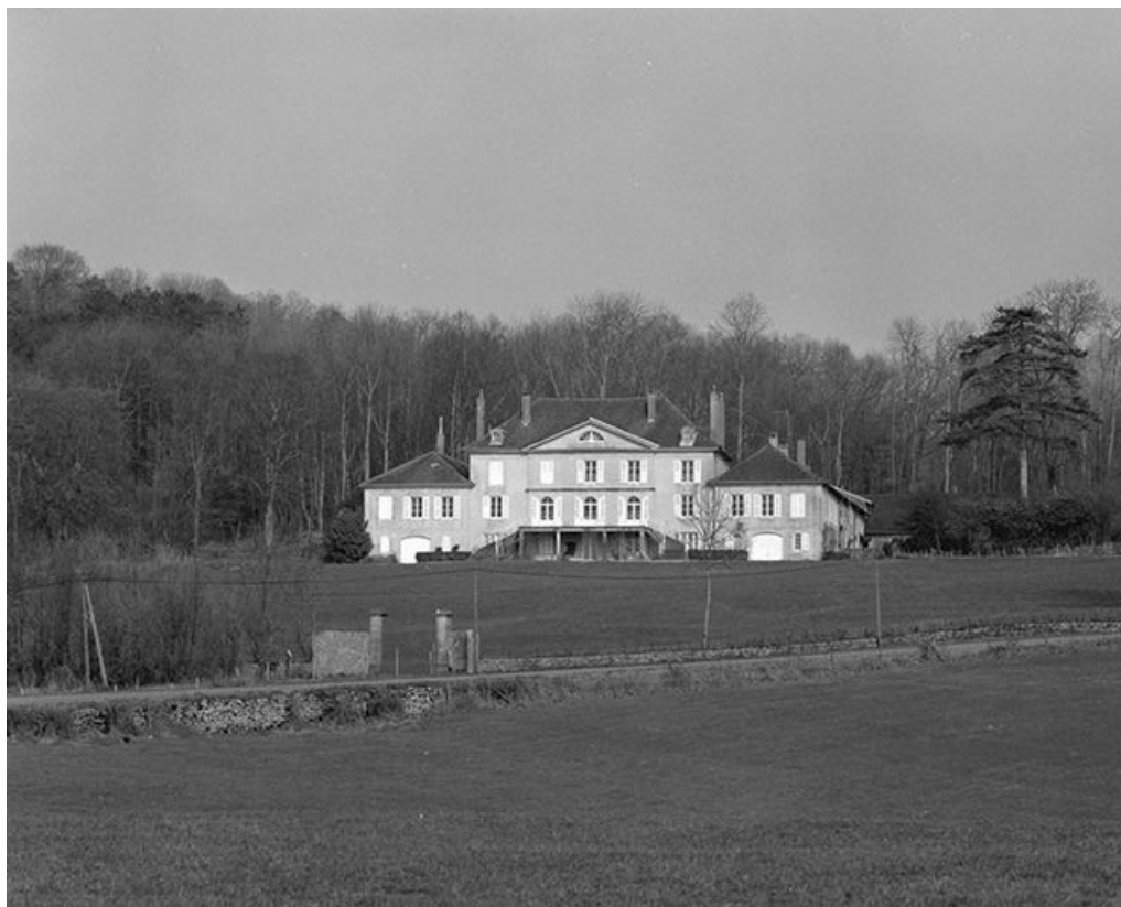
Vue de situation.