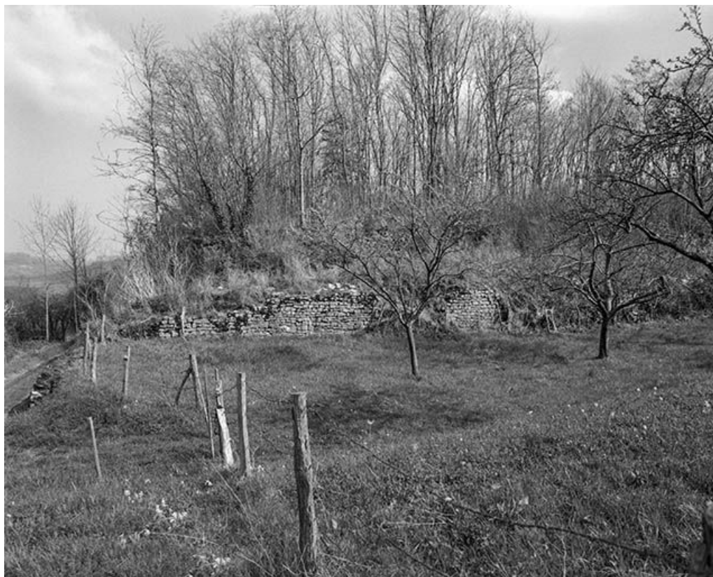
Vue des vestiges depuis le sud.