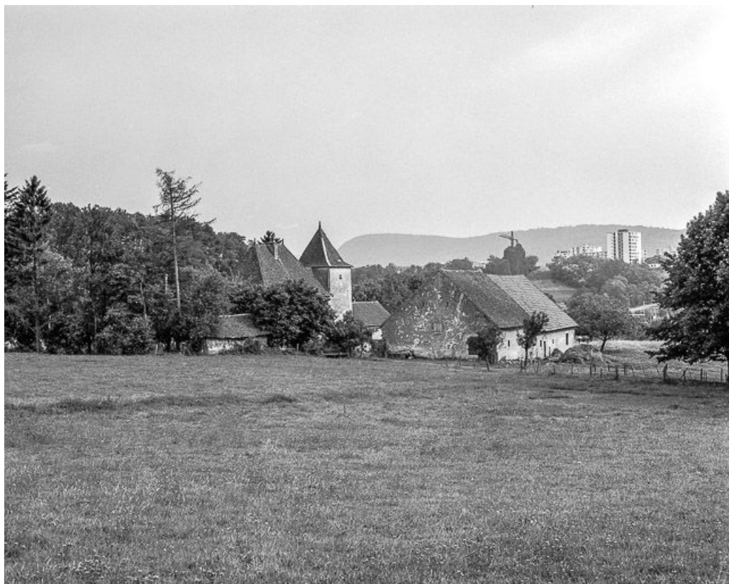
Vue de situation.