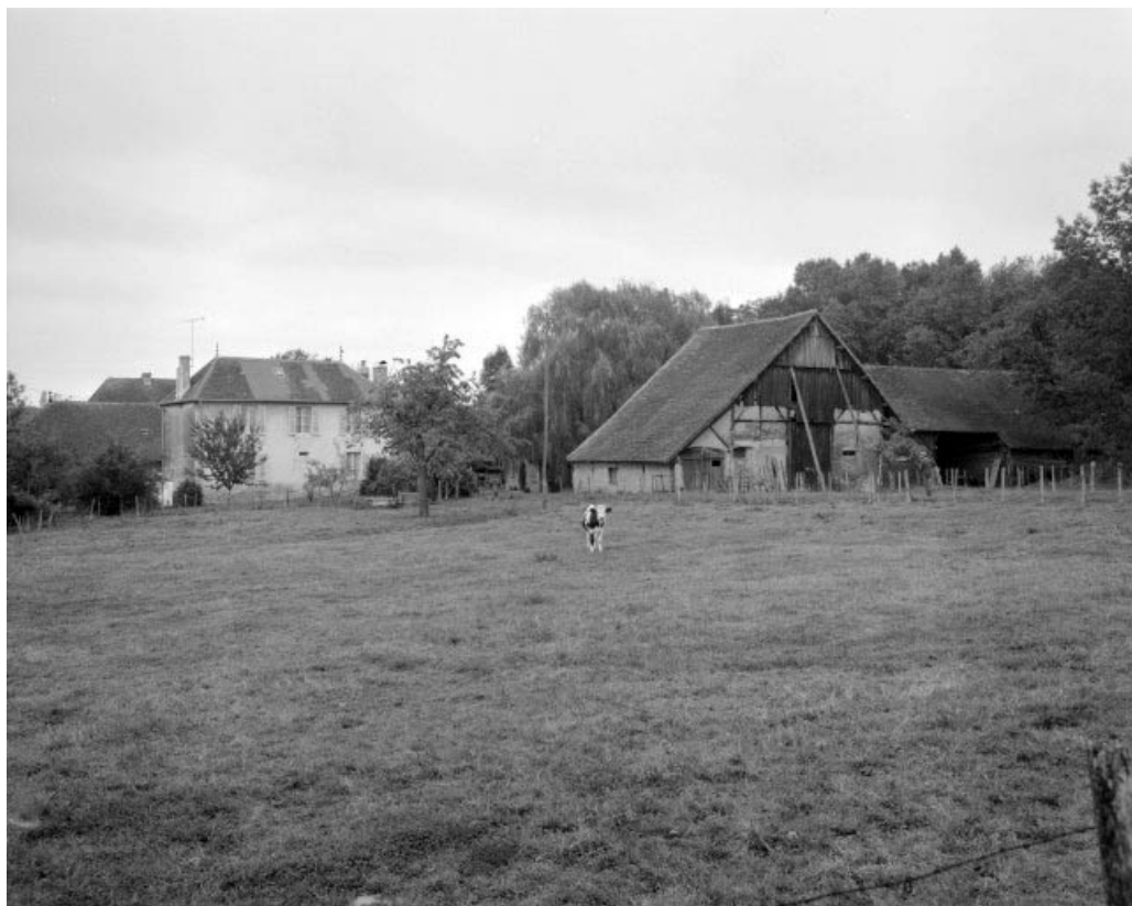
Vue d'ensemble depuis le sud-est.