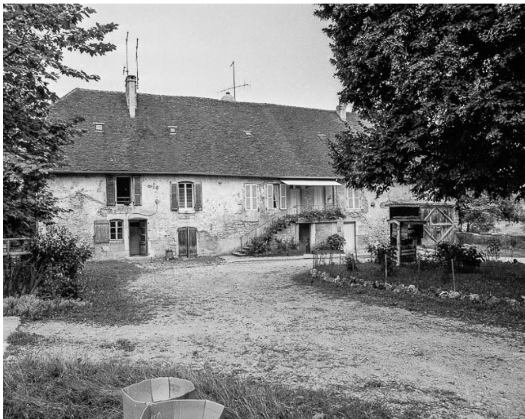
Moulin : façade antérieure.