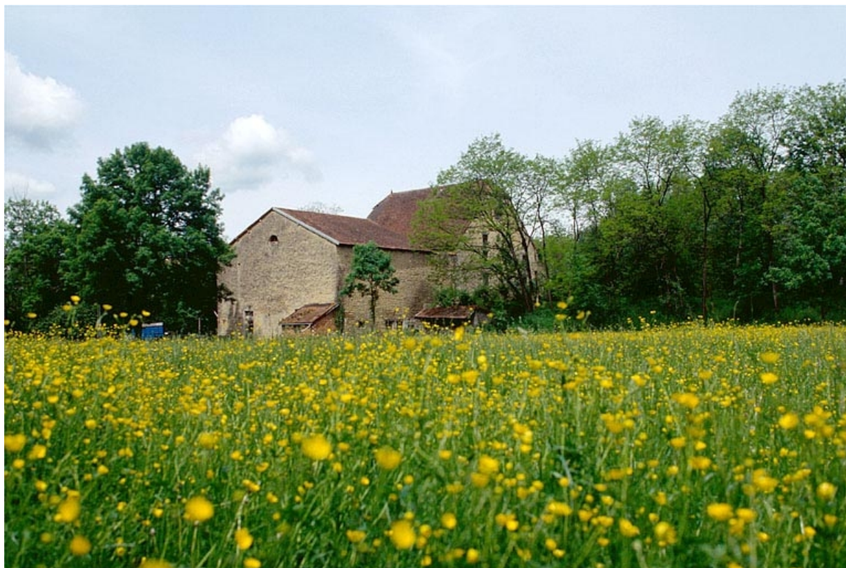
Vue d'ensemble depuis le sud-est.