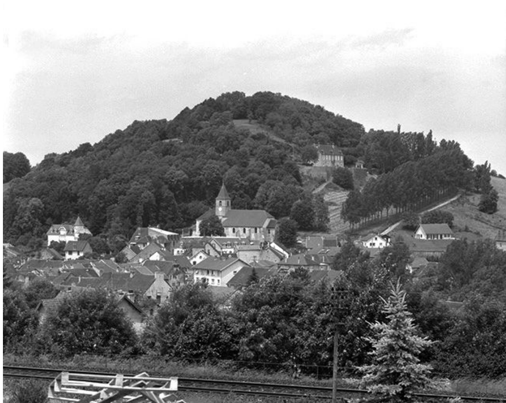
Vue générale de la colline du château-fort.