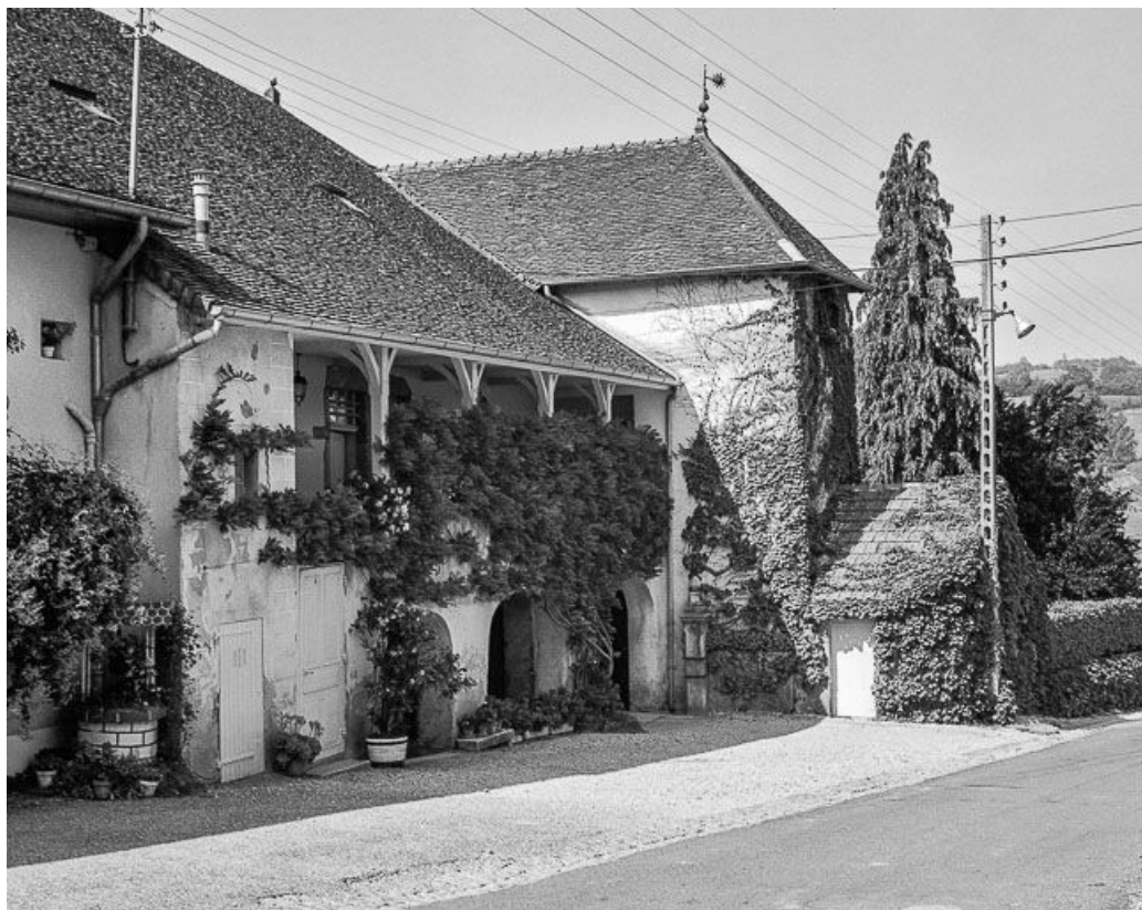
Façade antérieure vue de trois quarts gauche.