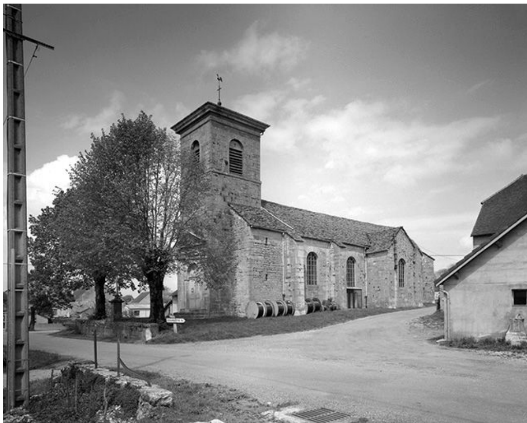
Vue de trois quarts droit.