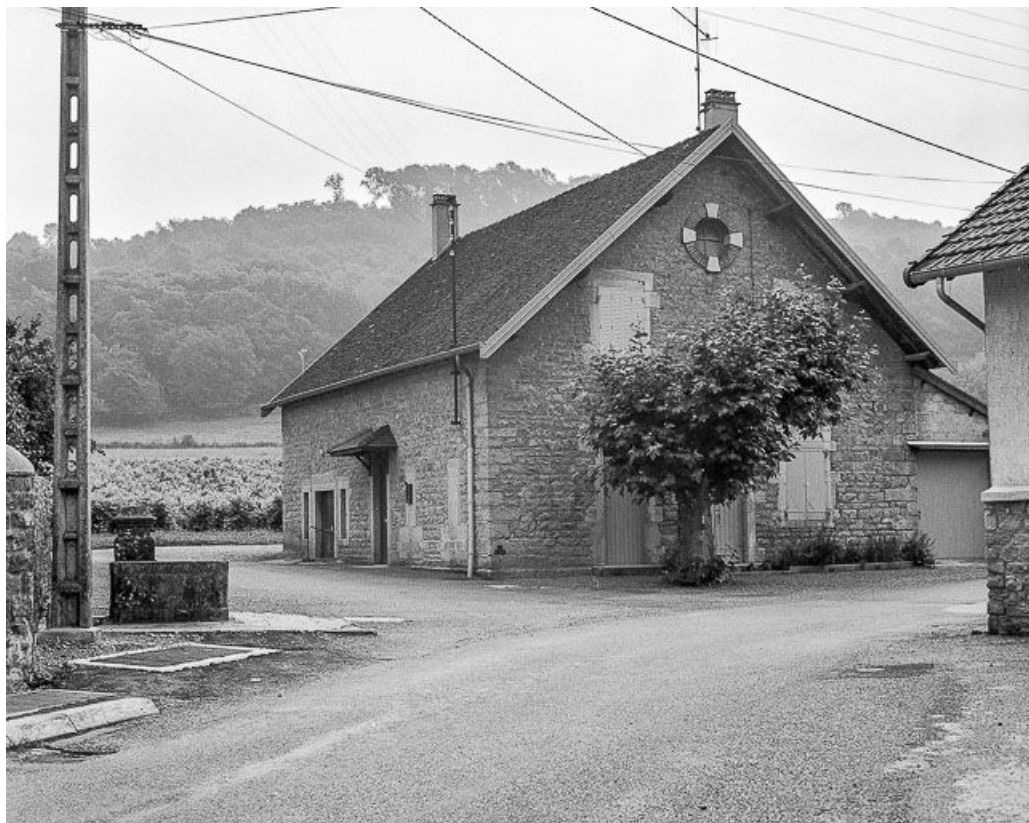
Façades latérales antérieure et droite.