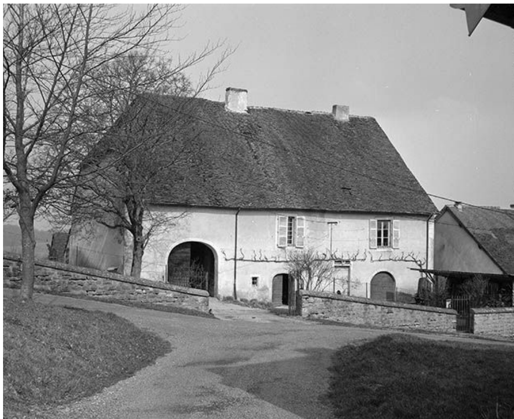
Façade antérieure, vue de face.