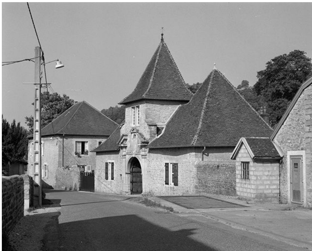
Pavillon d'entrée, élévation sur la rue.