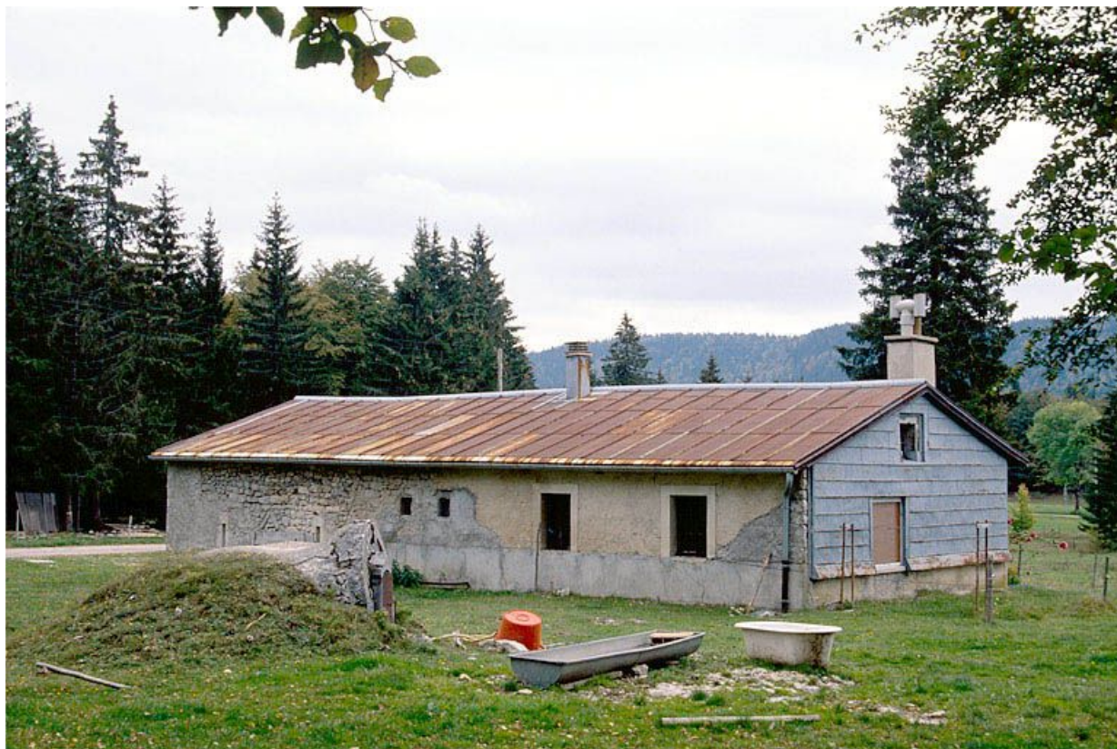
Vue générale de la fromagerie de la Chaux Mourant, à Bellefontaine.