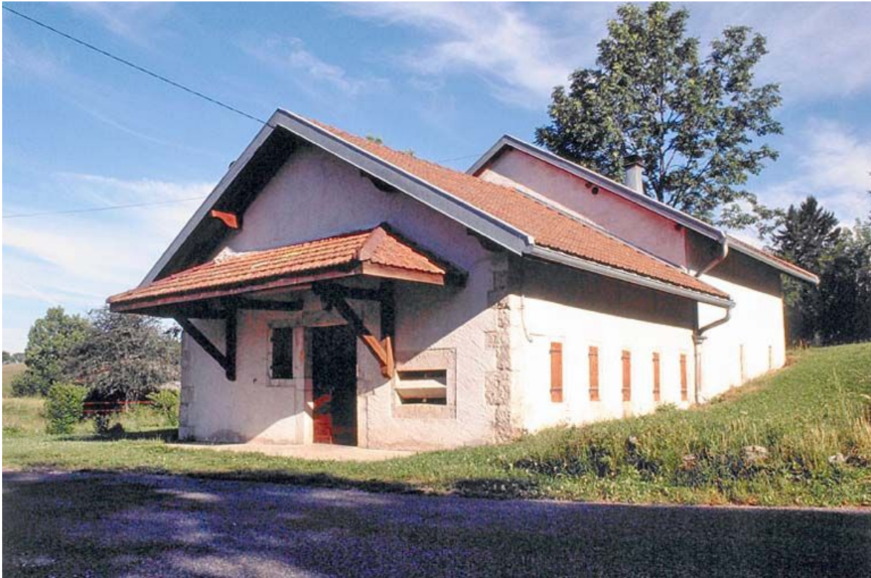
Façade antérieure de la fromagerie du hameau des Communailles, à Longchaumois, vue de trois quarts.