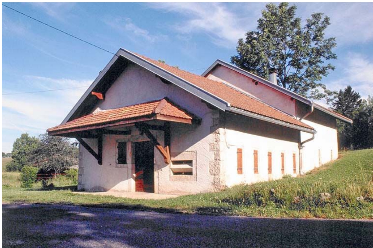
Façade antérieure de la fromagerie du hameau des Communailles, à Longchaumois, vue de trois quarts.