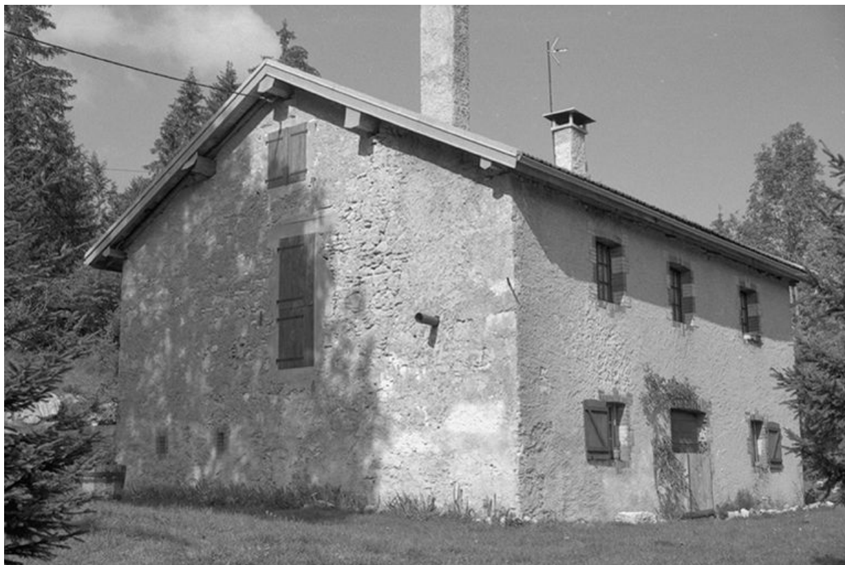
Vue générale de la fromagerie de la Combe Servagnat, à Longchaumois.