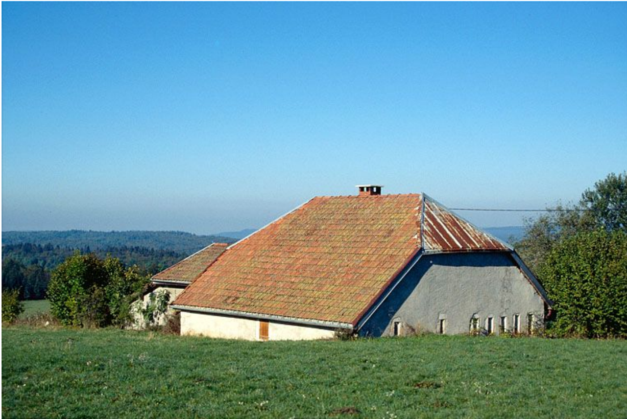
Vue générale de la fromagerie des Raisses, à Longchaumois.