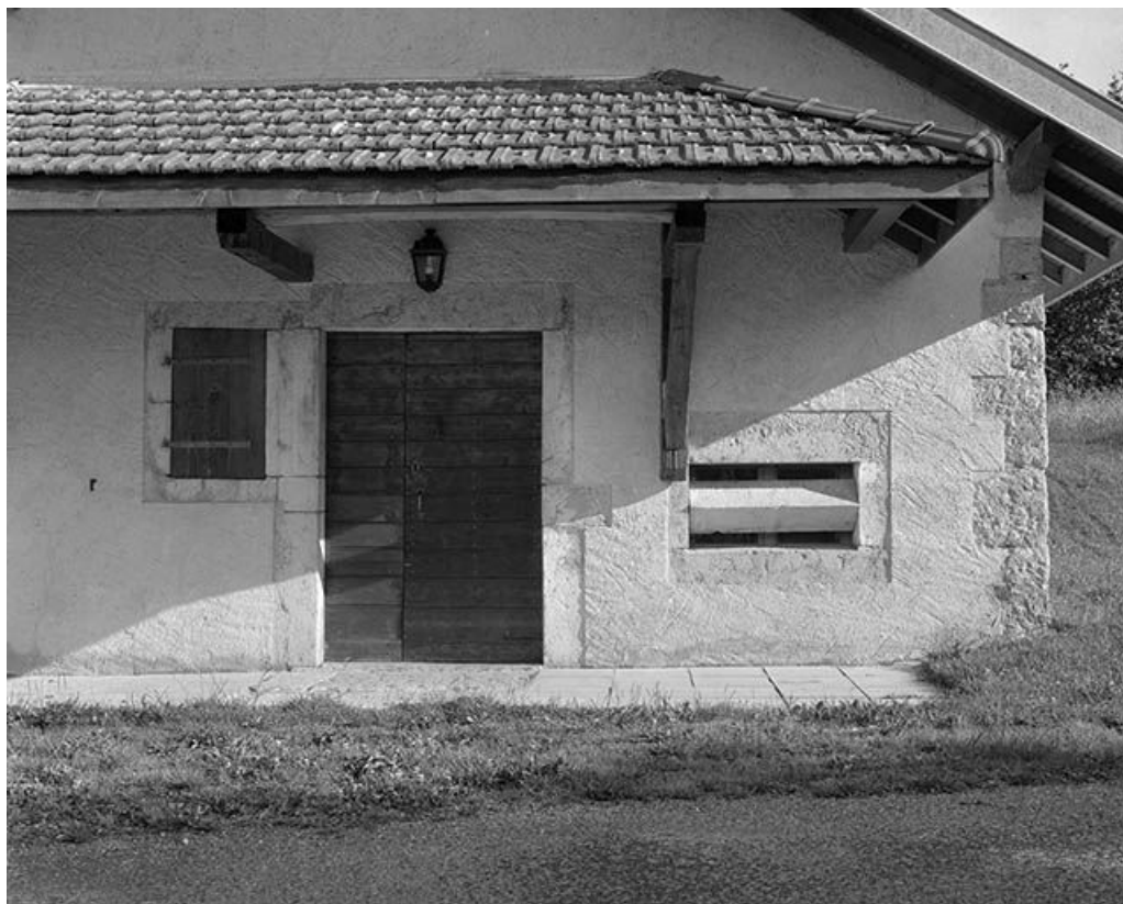
Porte d'entrée et baie fromagère de la fromagerie des Communailles, à Longchaumois.