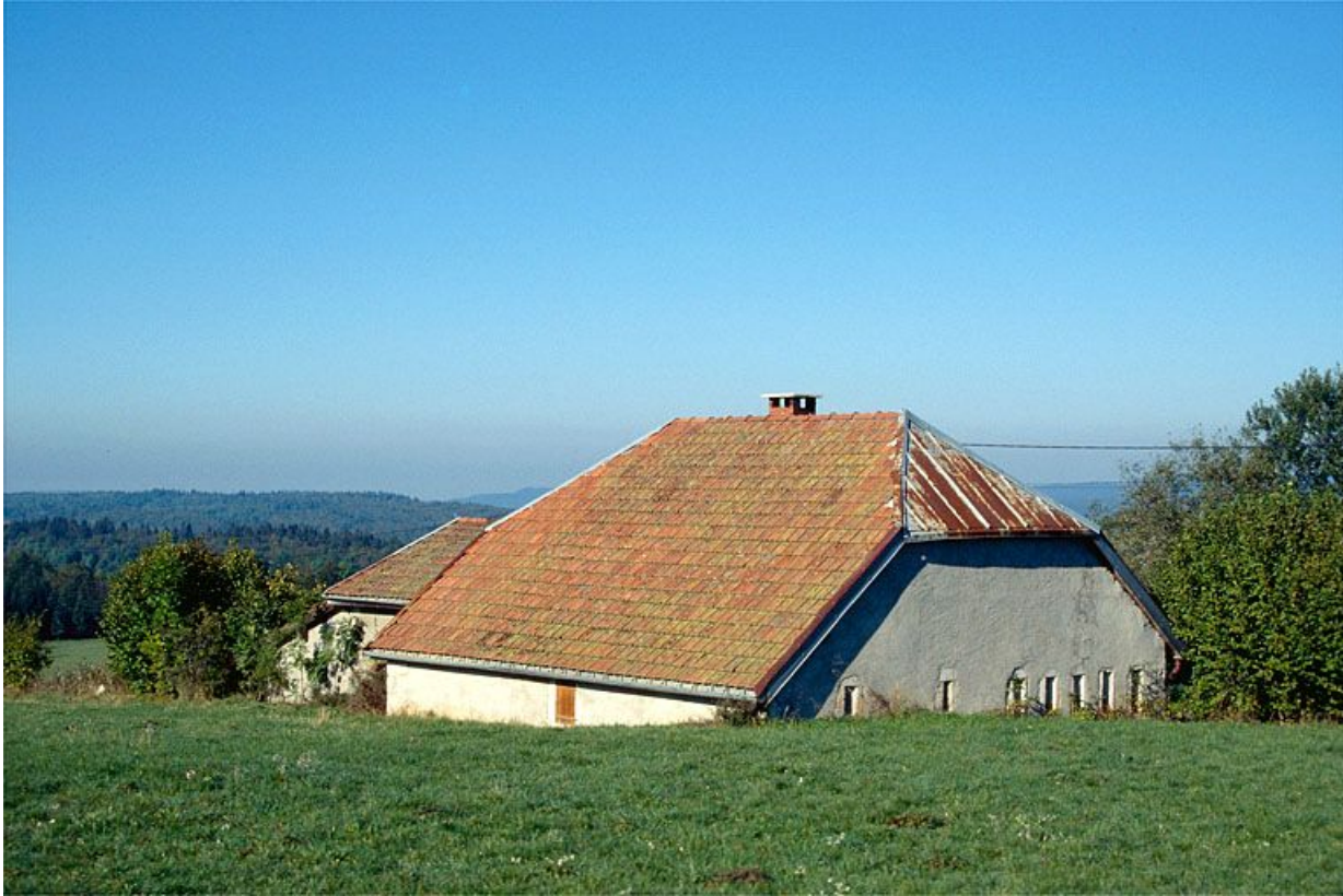
Vue générale de la fromagerie des Raisses, à Longchaumois.