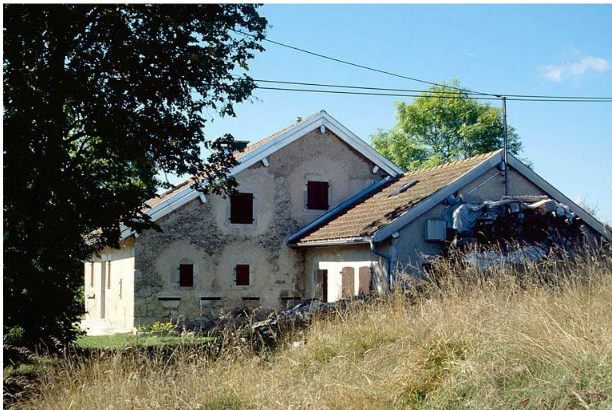
Vue générale de la fromagerie d'Orcières, à Longchaumois.