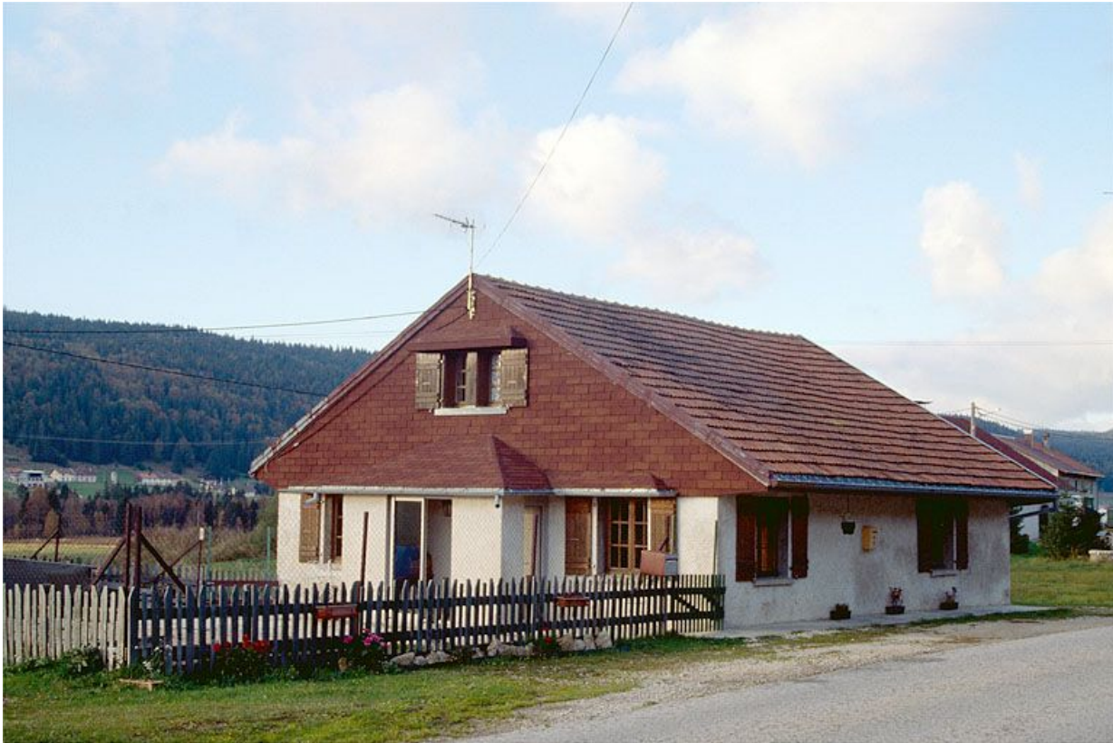
Vue générale de la fromagerie de la Bourbe, commune des Rousses.