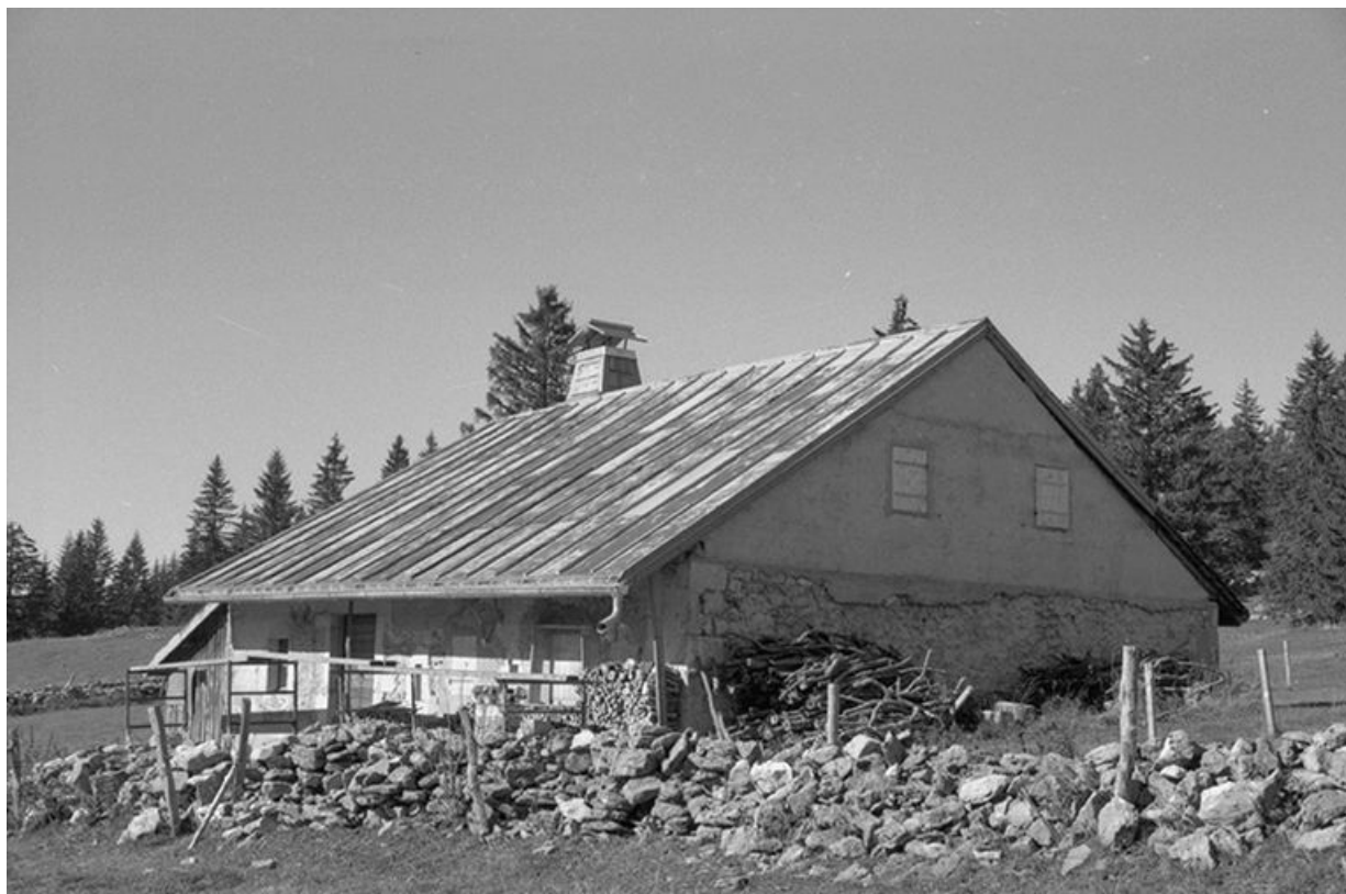
Façade antérieure de la fromagerie des Loges, à Bois-d'Amont.