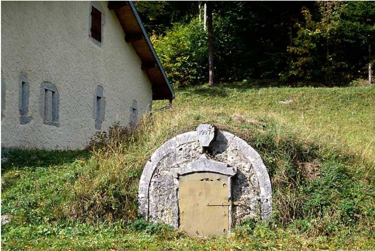
Citerne de la fromagerie des Mandrillons, à Bellefontaine, datée 1907.