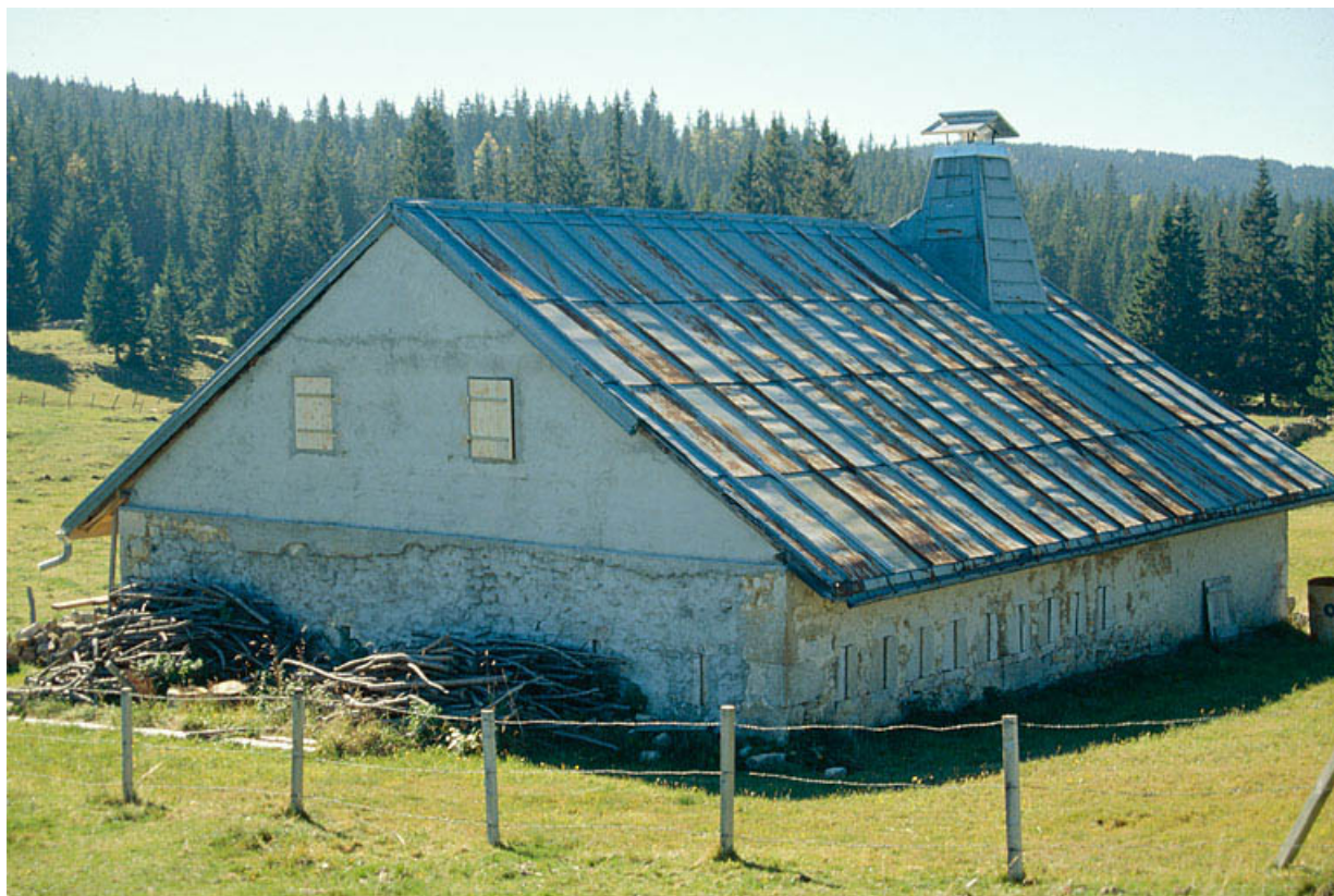
Vue générale de la fromagerie des Loges, à Bois-d'Amont.