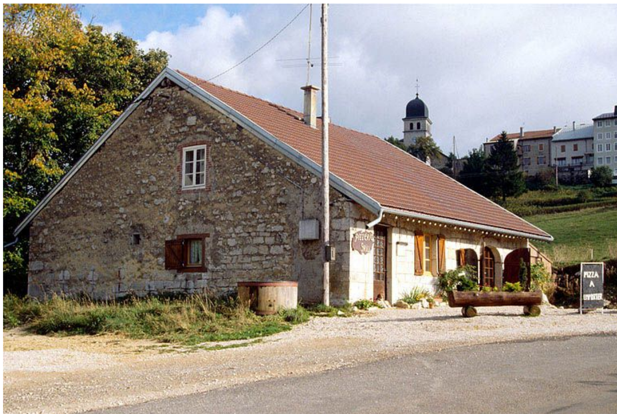
Vue générale de la fromagerie des Rousses en Bas.