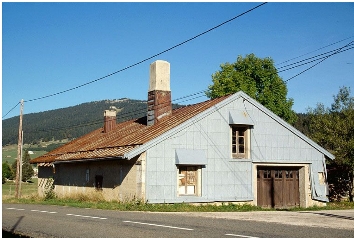
Vue générale de la fromagerie des Landes d'Aval, aux Rousses.