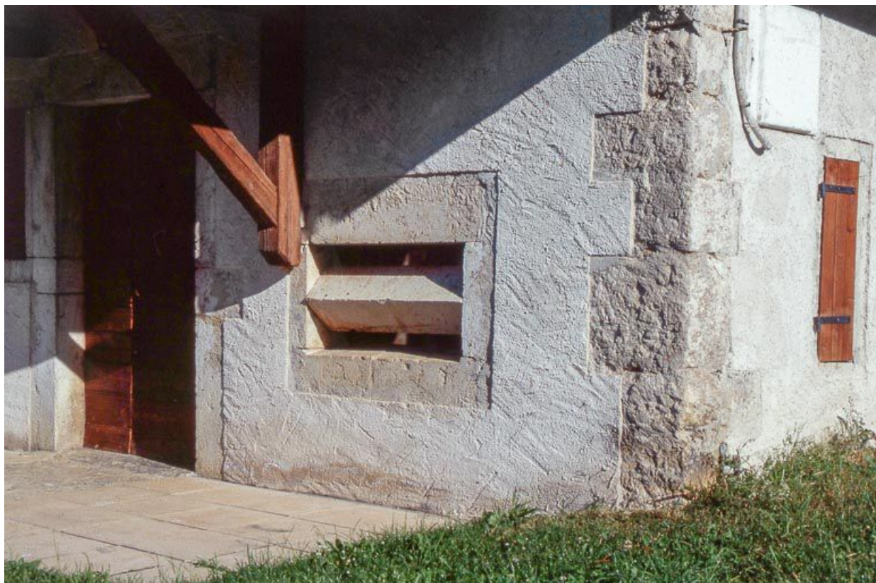
Baie fromagère de la fromagerie des Communailles, à Longchaumois.