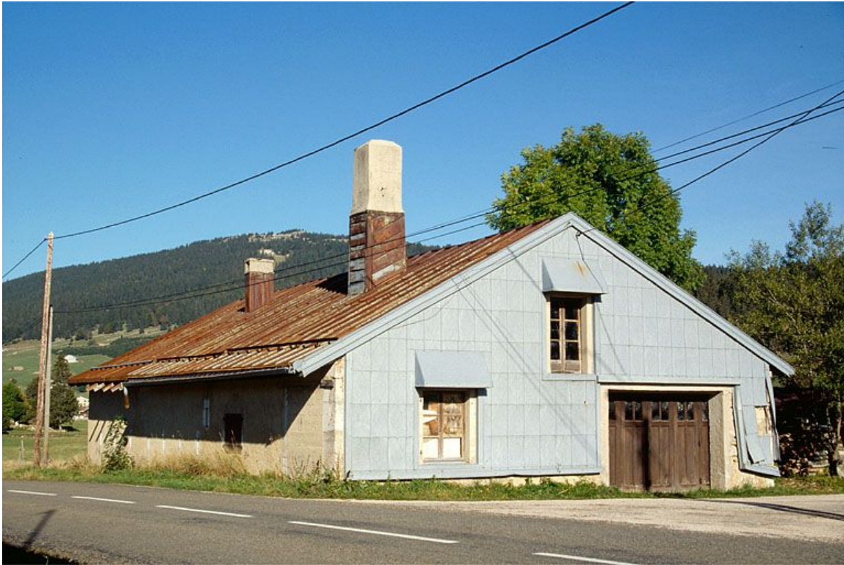
Vue générale de la fromagerie des Landes d'Aval, aux Rousses.