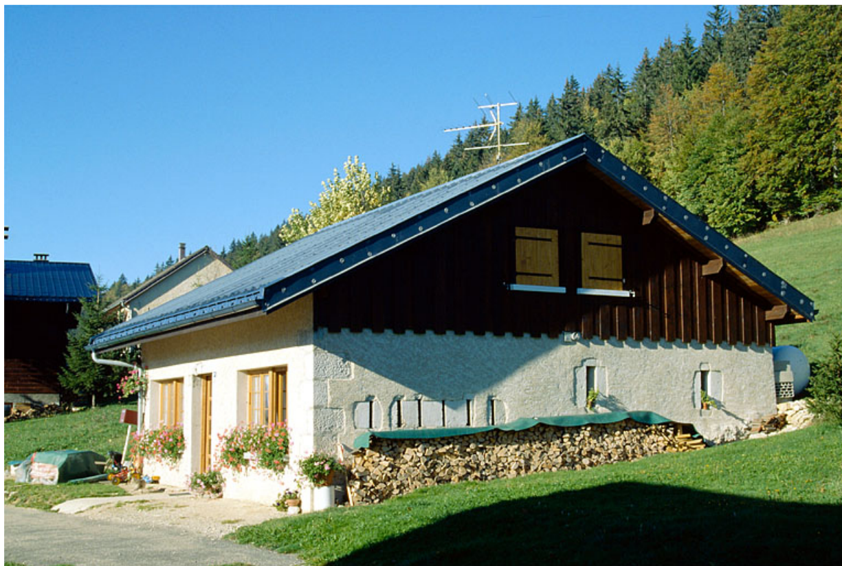
Vue générale de la fromagerie des Meuniers, à Bois-d'Amont.