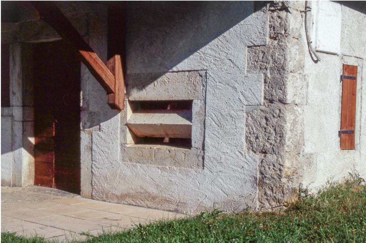
Baie fromagère de la fromagerie des Communailles, à Longchaumois.