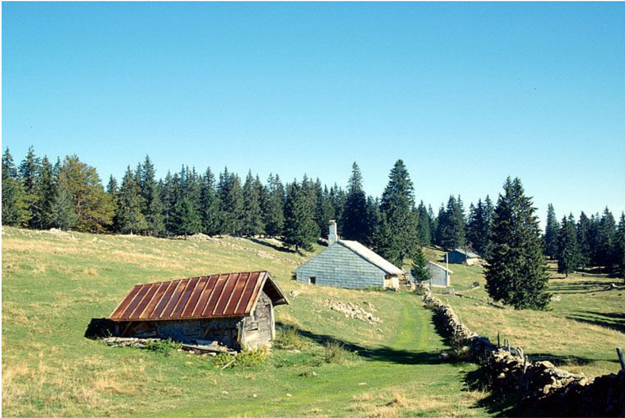
Vue de situation de la fromagerie des Petits Plats du Haut, à Bois-d'Amont.