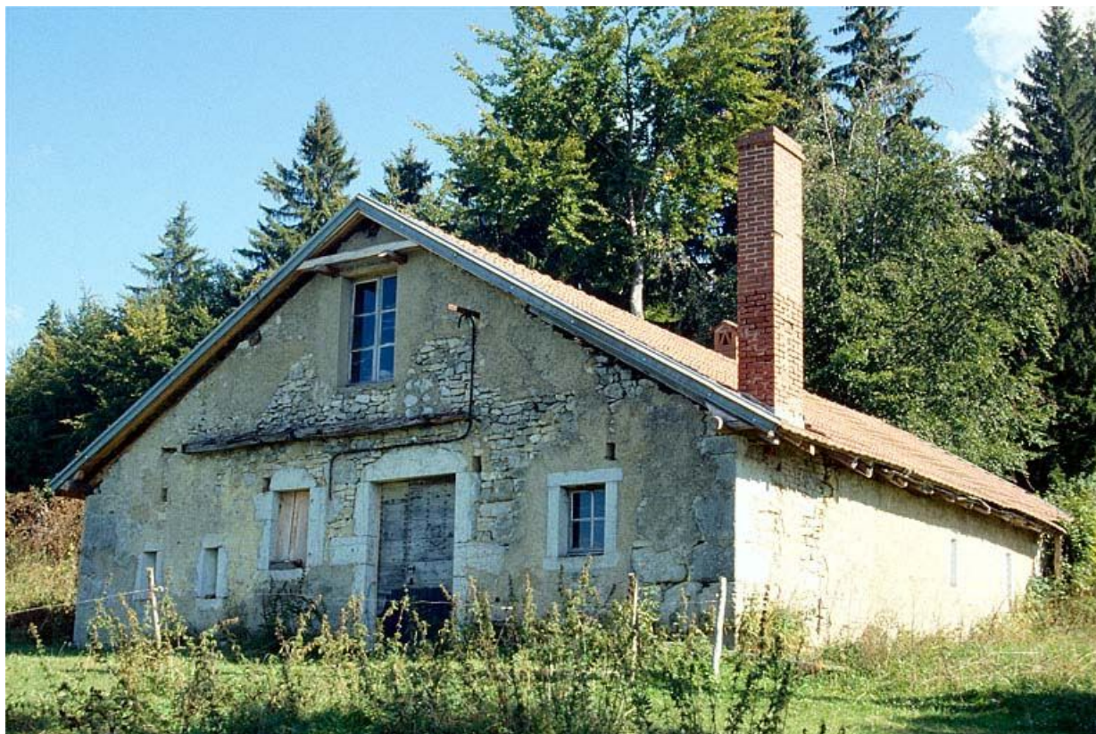
Vue générale de la fromagerie des Baptaillards, à Longchaumois.