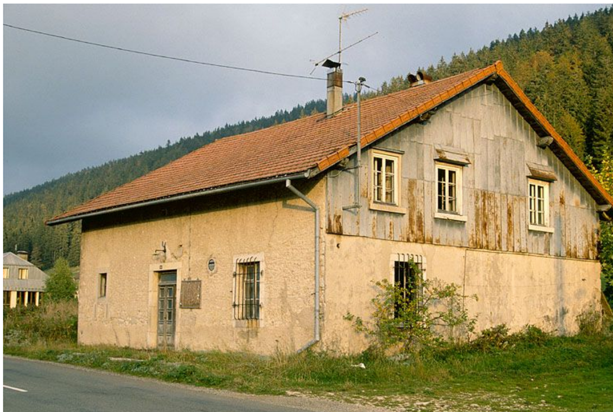
Vue générale de la fromagerie des Landes d'Aval, à Bois-d'Amont.