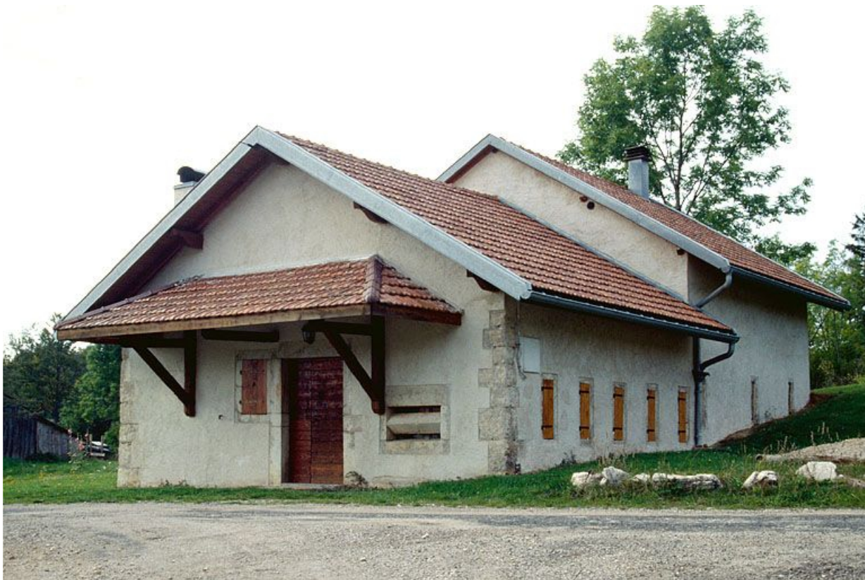
Façade antérieure de la fromagerie des Communailles, à Longchaumois, vue de trois quarts.