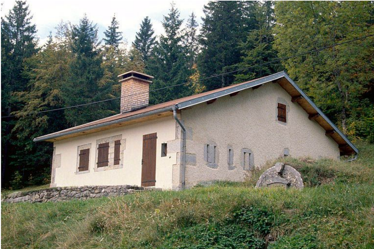
Vue générale de la fromagerie des Mandrillons, à Bellefontaine.