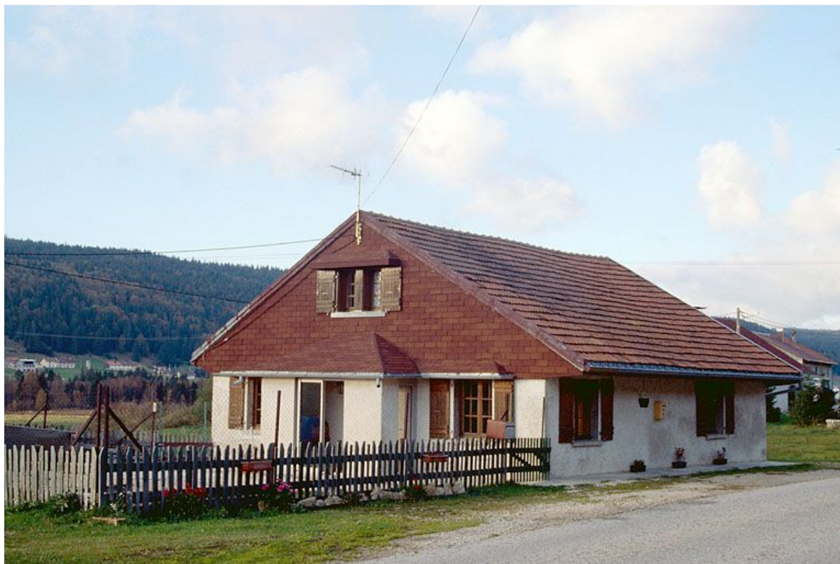
Vue générale de la fromagerie de la Bourbe, commune des Rousses.