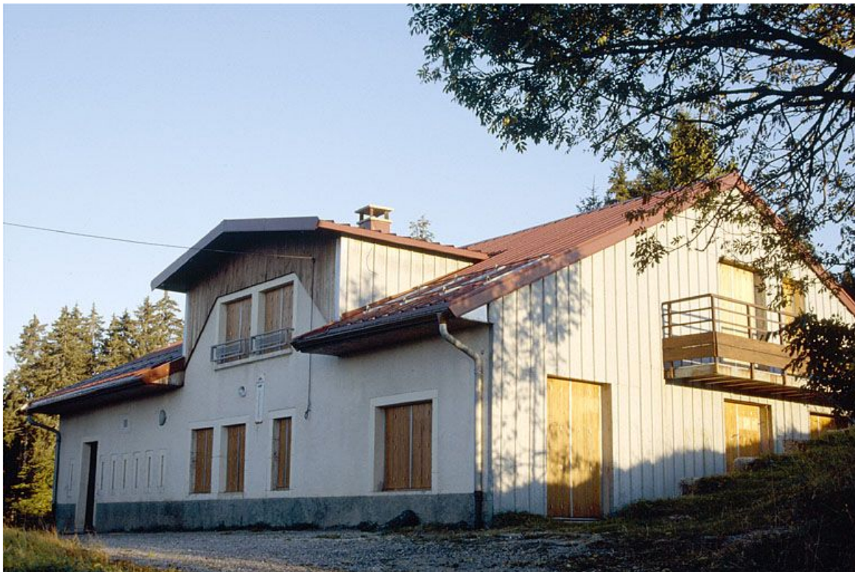
Vue générale de la fromagerie de la Halle, à Prémamanon.