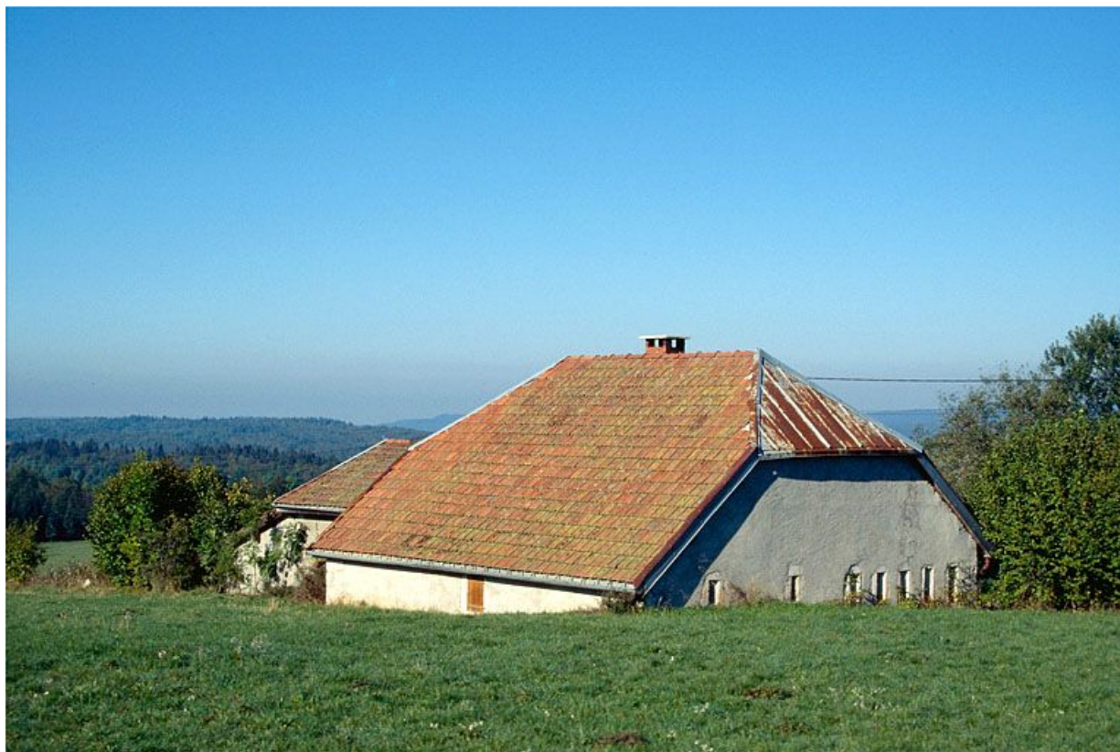
Vue générale de la fromagerie des Raisses, à Longchaumois.