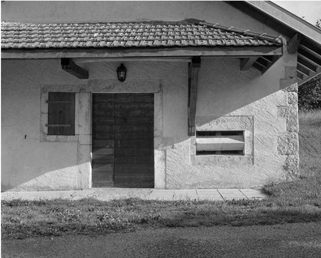
Porte d'entrée et baie fromagère de la fromagerie des Communailles, à Longchaumois.