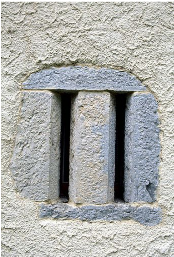
Baie fromagère de la fromagerie des Mandrillons, à Bellefontaine.