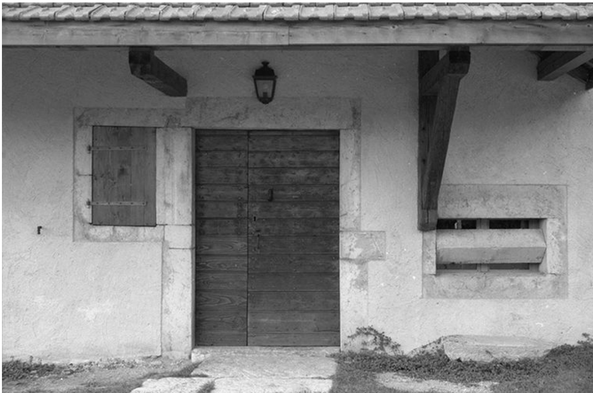
Porte d'entrée et baie fromagère de la fromagerie des Communailles, à Longchaumois.