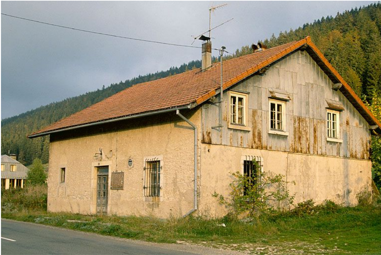
Vue générale de la fromagerie des Landes d'Aval, à Bois-d'Amont.