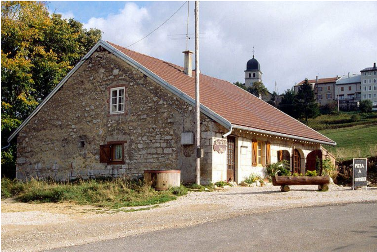
Vue générale de la fromagerie des Rousses en Bas.