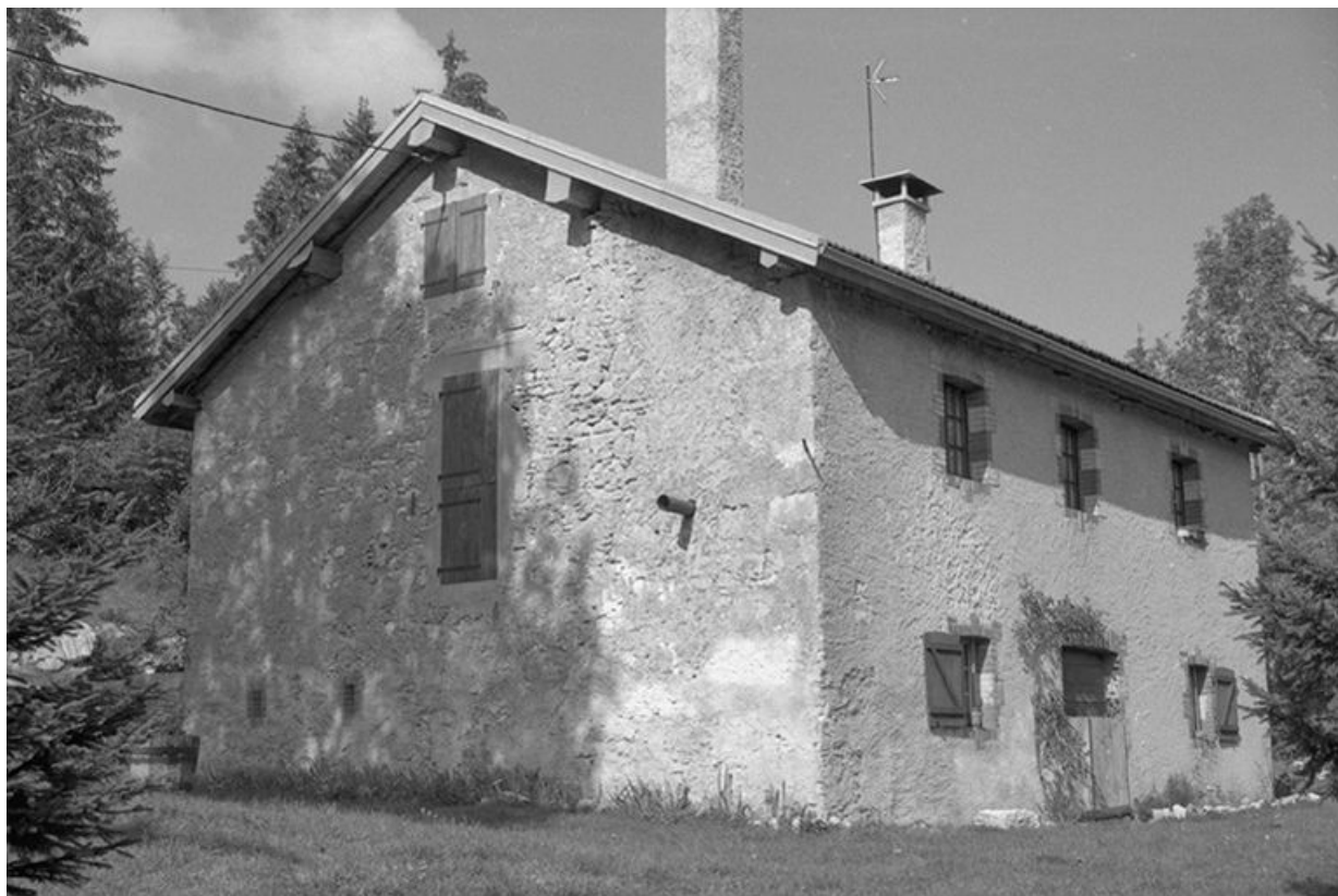
Vue générale de la fromagerie de la Combe Servagnat, à Longchaumois.