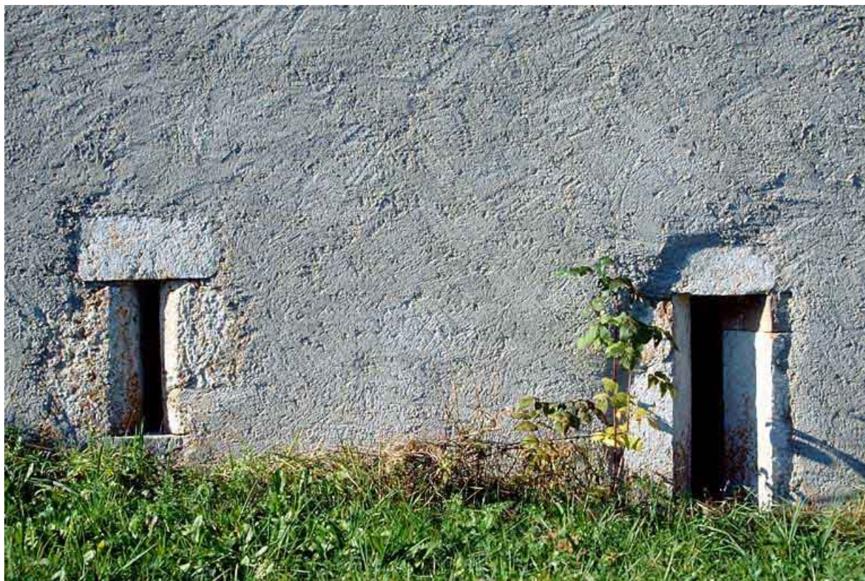
Baies fromagères de la fromagerie des Raisses, à Longchaumois.