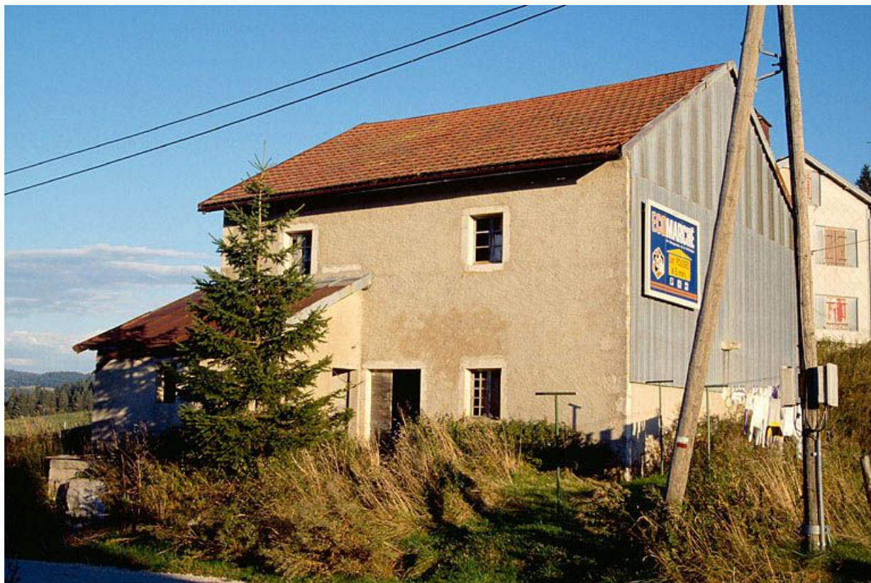
Façade postérieure de la fromagerie du village de Prémanon.