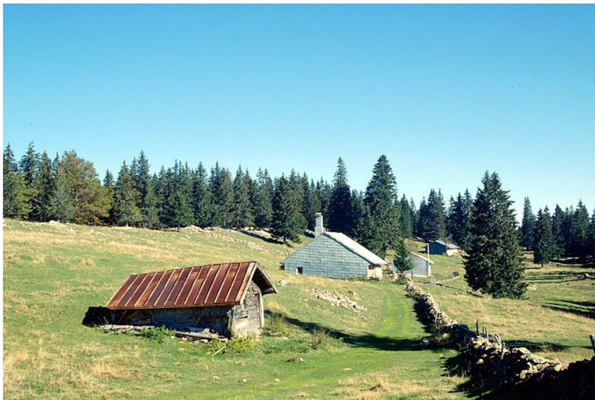
Vue de situation de la fromagerie des Petits Plats du Haut, à Bois-d'Amont.