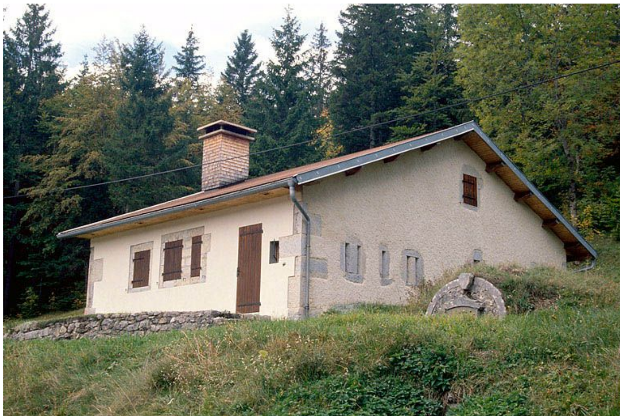
Vue générale de la fromagerie des Mandrillons, à Bellefontaine.