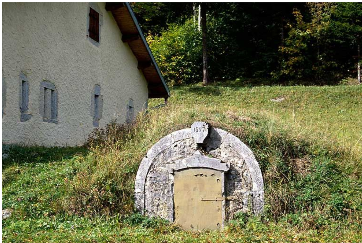
Citerne de la fromagerie des Mandrillons, à Bellefontaine, datée 1907.