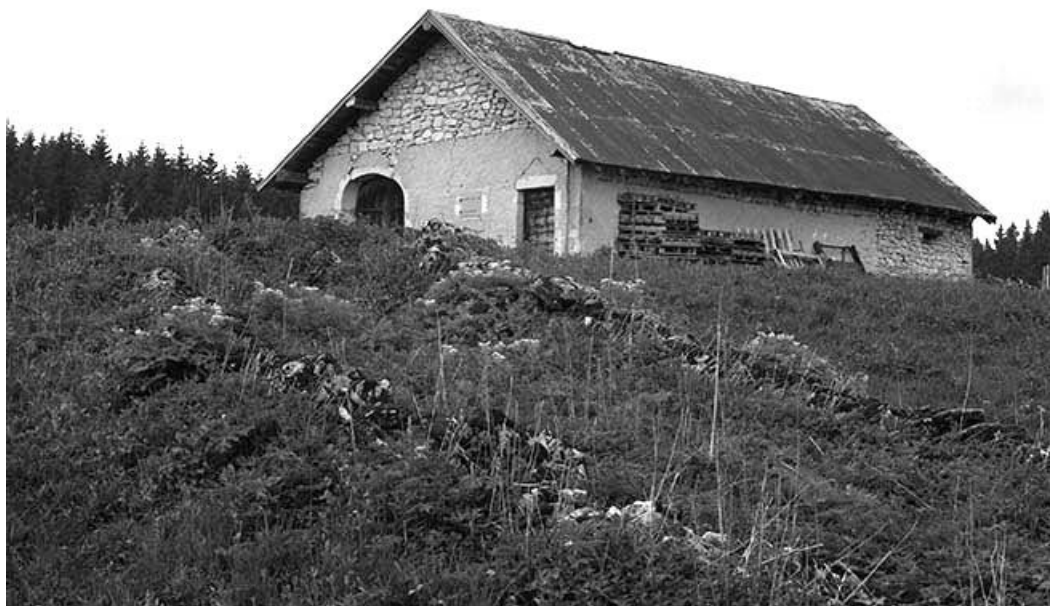
Façade antérieure et face droite d'une étable à vaches.