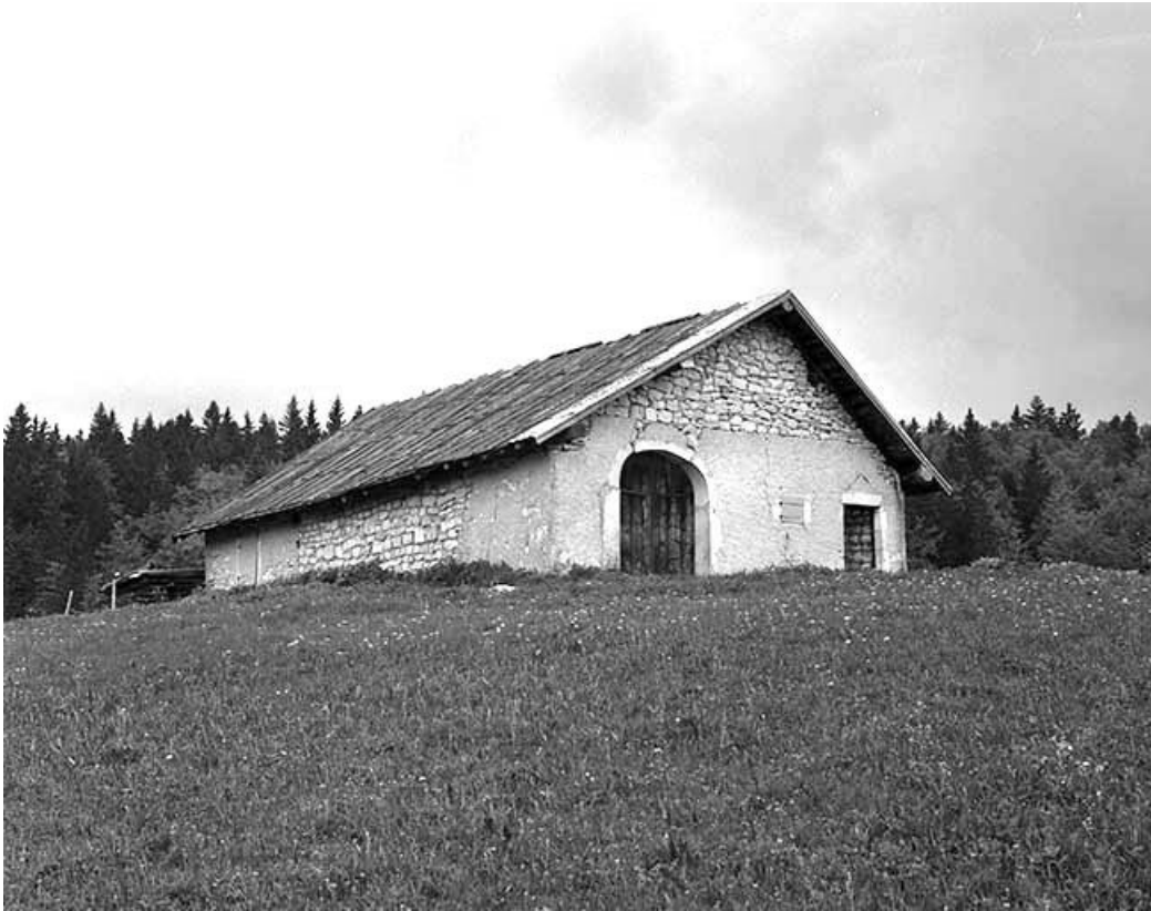
Façade antérieure et face gauche d'une étable à vaches. 39, Bellefontaine