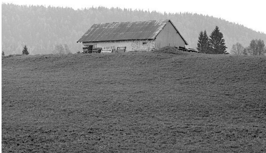
Façade postérieure et face droite d'une étable à vaches.