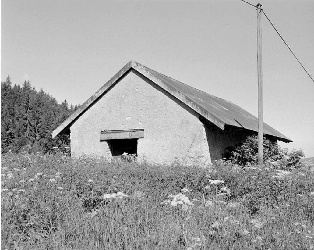
Façade antérieure d'une étable à vaches.