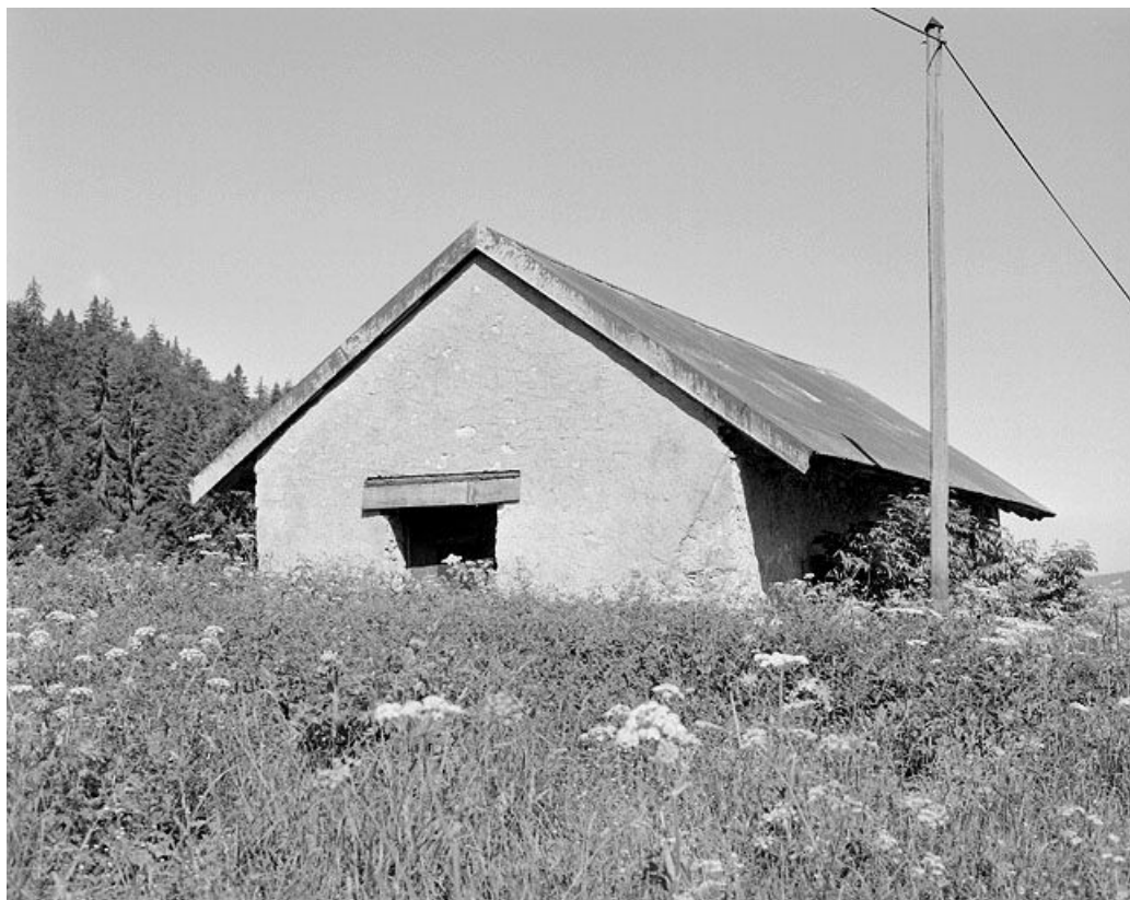
Façade antérieure d'une étable à vaches.