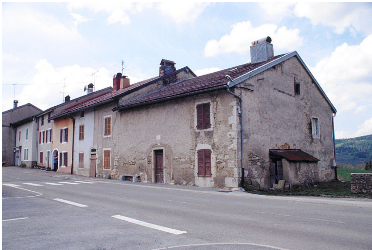
Façades antérieures des fermes bordant le C.D. 69 à la Mouille. 39, La Mouille