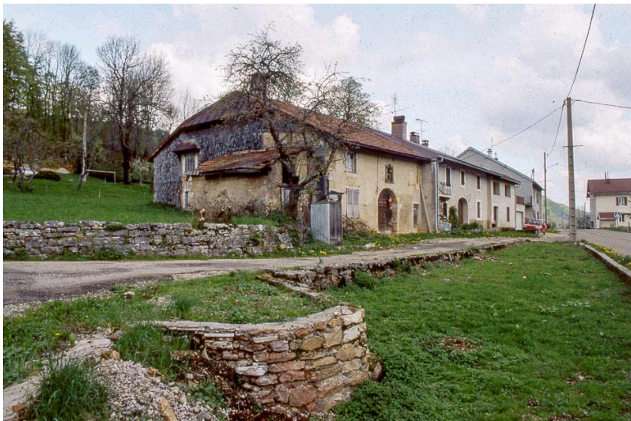
Ferme du village bordant le C.D. 26. 39, Lézat