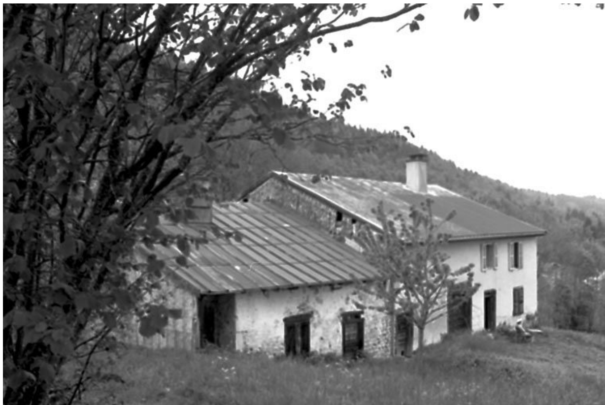
Façade antérieure vue de trois quarts.