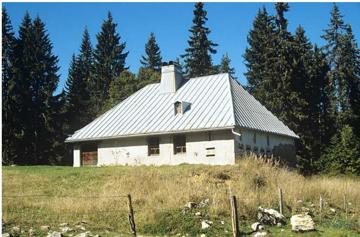
Vue générale de la façade antérieure du chalet d'estive du Petit Boulu.