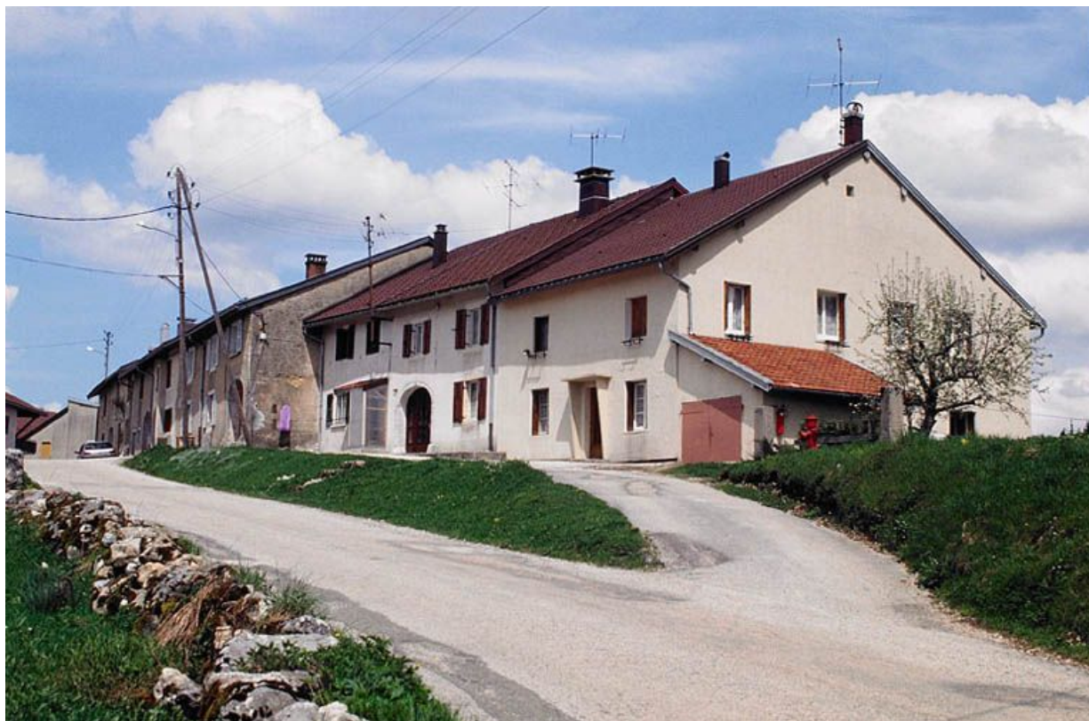
Façade antérieure des fermes du hameau du Bourgeat d'Amont. 39, La Mouille