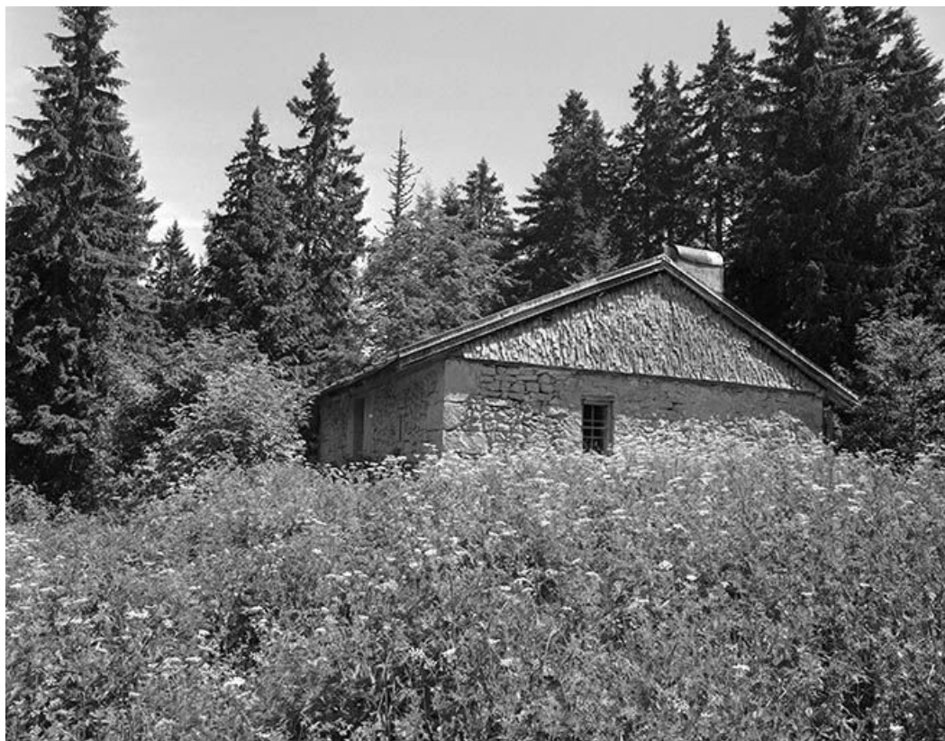
Façade postérieure et face gauche.