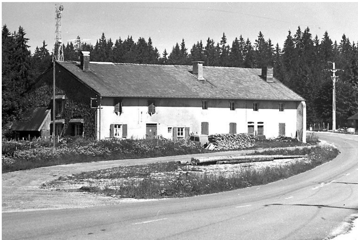
Vue éloignée de la façade antérieure.