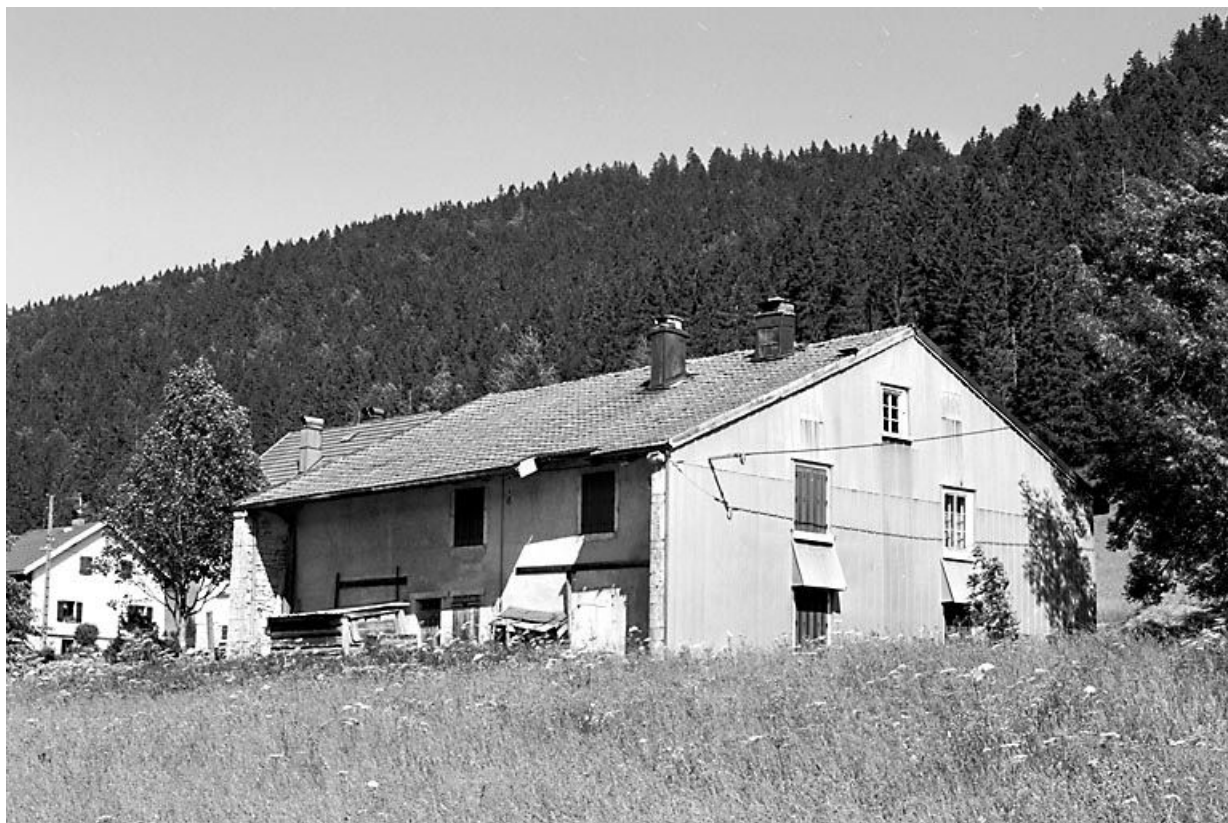
Façade antérieure et face droite.