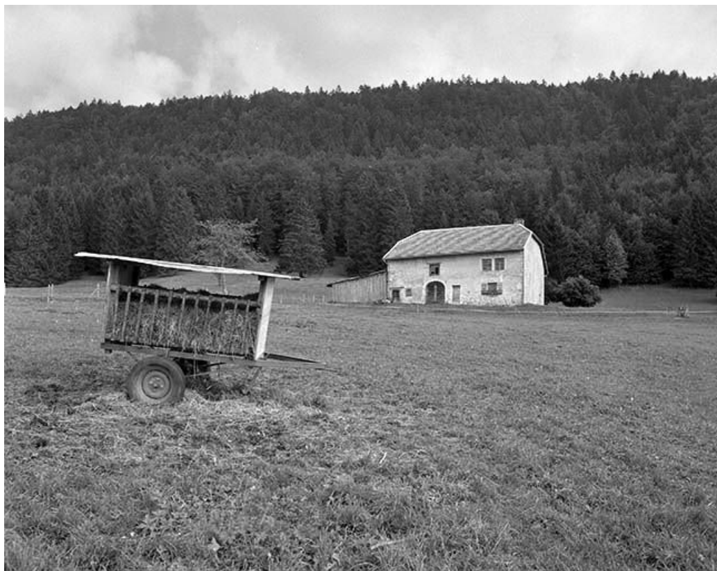
Façade antérieure, vue éloignée.