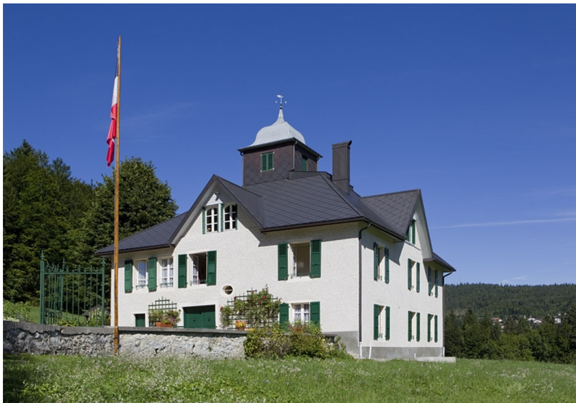
Façades antérieure et latérale droite, vues de trois quarts.

39, Morez ancien chemin de Saint-Claude à Morez, lieudit : Maison Lamartine