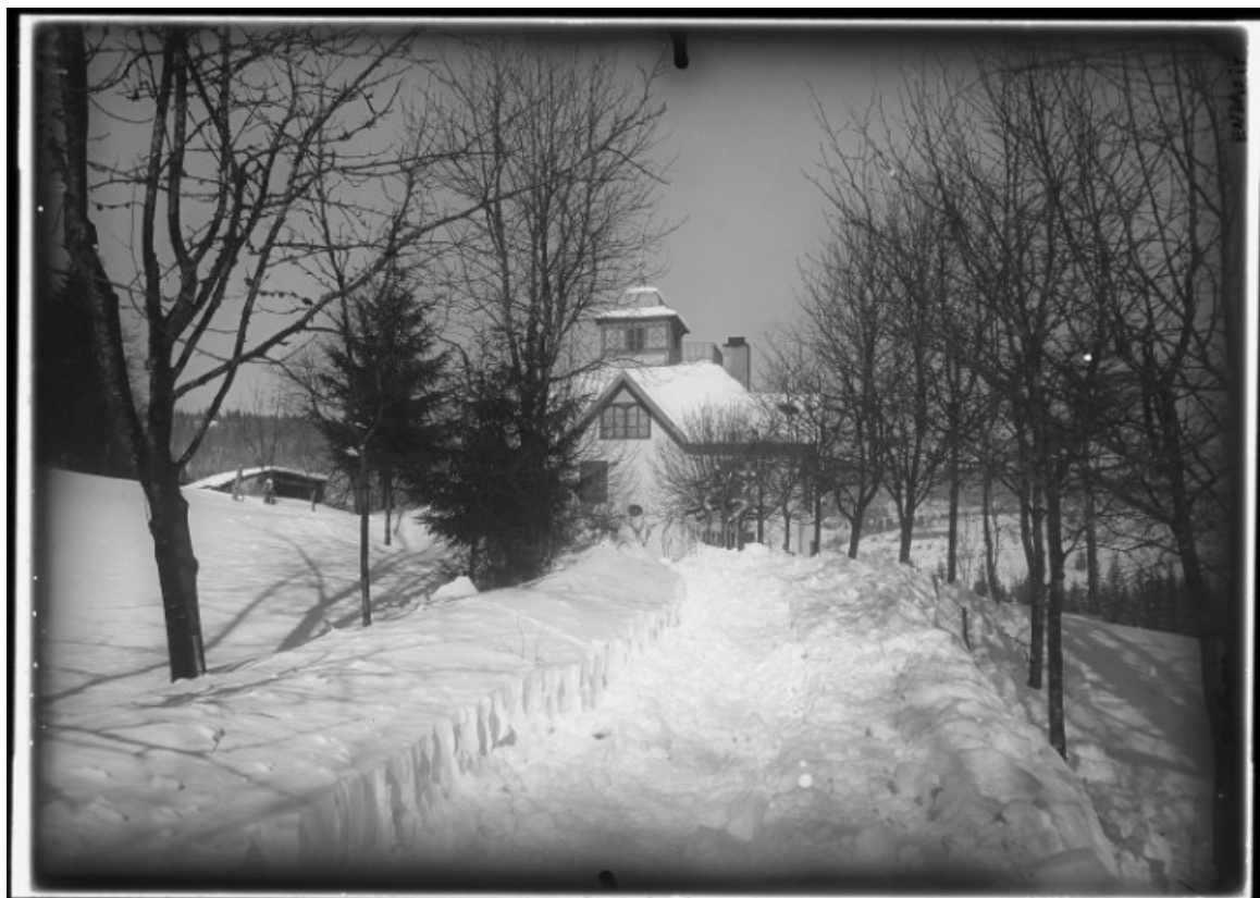
[Façade antérieure en hiver, vue éloignée], 1er quart 20e siècle ?

39, Morez ancien chemin de Saint-Claude à Morez, lieudit : Maison Lamartine