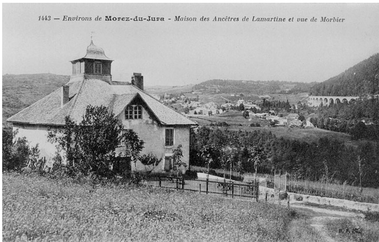
Environs de Morez-du-Jura - Maison des ancêtres de Lamartine et vue de Morbier, 1er quart 20e siècle.

39, Morez ancien chemin de Saint-Claude à Morez, lieudit : Maison Lamartine